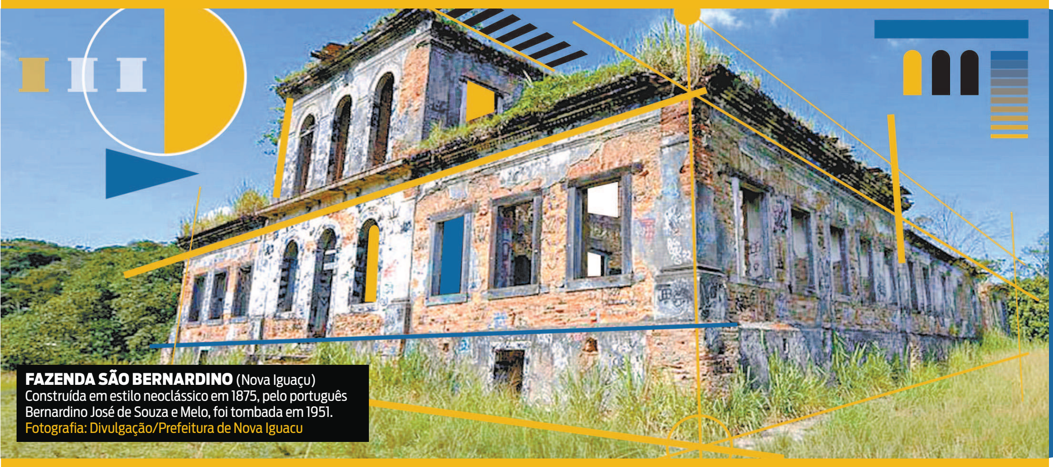
FAZENDA SÃO BERNARDINO (Nova Iguaçu) Construída em estilo neoclássico em 1875, pelo português Bernardino José de Souza e Melo, foi tombada em 1951.