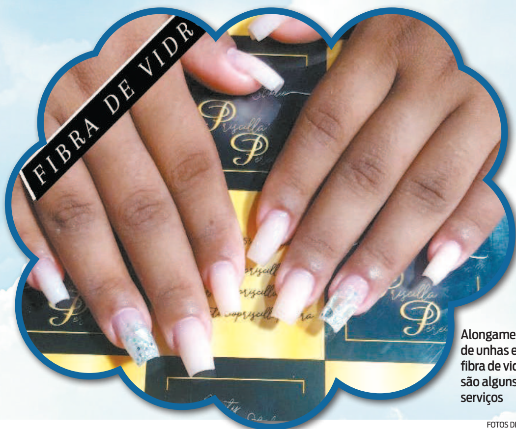
Alongamento de unhas e fibra de vidro são alguns dos serviços