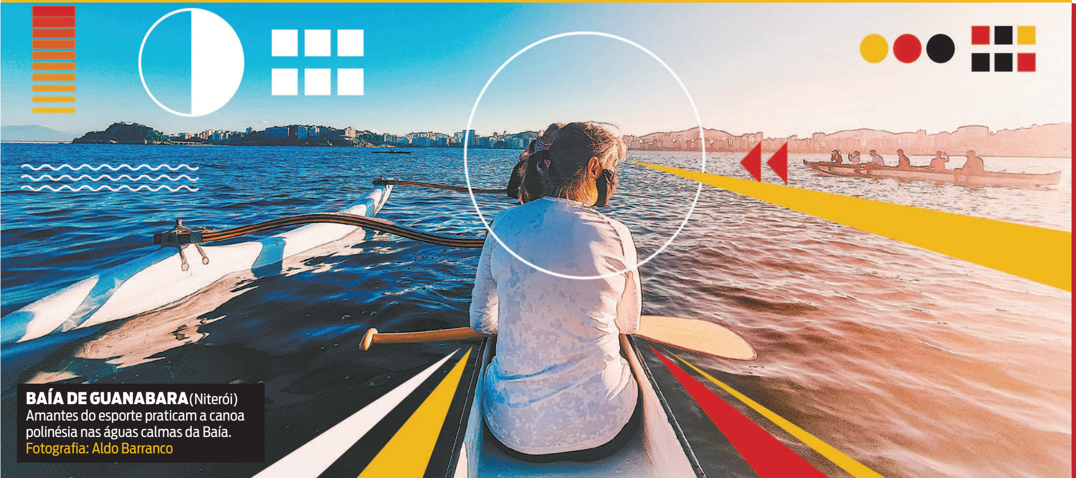
BAÍA DE GUANABARA (Niterói) Amantes do esporte praticam a canoa polinésia nas águas calmas da Baía.