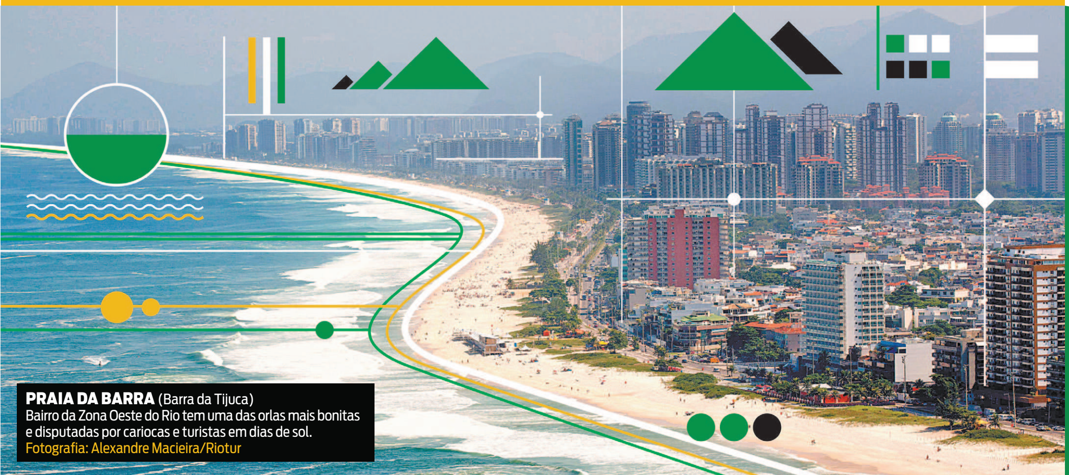
PRAIA DA BARRA (Barra da Tijuca) Bairro da Zona Oeste do Rio tem uma das orlas mais bonitas e disputadas por cariocas e turistas em dias de sol.