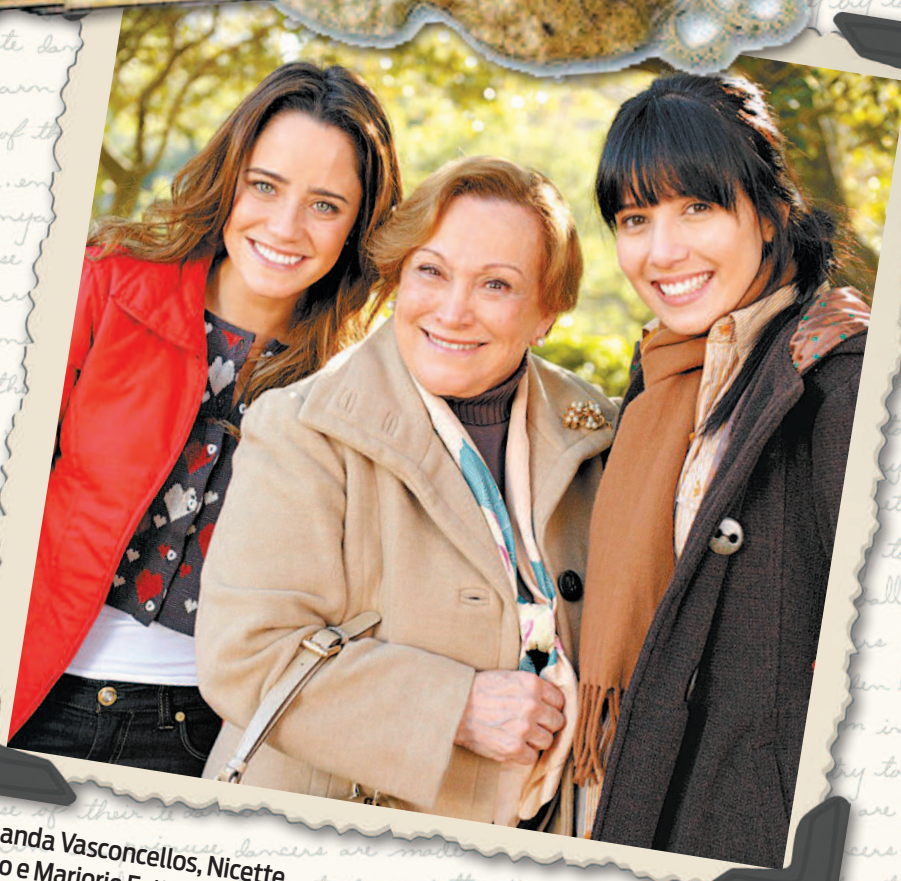
Fernanda Vasconcelos, Nicette Bruno e Marjorie Estiano