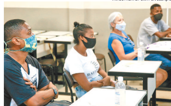
Vítimas de incêndio em Santa Cruz receberam benefício de R$ 400