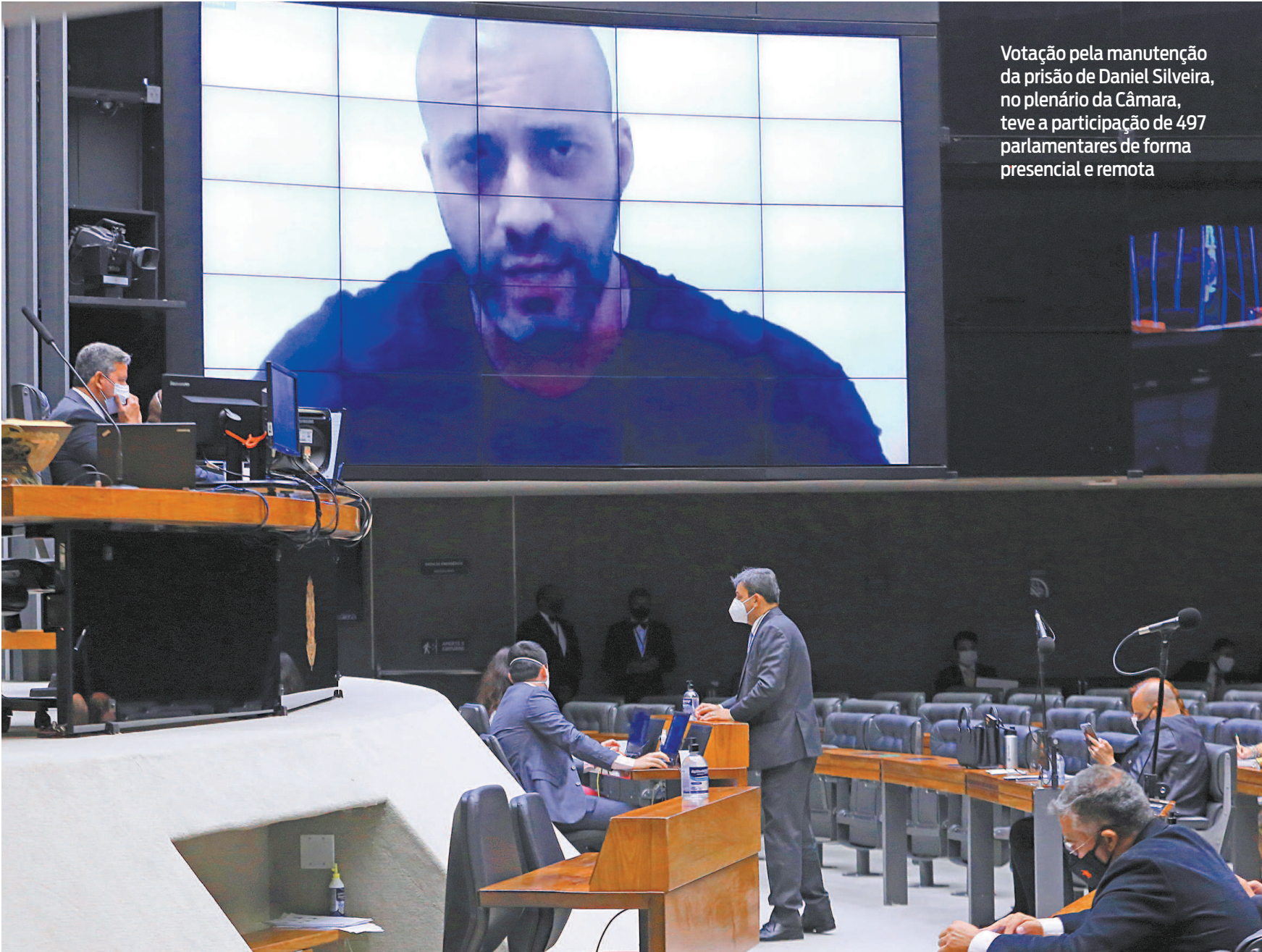
Votação pela manutenção da prisão de Daniel Silveira, no plenário da Câmara, teve a participação de 497 parlamentares de forma presencial e remota

Silveira se recusou a cumprir a orientação. A discussão foi registrada em vídeo e divulgada nas redes sociais por um assessor do deputado. A PGR quer apurar se Silveira cometeu crimes de desacato e infração de medida sanitária.