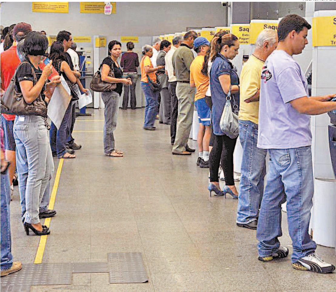
Ação da Febraban conta com parceria do Banco Central e de associações como ABBC, ABBI e Abecs