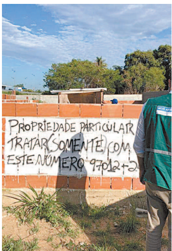
Operação contra irregularidade