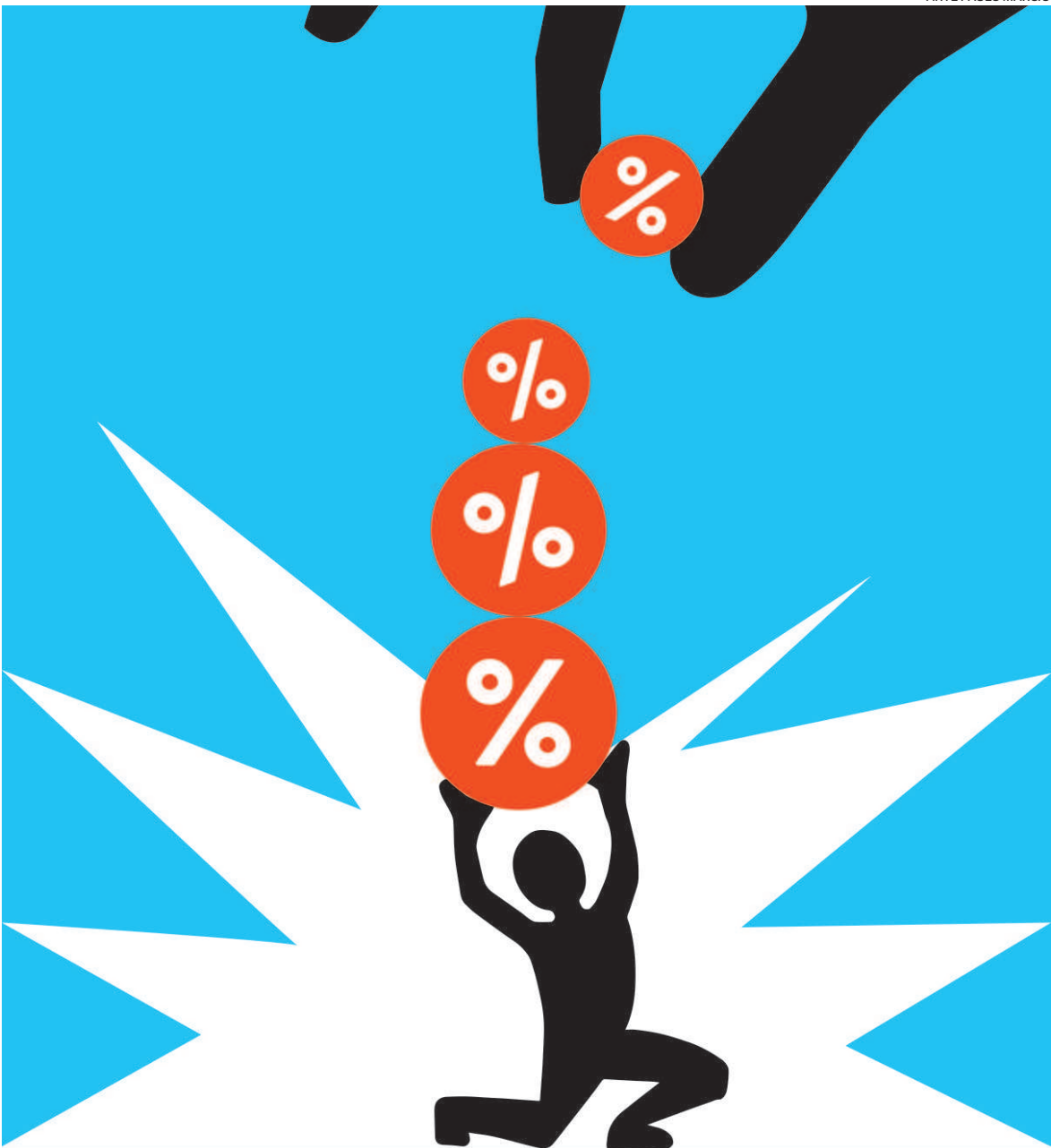
ARTE PAULO MÁRCIO

“Um ponto importante para indagar é se a prorrogação do auxílio emergencial será efetivamente aprovado”