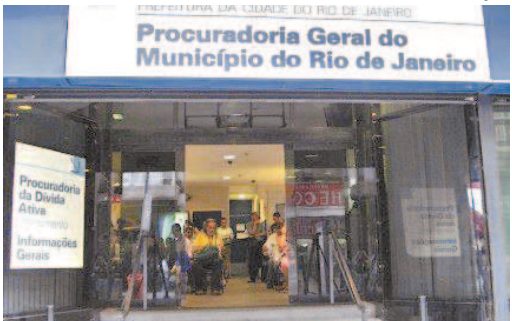
Procuradoria iniciou cobrança por meio do protesto em janeiro