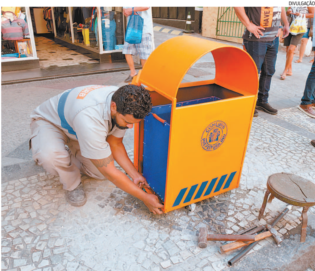
Em média, de 500 a 600 latas de lixo são vandalizadas ou furtadas por mês