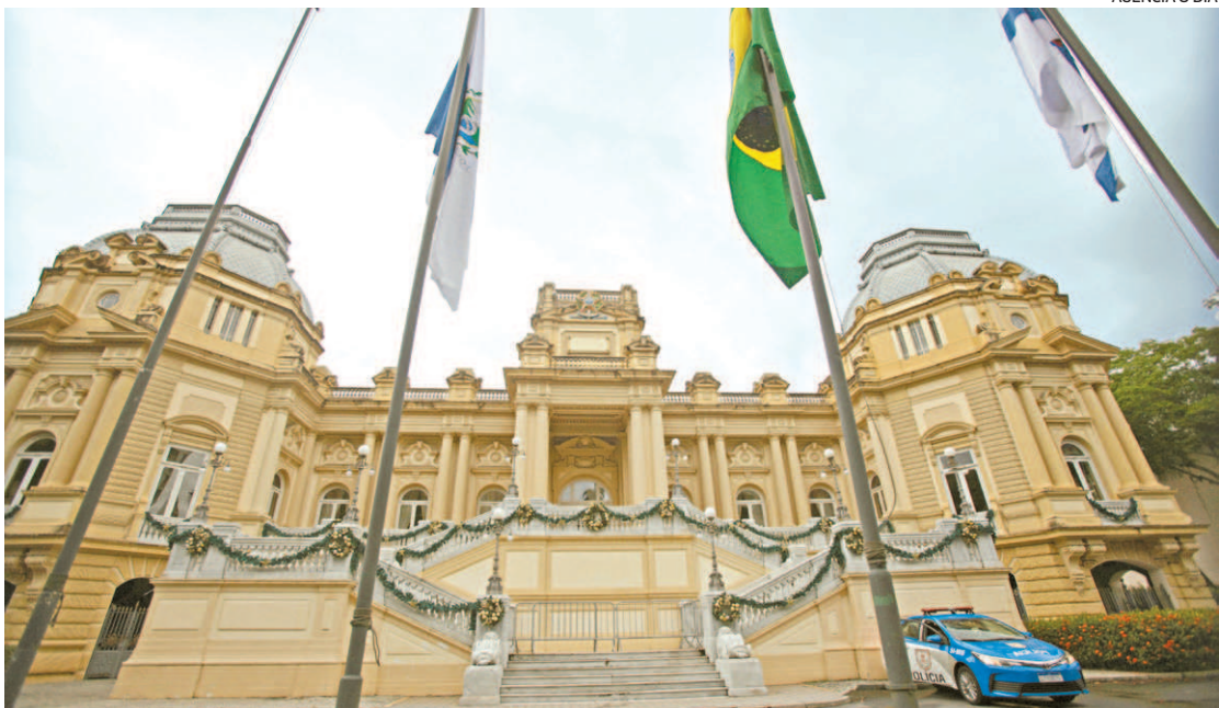
Todos os servidores ativos vinculados ao Poder Executivo estadual têm apresentar a declaração

Vale lembrar que a exigência alcança não só os estatutários, mas os profissionais comissionados também.