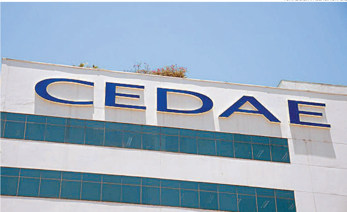
Pelo acordo, a Cedade ainda vai investir R$ 34 milhões em equipamentos e obras na Elevatória do Lameirão

Para isso, devem enviar um requerimento formal pelo e-mail revisaodecontalameirao@cedae.com.br . A mensagem eletrônica deverá informar nome completo, matrícula do imóvel, CPF do titular