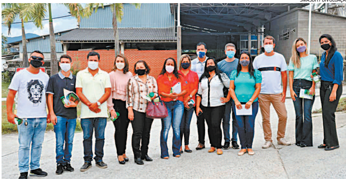
Equipe do programa Emboço Social, da Prefeitura de Magé, se reuniu para fechar parceria com empresa