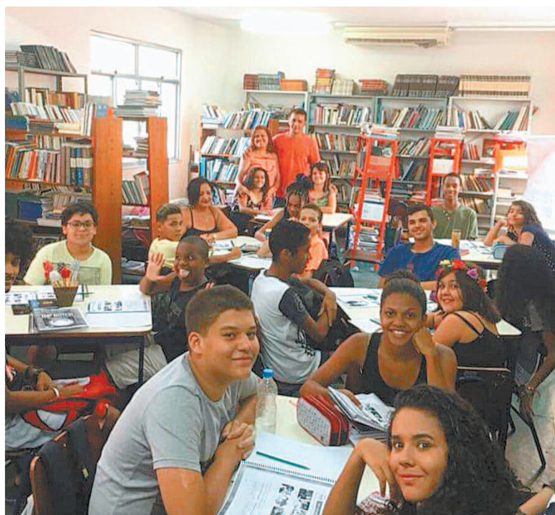
A Biblioteca Jornalista Tim Lopes tem um acervo de sete mil livros, para leitores de todos os gostos e idades