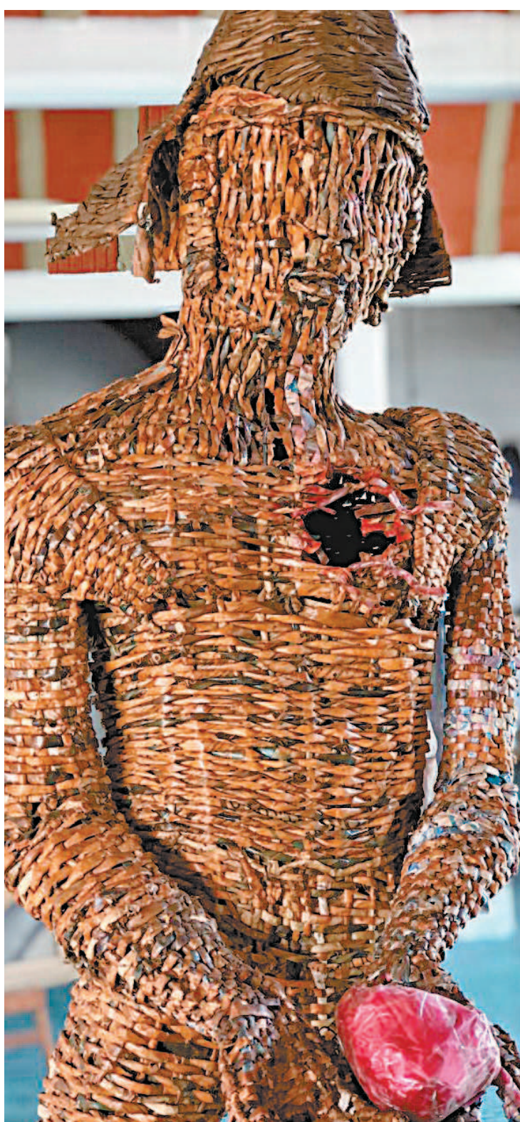
A Casa oferece diariamente exposição de esculturas e quadros