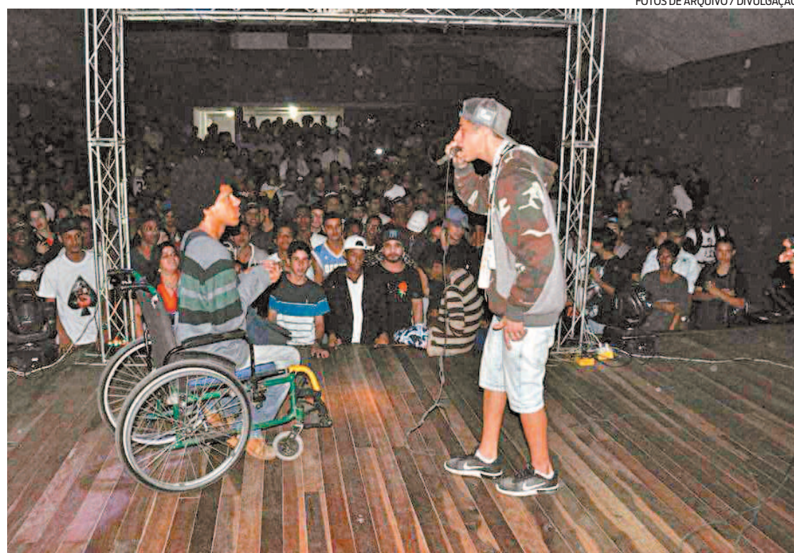
O espaço também tem outras atividades. Antes da pandemia, a Batalha de Rap reunia centenas de jovens

A Casa de Cultura fica localizada na Avenida Bob Kennedy, s/n, Nova Piam.