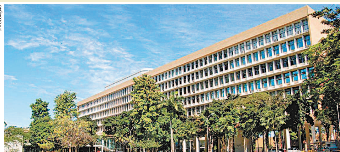
UFRJ investiga se pacientes transferidos de Manaus para o RJ têm nova variante da covid-19