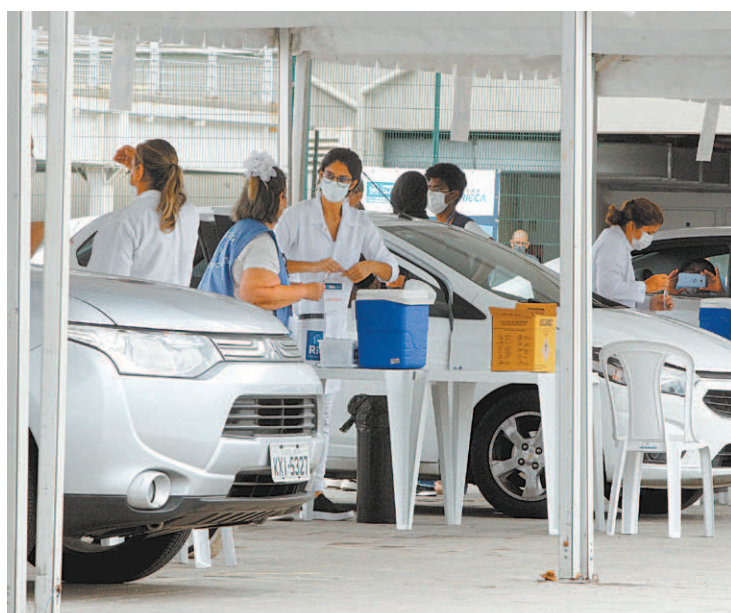
Drive-thru de vacinação no Parque Olímpico, na Barra da Tijuca