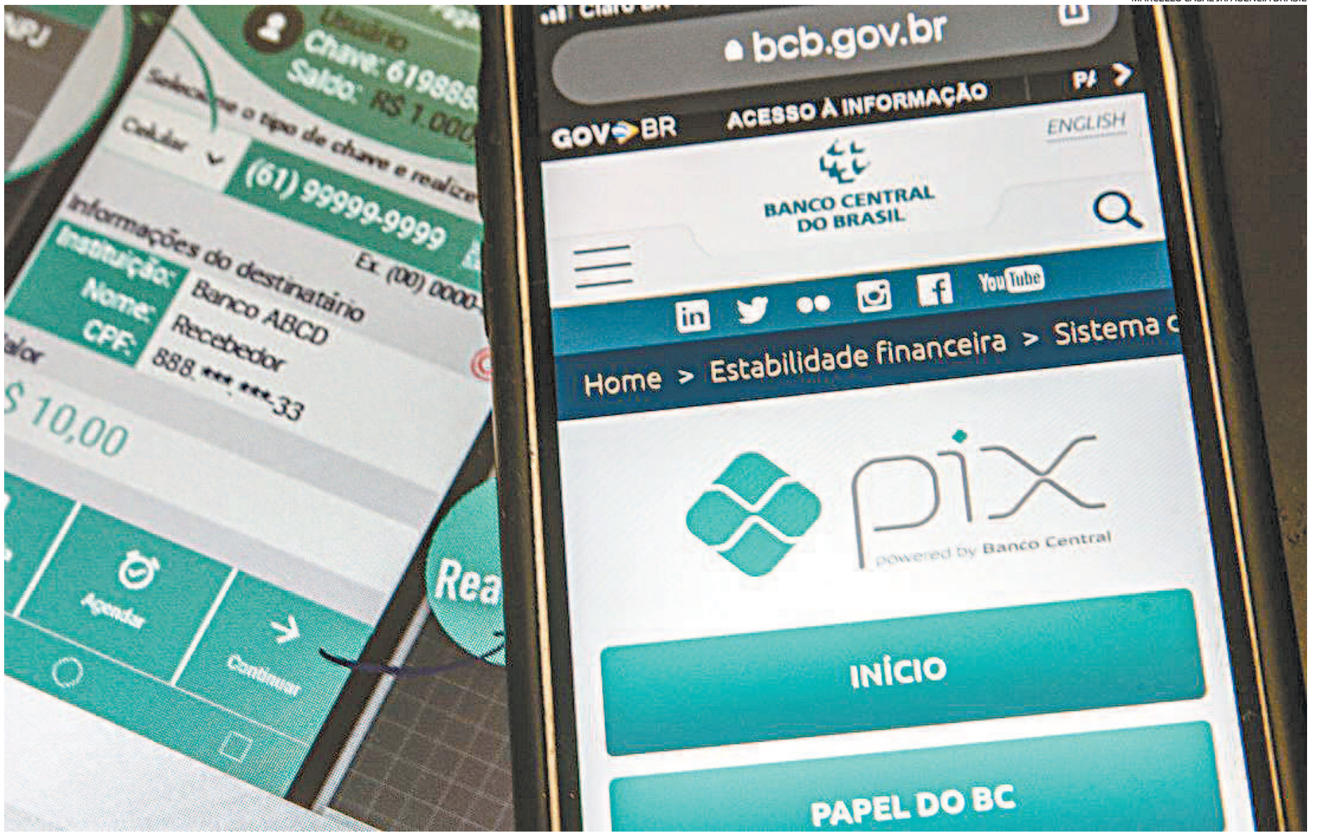
De acordo com o Banco Central, 'não há qualquer registro de problemas de segurança ou fraudes' envolvendo a ferramenta. Mas em iscas jogadas pelo WhatsApp para os desatentos

A principal isca do momento para golpes usando o Pix é o WhatsApp. Por meio de uma técnica chamada de