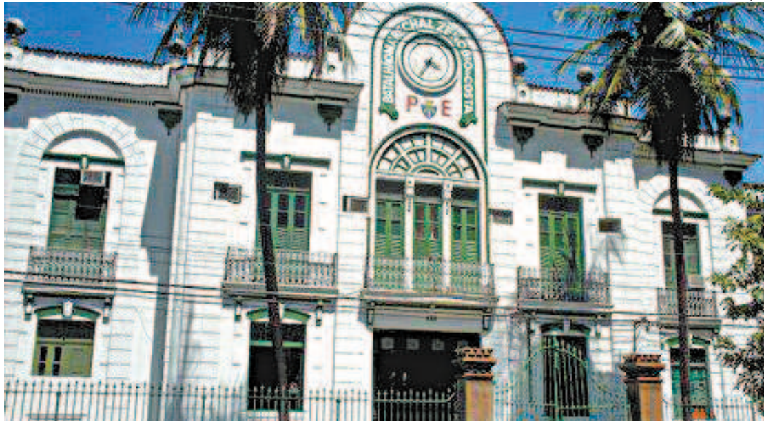
Primeiro Batalhão de Polícia no Exército do estado fluminense investiga denunciante e denunciado

militares disseram que também foram vítimas de assédio por parte do sargento. A instituição disse à emissora que foram adotadas as medidas cabíveis, e que não iria comentar o andamento das investigações. Procurado pelo DIA , o Exército não deu respostas sobre o caso.