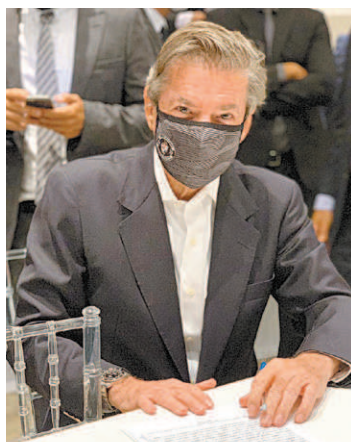
Salgado vai lutar até o fim

O Vasco ainda anexou na súmula da partida contra o Internacional, em São Januário, um ofício contra a falha do VAR, que não pôde usar o sistema de linhas do impedimento devido ao programa estar descalibrado, no lance do primeiro gol Colorado. O próximo passo será entrar no Superior Tribunal de Justiça