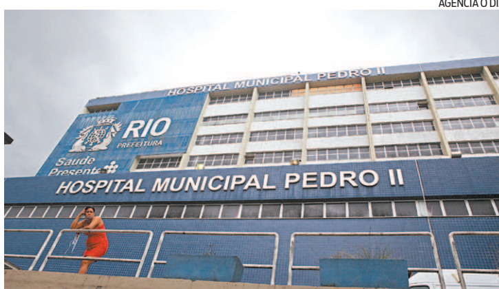
OSs administram algumas unidades municipais, como o Pedro II

Porém, a celebração dos contratos para gestão fica proibida caso o somatório dos contratos ultrapasse 30% do total disponível, ou o somatório de UPAs e Coordenação de Emergência Regional ultrapasse 30% do total de unidades deste tipo contra-