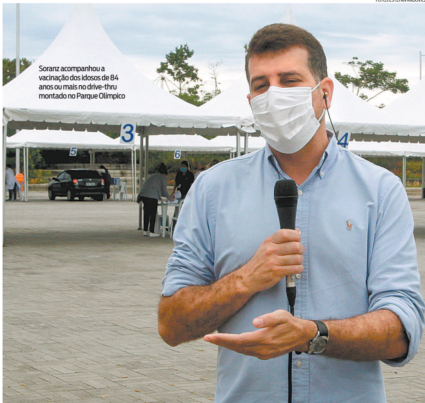
Soranz acompanhou a vacinação dos idosos de 84 anos ou mais no drive-thru montado no Parque Olímpico

A justificativa, segundo a assessoria de imprensa da SES, é que o Estado do Rio seguirá o Programa Nacional de Imunização (PNI), o calendário definido pelo Ministério da Saúde.