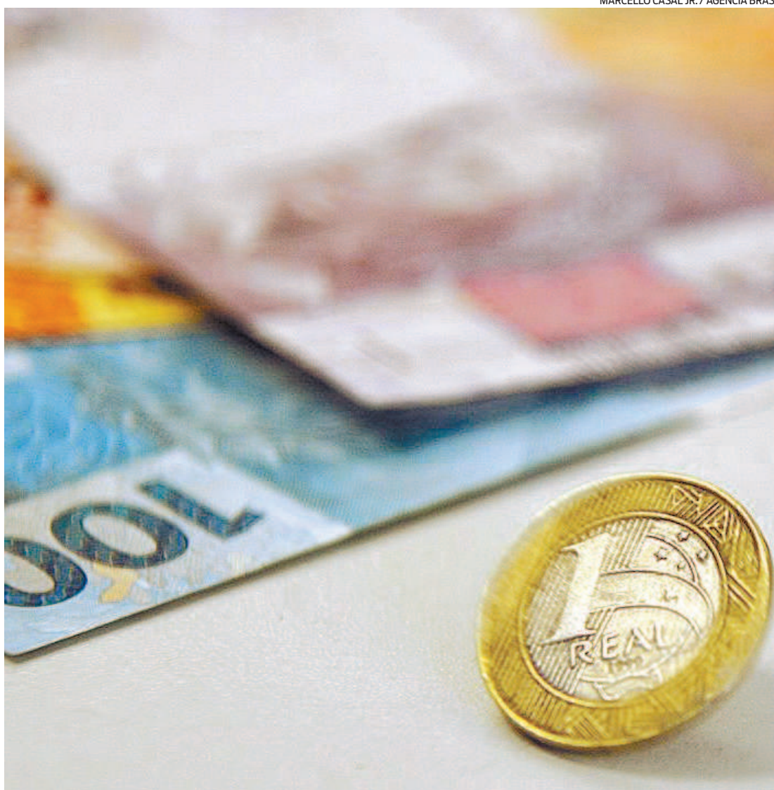
Com o fim do auxílio emergencial em dezembro muitas pessoas tiveram que recorrer a empréstimo

Glaciano aponta ainda que o cenário econômico deve se desenhar melhor até meados de 2021. “Caso não haja um avanço na economia, a tendência é que o estoque financeiro das famílias acabe gerando inadimplência e nova necessidade de tomada de crédito. Um ponto importante e que requer atenção se dá ao fato da tomada de crédito ser utilizada para a subsistência”, reforça.