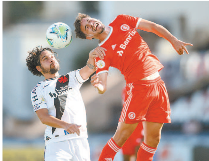
Vasco e Inter, jogo que ficará marcado pela polêmica do VAR