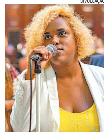
Dani Monteiro entrega relatório

■ A deputada Dani Monteiro (PSOL) entrega o relatório final da Comissão Especial da Juventude da Alerj com proposta de criação de plano de ação para promoção do trabalho para jovens de 18 a 29 anos. "Somos um batalhão de quase 4 milhões de pessoas", diz. O trabalho reuniu mais de 800 voluntários em audiências públicas, visitas técnicas e escutas temáticas.