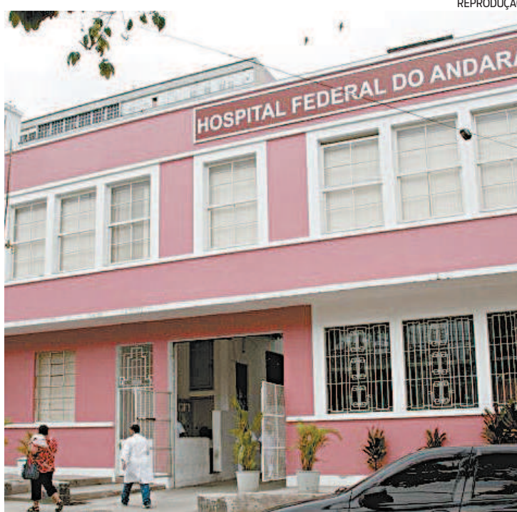
TCU apura disponibilidade de leitos nos seis hospitais federais no estado

Diante disso, o tribunal determinou que o Ministério