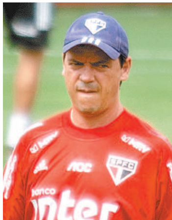
Diniz comandava o São Paulo

O Botafogo, inclusive, corre contra o tempo para acertar logo com um técnico. A expec-