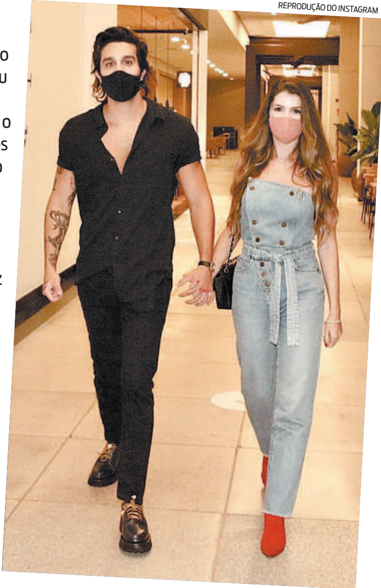
REPRODUÇÃO DO INSTAGRAM

Por todos os motivos elencados por esta coluna de seis leitores, pessoas próximas estão falando que o flagra foi armado, inclusive sem o consentimento do estabelecimento que prima pela discricção.