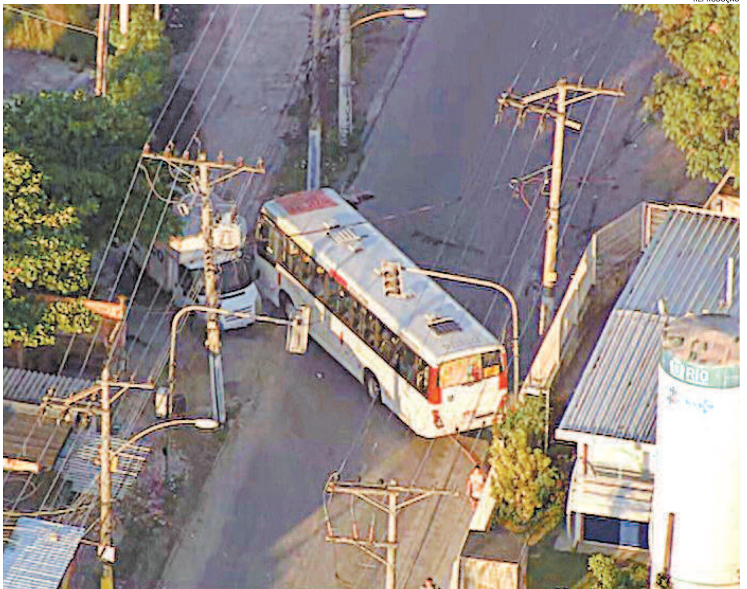
Bandidos atravessam ônibus e caminhão para fechar rua da Vila Aliança: uma cena que tem sido comum no dia a dia do Rio de Janeiro

A reportagem também entrou em contato com a SuperVia, que sofre com a violência dos trens urbanos na cidade. A empresa informou que registrou dois casos de trens abordados por homens armados. Um em 2019 e o outro em 2020. A concessionária “lamenta que a falta de segurança observada em todo o estado atinja também o sistema ferroviário”.