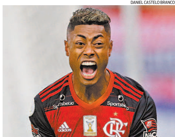
O atacante Bruno Henrique foi liberado pela Justiça Desportiva