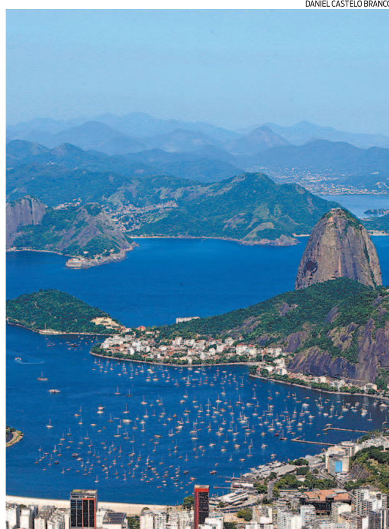
DANIEL CASTELO BRANCO

O levantamento avalia, desde 2013, a evolução dos serviços essenciais nas grandes cidades brasileiras sob a influência das prefeituras - mesmo que fornecidos por outros entes públicos ou pela iniciativa privada. Os 100 municípios analisados pela Macroplan representam metade do PIB brasileiro e concentram 39,3% da população do país.