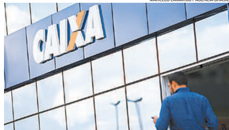
Não-correntistas da Caixa recebem o valor em conta digital

Têm direito ao abono os trabalhadores inscritos no PIS/Pasep, há pelo menos cinco anos, que estejam com os dados atualizados pelo empregador na Relação Anual de Informações Sociais (Rais) ou eSocial, conforme categoria da empresa. Os beneficiários devem ter trabalhado com carteira assinada por pelo menos um mês em 2019, recebendo até dois salários mínimos.