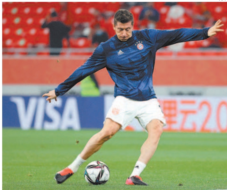
Eleito o melhor do mundo, Lewa quer ‘a cereja do bolo’ no Bayern