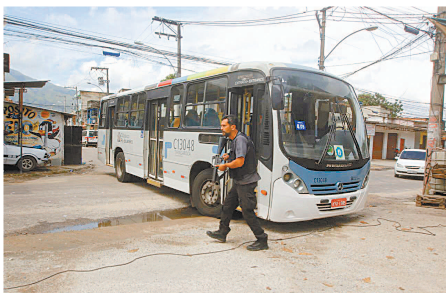
Criminosos usam ônibus como barricada para dificultar acesso à Vila Aliança

Policiais conduzem um dos sete homens presos na ação de ontem em Senador Camará