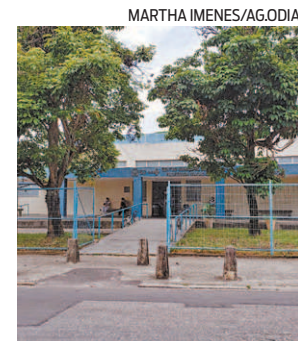
Posto no Sulacap

“É essa estrutura que queremos levar para o Rio de Janeiro. Os idosos são os que mais morrem dessa doença. Se temos a estrutura e a experiência, por que não fazer uma parceria para vacinar o maior número de idosos possíveis?”, questiona Inocentini.