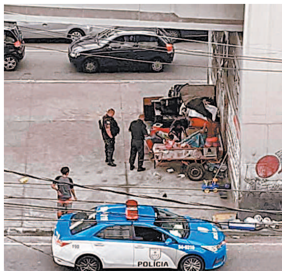
Policiais levam alimentos e brinquedos para família

Policiais parados embaixo do viaduto Negrão de Lima, na extensão do BRT, levando alimentos e brinquedos para uma criança de um pouco mais de um ano de idade, que vive com sua família em meio a entulho, móveis e até uma carrocinha