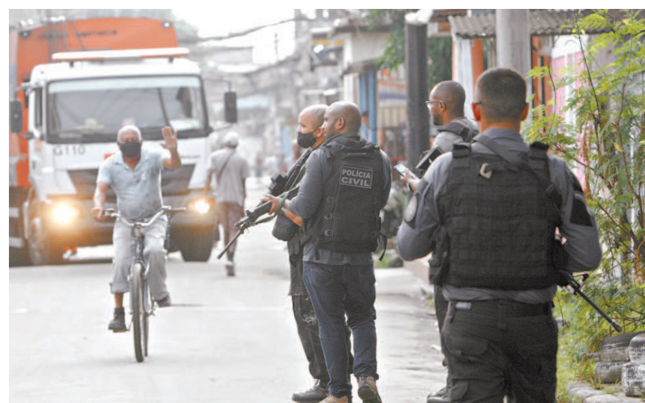
Agentes da Civil patrulham a comunidade da Coréia: apreensão de arma e veículos