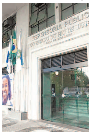
Defensoria notifica entes