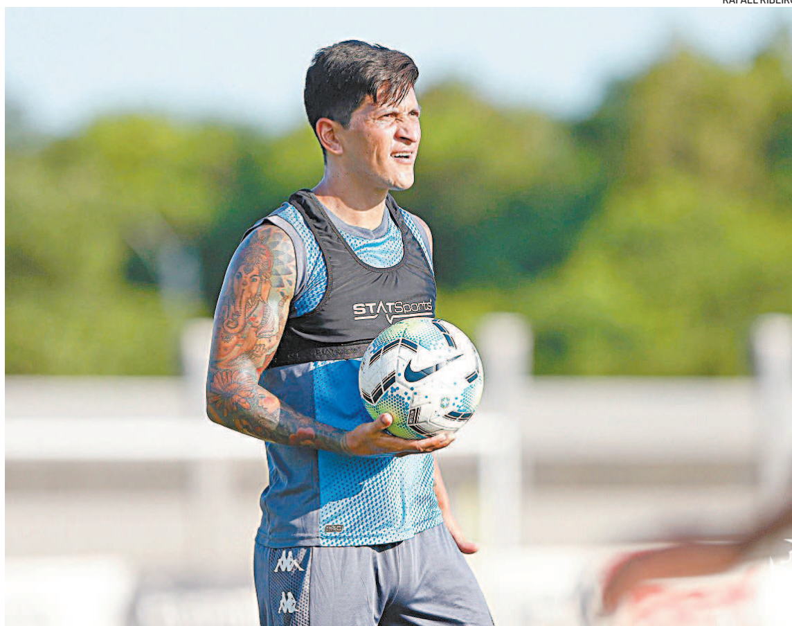
Cano é a esperança do Vasco para voltar a vencer no Campeonato Brasileiro e deixar a zona de rebaixamento