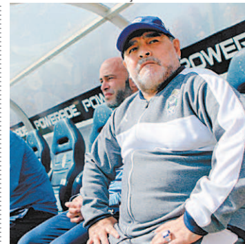
Maradona: morte em novembro

cabeça. Os três novos investigados devem comparecer esta semana diante do Ministério Público para notificação e nomeação de advogados, informou a fonte citada pela imprensa local.