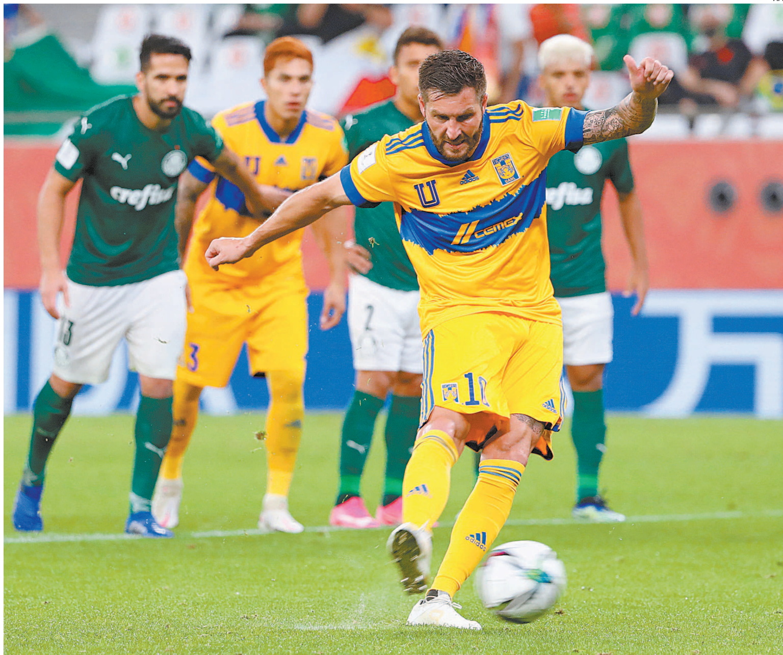
O francês Gignac cobra o pênalti que garante a vitória do Tigres e acaba com o sonho do Palmeiras de seguir na luta pelo inédito Mundial de Clubes

O português Abel Ferreira repetiu a escalação campeã da Libertadores diante do Santos. A ordem era marcar forte, pressionar a saída de bola e explorar a rapidez de Rony e o oportunismo de Luiz Adriano. Mas o Palmeiras demorou para encaixar seu futebol no estádio Education City, em Doha. Logo de cara, um susto. Weverton fez milagre logo com três minutos, em cabeçada de González.