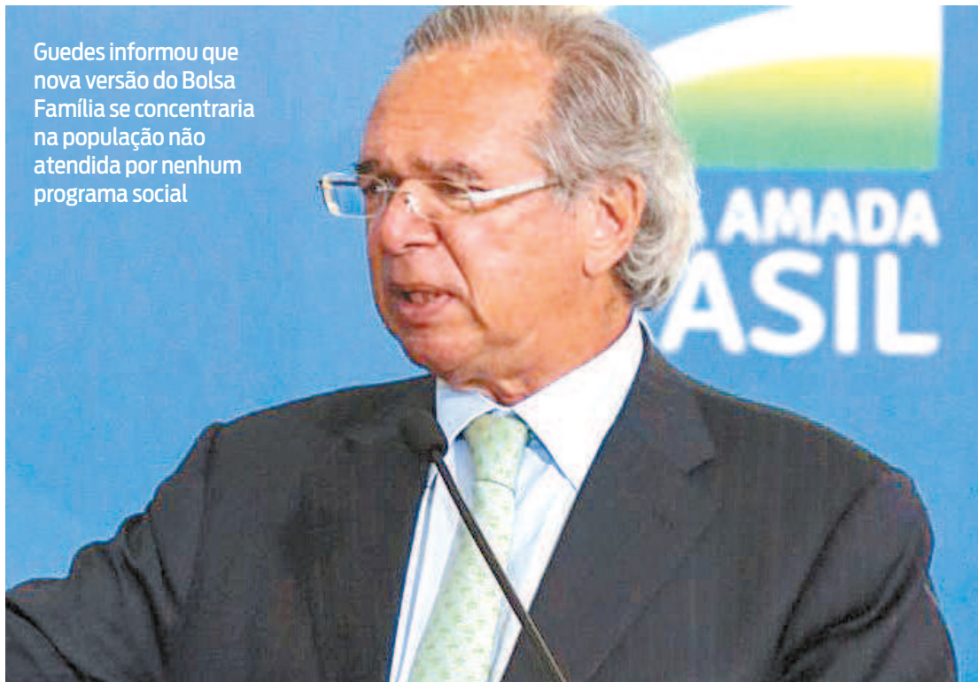
Guedes informou que nova versão do Bolsa Família se concentraria na população não atendida por nenhum programa social

“É possível. Nós temos como orçar isso, desde que seja dentro de um novo