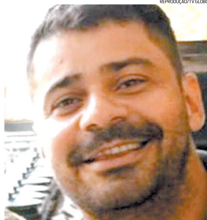
Polícia quer encontrar suspeito de matar policial civil em assalto

O policial reagiu e atirou, acertando dois suspeitos, mas foi baleado e morreu.