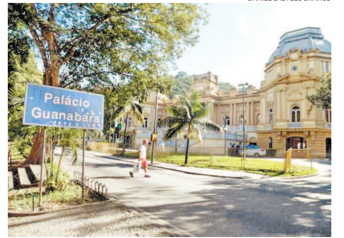
Governo cobra declaração de bens patrimoniais pelo Sispatri