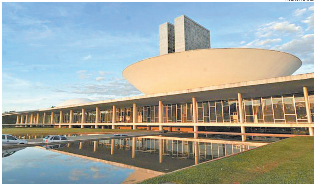
AGÊNCIA BRASIL Governo federal e Parlamento mostraram alinhamento para avançar com a agenda de reformas

A principal é a estabilidade como regra para todo o funcionalismo. E, ao invés de cinco vínculos no serviço público, como vem sendo proposto, manter apenas três vínculos: por prazo determinado, cargo efetivo e cargo de liderança e assessoramento.