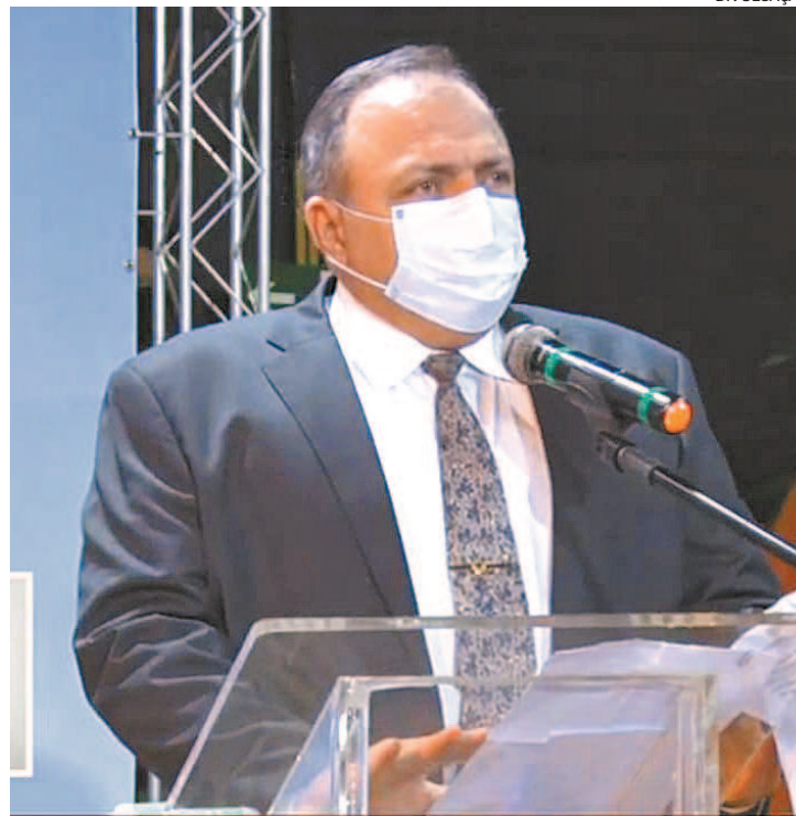
Ministro Eduardo Pazuello participou do lançamento do edital

VACINAS EM NEGOCIAÇÃO O ministro informou que há ainda outras vacinas em negociações com o governo para ofertar à população. “Continuamos avançando com negociações em outros laboratórios como a Janssen, a Pfizer, a Precisa, a Bharat Biotech indiana e a Suptnik da Rússia. Todas elas estão na prateleira