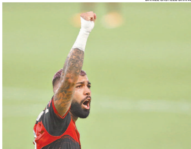
Gabigol já é um dos maiores ídolos da história do Flamengo