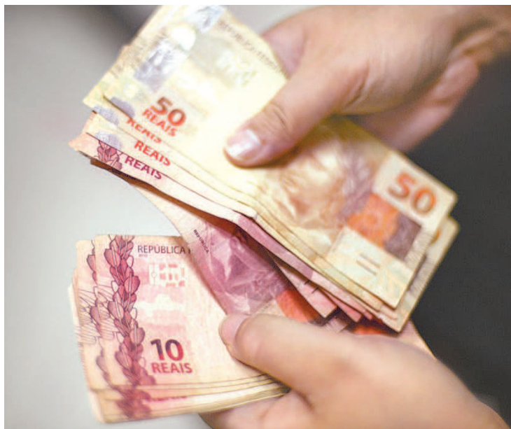
Novo calendário de pagamento: resolução foi publicada ontem

A Caixa Econômica Federal depositará o dinheiro na conta corrente informada pelo trabalhador ou na conta poupança digital, usada para pagar o auxílio emergencial, para quem não é cliente do banco. As poupanças digitais podem ser movimentadas pelo aplicativo Caixa Tem, que permite o pagamento de contas domésticas (água, luz, telefone e gás), boletos bancários, compras com cartão de débito virtual pela internet e compras com código QR (versão avançada do código de barras) em estabele-