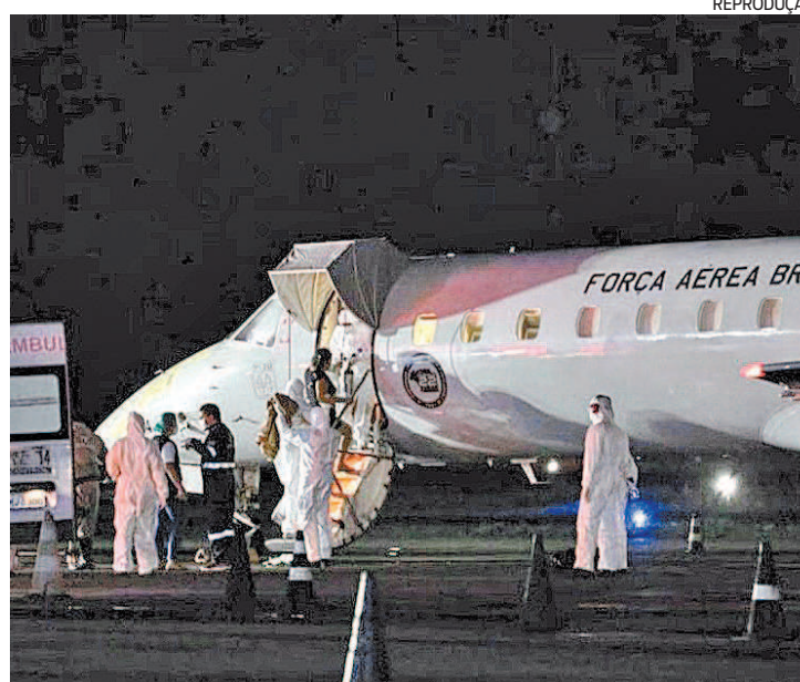
Pacientes vieram em avião da FAB e desembarcaram no Galeão

Segundo o ministério, as pacientes transferidas são colocadas em áreas de isolamento e foram examinadas antes de embarcarem para o Rio.