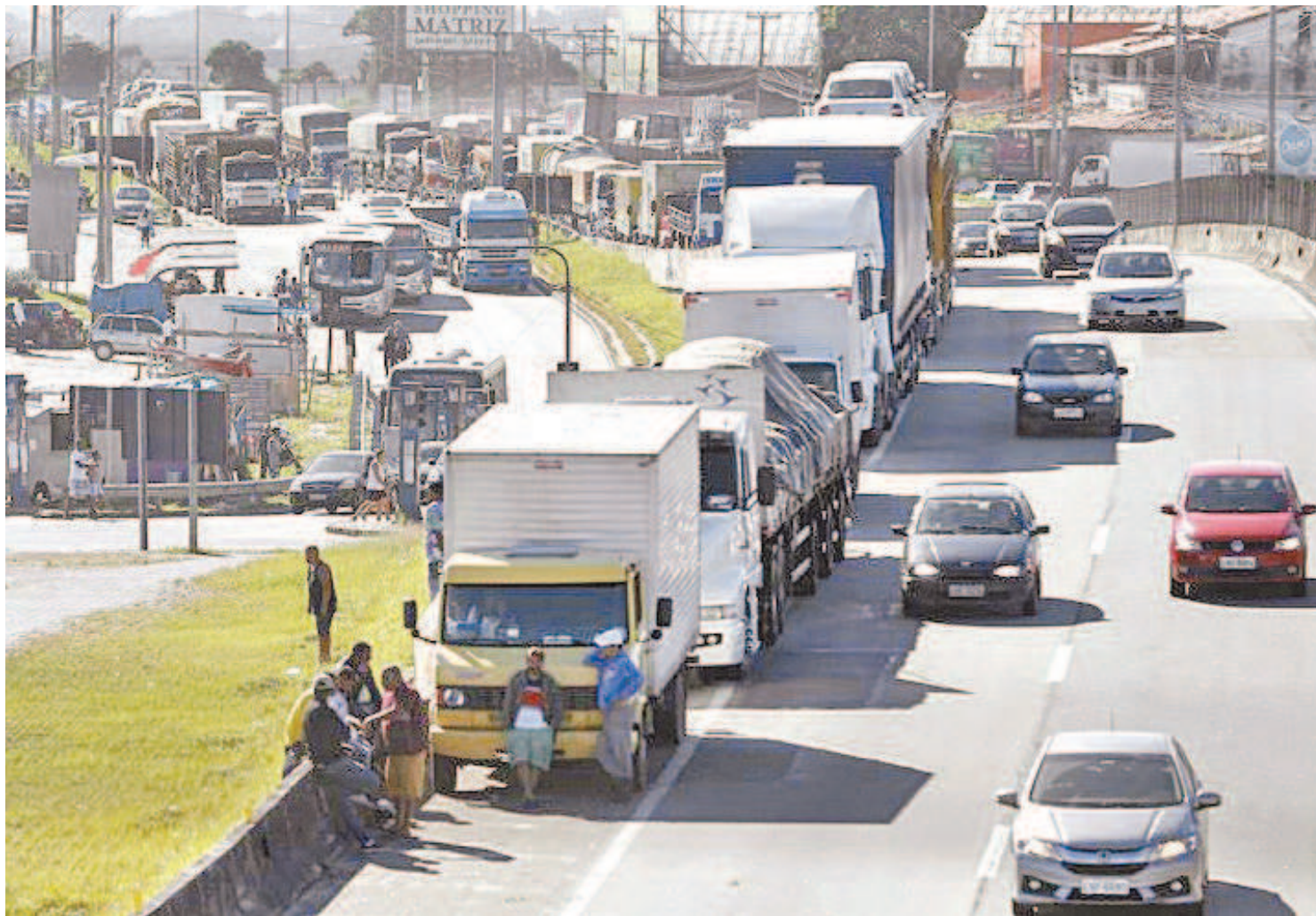
Caminhoneiros pressionam o governo por causa do aumento do preço do diesel: categoria chegou a articular greve já neste início de ano

A necessidade de redução no preço do combustível sur-