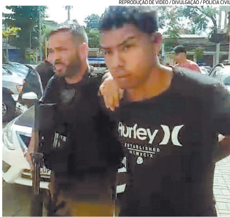
Depoimentos foram marcados pelo não-arrependimento