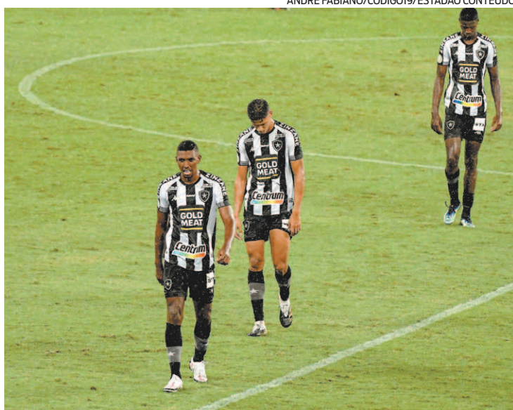
Jogadores do Botafogo deixam o campo cabisbaixos, no Nilton Santos

Seja pela má gestão da antiga diretoria, pelo fracasso em contratações como Honda e Kalou e o troca-troca no comando técnico. Eduardo