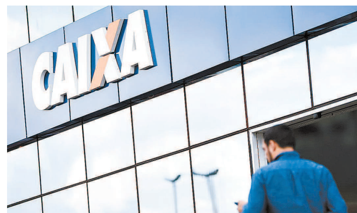
Caixa diz que conta digital leva segurança e autonomia ao cidadão