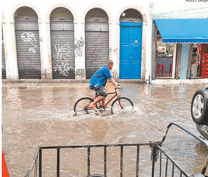
Rua Barão de São Félix, no Centro, alagada após chuva forte no Rio

De acordo com o Centro de Operações Rio, houve registro de chuva muito forte na Estrada da Grota Funda, Zona Oeste do Rio, entre 17h e 17h15. O local foi interditado porque o acumulado de chuva na região foi de 62 mm em um hora. O protocolo para fechamento desta via