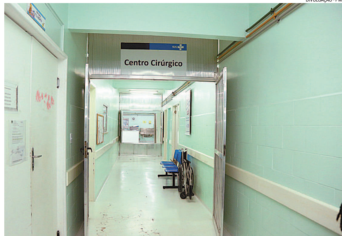
Apesar da covid-19, São Francisco Xavier quer zerar a fila de pessoas para procedimentos ortopédicos