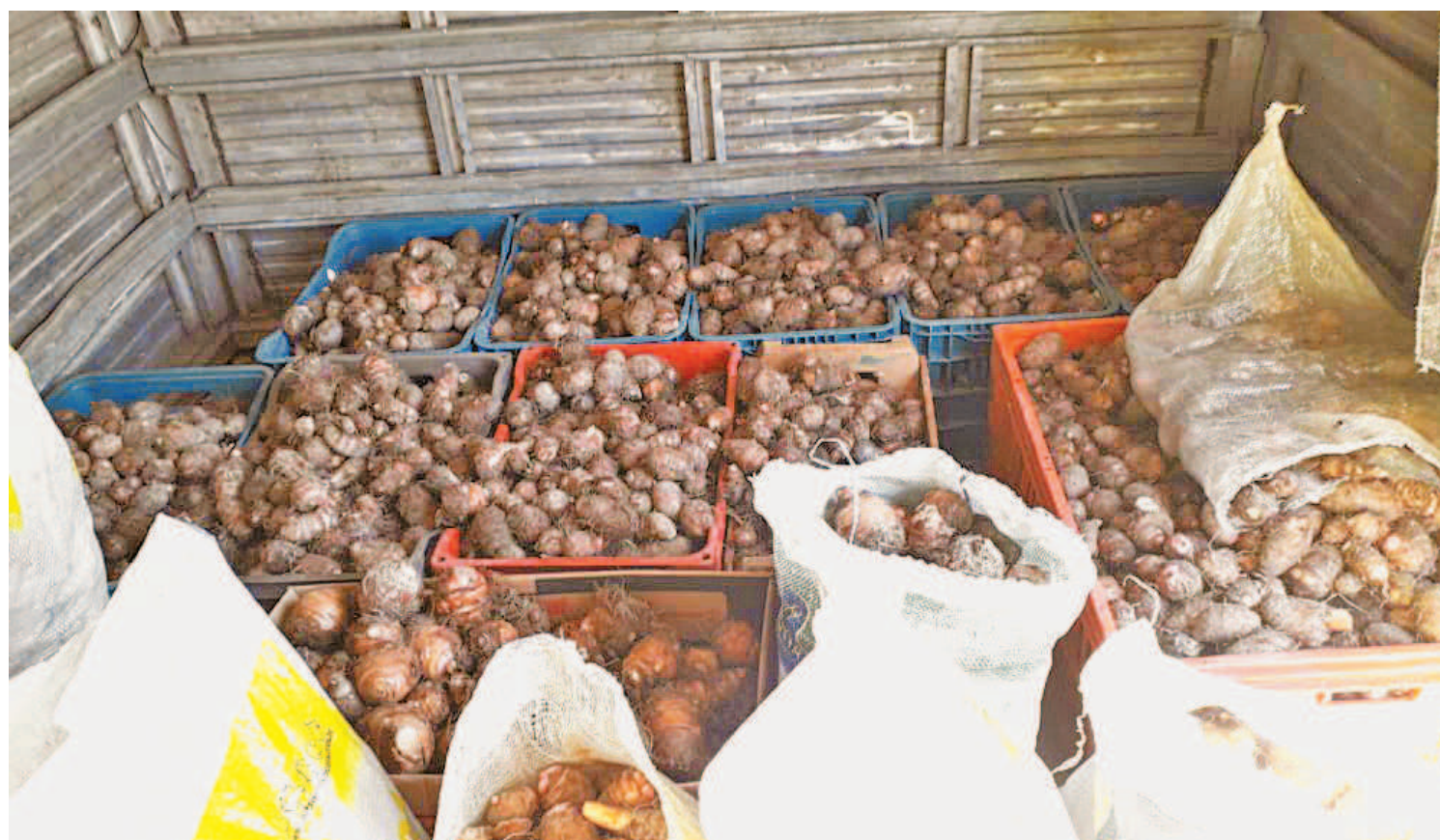
Inhames serão usados no preparo de refeições aos pacientes do Hospital de Magé e das quatro Unidades Mistas 24h da rede pública municipal