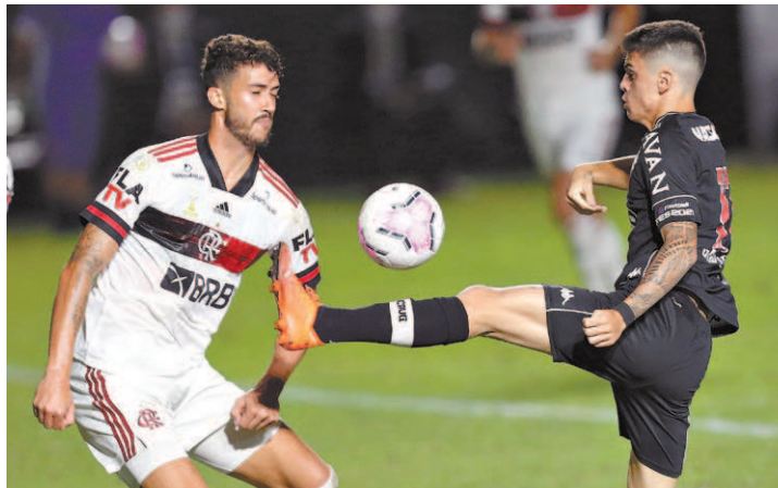
Clássico de hoje é decisivo para Flamengo e Vasco no Brasileirão