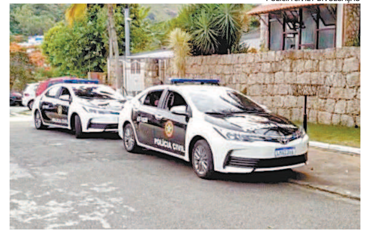
Operação 'Zero Ponto' cumpriu mandados e prendeu seis pessoas