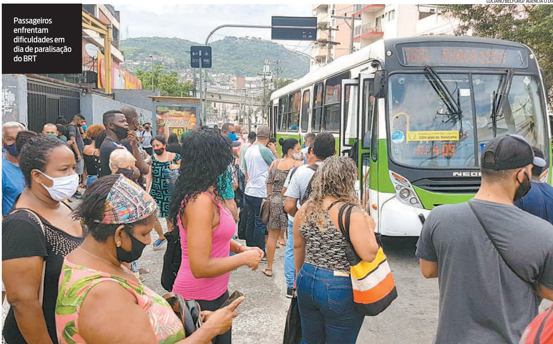
Passageiros enfrentam dificuldades em dia de paralisação do BRT