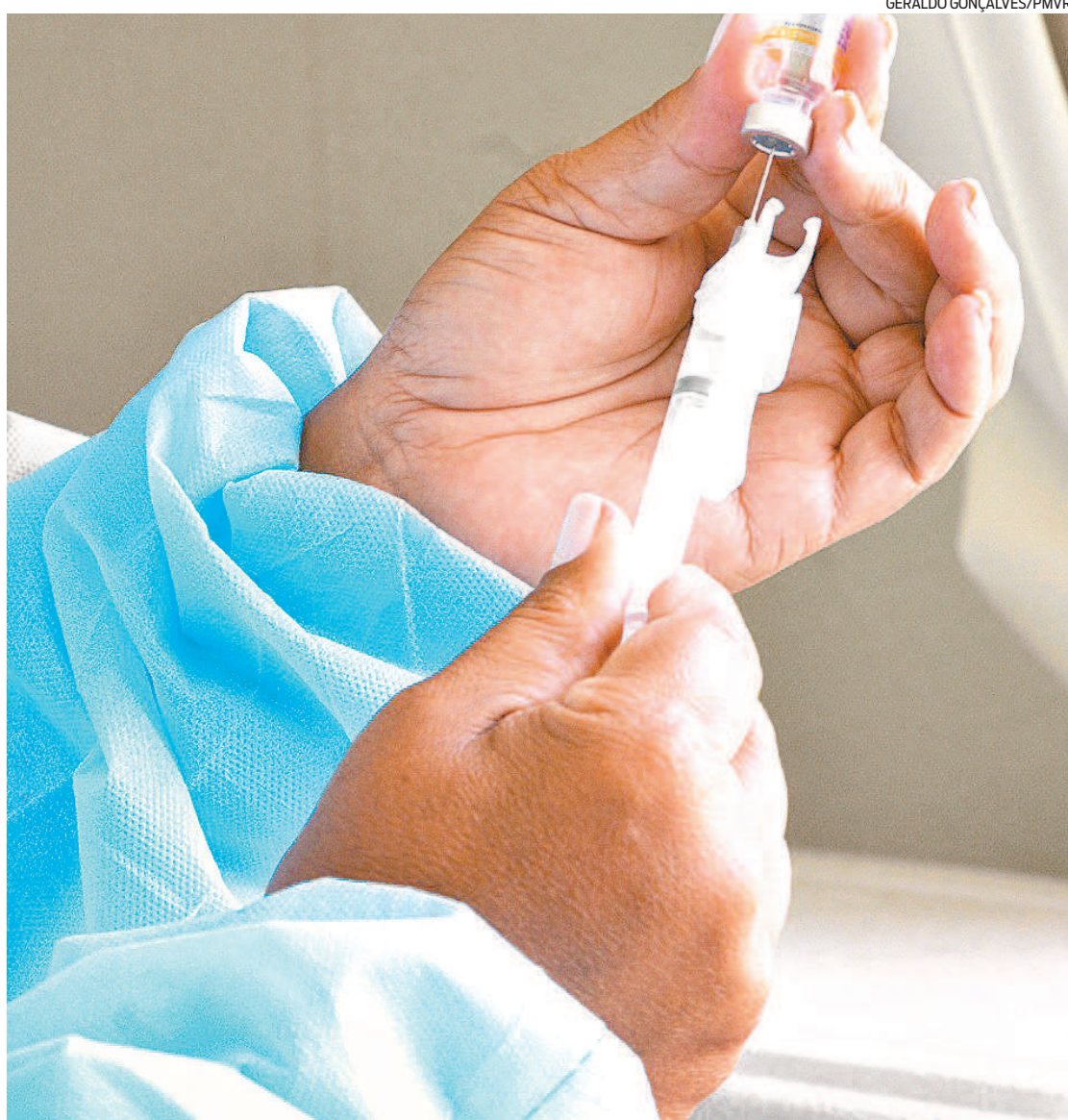
Zycov-D pode ser a primeira baseada em DNA no mercado. Ela independe do armazenamento em freezers

O laboratório informou que este tipo de vacina permite atualização mais frequente, conforme cepas de vírus em circulação. O laboratório planeja realizar atualizações mensais.