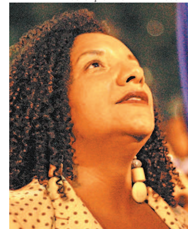
Deputada Renata Souza