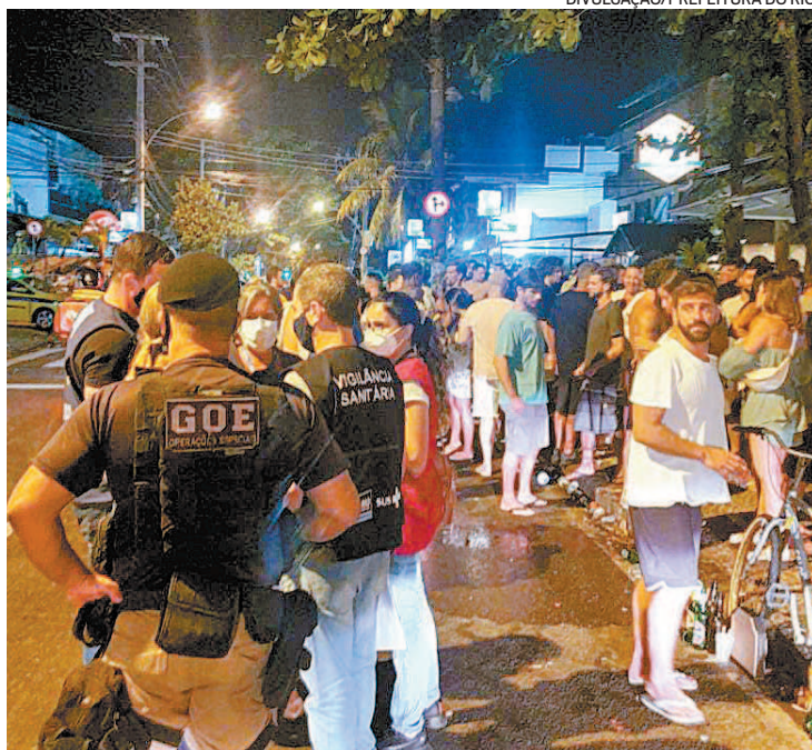
Prefeitura do Rio fechou uma boate na Praça Mauá no domingo à noite

No domingo, as equipes fiscalizaram ainda quiosques, bares, restaurantes, ambulantes e barraqueiros de Copacabana, Leme, Ipanema, Barra da Tijuca, Recreio dos Bandeirantes, Jacarepaguá,