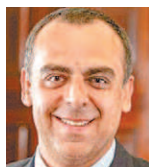
Anderson Moraes deputado estadual pelo PSL do Rio

Audácia das organizações criminosas que saquearam os cofres públicos durante a pandemia da covid-19, à custa de milhares de vidas, ultrapassou todos os limites, tendo como uma de suas principais aliadas a falta de transparência. Logo no início da fiscalização dos contratos emergenciais em virtude da pandemia, no final do mês de março de 2020, nos deparamos com um nefasto sigilo imposto pelo Poder Executivo ao processo de contratação da Organização Social IABAS, no Sistema Eletrônico de Processo (SEI), que somente foi quebrado após ingressarmos com uma ação no plantão judiciário pedindo a publicidade aos documentos.