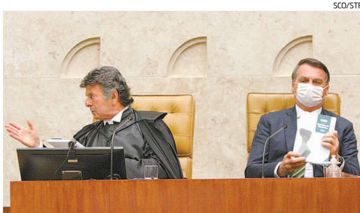
Ao lado de Bolsonaro, Luiz Fux abriu os trabalhos do Judiciário

"Não tenho dúvidas de que a ciência, que agora conta com a tão almejada vacina, vencerá o vírus; a prudência vencerá a perturbação; e a racionalidade vencerá o obscurantismo. Para tanto, não devemos dar ouvidos às vozes isoladas, algumas inclusive no âmbito do Poder Judiciário, confesso que fiquei estupefocado com a manifestação de um presidente de um tribunal de justiça menosprezando esse flagelo que abusam da liberdade de expressão para propagar ódio, desprezo às vítimas e negacionismo científico. É tempo valorizarmos as vozes pondera-