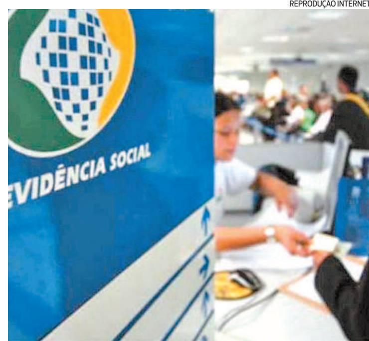
Para quem está dentro dos critérios, o aumento é de 5,45%

este ano. Para quem recebe acima de um salário mínimo, o aumento é de 5,45%. Confira abaixo o calendário de pagamentos do INSS de acordo com o final do benefício excluindo o dígito.