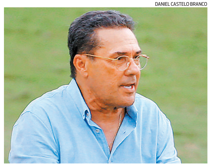
Treinador do Vasco, Vanderlei Luxemburgo ficou na bronca