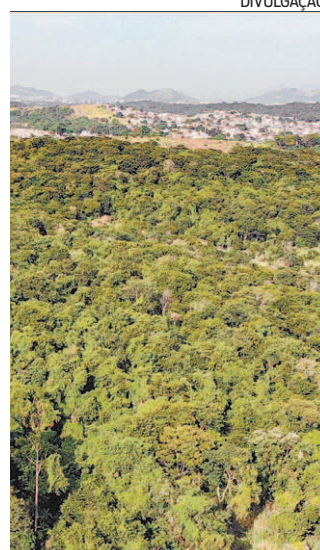
Mata Atlântica preservada

Com 160 hectares (dos quais 108 estão em bom estado de preservação), Camboatá faz alusão à suave elevação de terreno que ali existe, o Morro