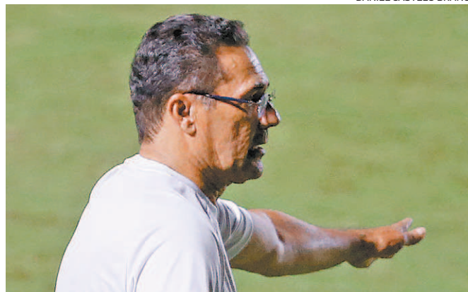
Vanderlei Luxemburgo promove a união do grupo vascaíno