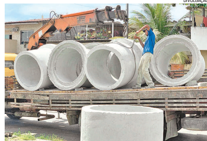
Ao todo, segundo secretário de Obras, serão 300 manilhas