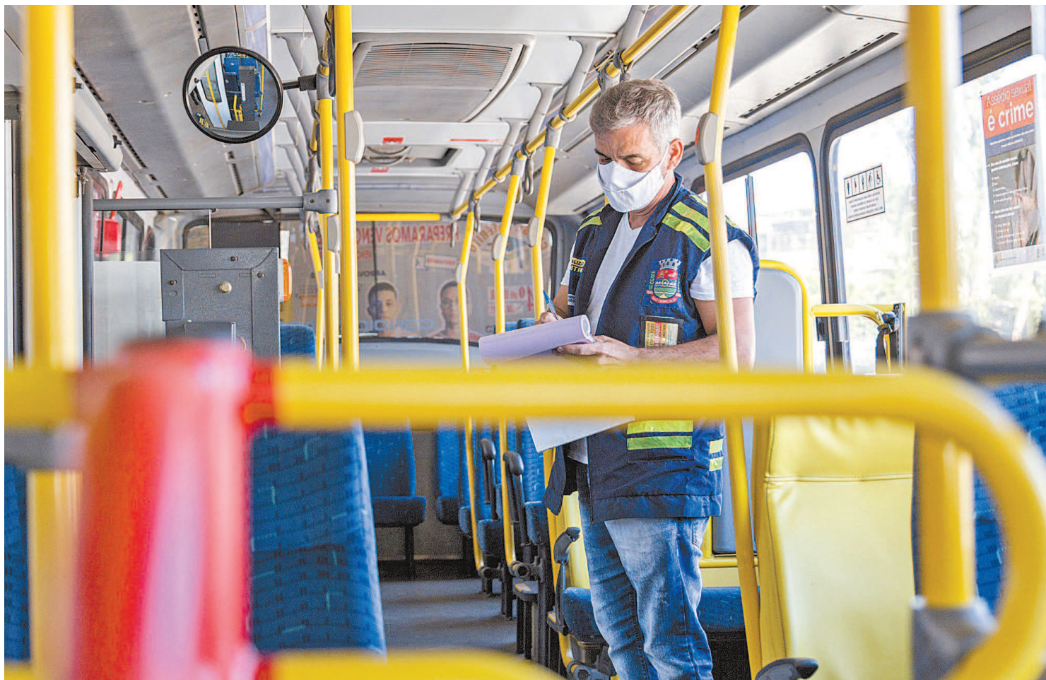
Motoristas ficam expostos por muito tempo à contaminação pelo coronavírus, pois transportam passageiros que podem estar com a doença

Em outra ação, o Sintronac pediu ao Ministério Público intensa fiscalização nos locais onde as vacinas estão sendo aplicadas e estocadas nos municípios. A medida visa impedir que pessoas usem de influência política para receber a imunização, em detrimento dos grupos prioritários. Desde março de 2020, pelo menos dois mil rodoviários, nos 13 municípios da área de atuação do sindicato, entraram em quarente-