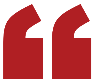
Imagem é a forma como as pessoas te enxergam, a mensagem que você transmite ao mundo”

Desde a história de Narciso, da Mitologia Grega, até os nossos dias, a visão mais importante sobre si, talvez seja a da própria auto imagem. A imagem pessoal é a visão