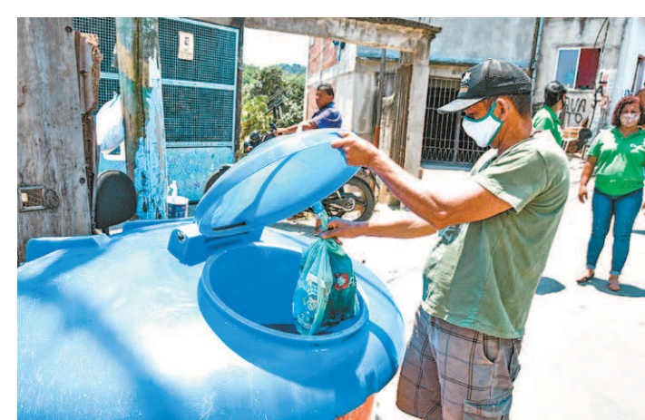
Contêiner semienterrado, sinônimo de limpeza e saúde

Além da cobrança mensal do DAS, o microempreendedor individual também deve entregar a Declaração Anual de Faturamento do Simples Nacional (DASN-Simei) até 31 de maio. A Secretaria de Desenvolvimento Econômico de São Gonçalo fica na Rua Cel. Moreira César, no Centro, e funciona de segunda a sexta-feira, das 10h às 16h. O telefone para outras informações é 2199-6308.