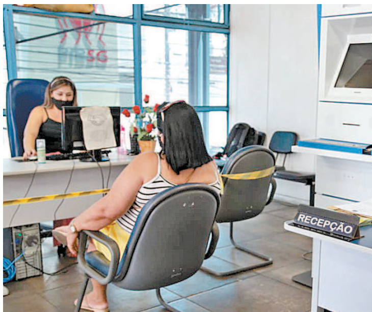
Trabalhador autônomo têm série de vantagens ao se cadastrar no MEI

“Muitos trabalhadores, quando pensam no MEI, não analisam o contexto completo. A preocupação inicial é apenas com o custo mensal e como fazer o negócio girar. Contudo, o que muitas pessoas não sabem é que aqui, na Casa do Empreendedor, damos todo o suporte para que o profissional entenda todos os seus benefícios. O valor pago mensalmente está longe de ser um gasto, e sim um investimento em direitos trabalhistas”, explicou o secretário.