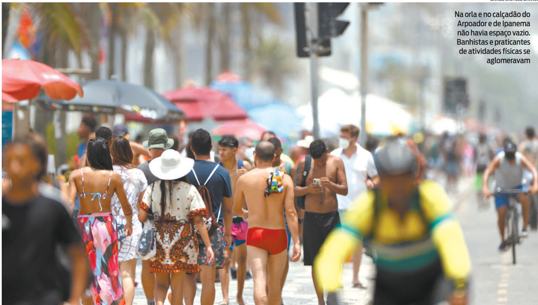
Na orla e no calçadão do Arpoador e de Ipanema não havia espaço vazio. Banhistas e praticantes de atividades físicas se aglomeravam