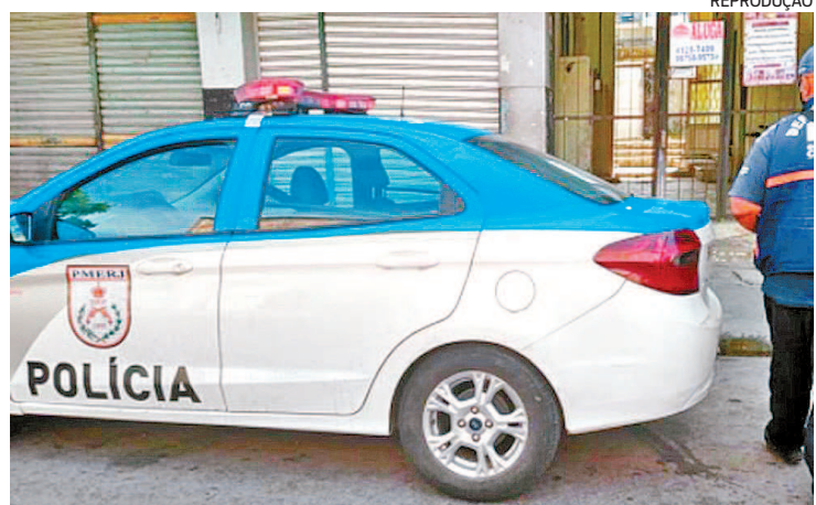
Havia uma criança no local durante os tiros, mas ela conseguiu fugir

A PM informou que o esquadrão antibombas foi acionado e a ocorrência encaminhada para a Delegacia de Homicídios da Baixada Fluminense (DHBFF).