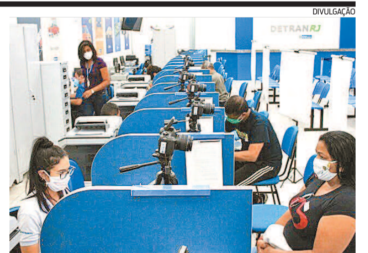
Postos funcionarão de segunda a sexta-feira, das 8h às 17h

Cedae informou que adotou medidas para eliminar qualquer possibilidade de alteração de gosto e cheiro da água produzida na ETA Guandu e distribuída à Região Metropolitana. Com relação aos dados da semana passada sobre a análise de geosmina, conforme divulgado, "o resultado do laboratório contratado está previsto para ser divulgado nesta semana".