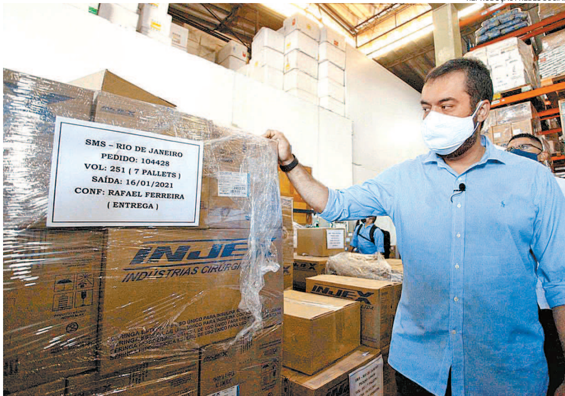
Governador em exercício do Rio, Cláudio Castro: foco inicial é na campanha de vacinação contra a covid

Estão no pacote nova rodada de revisão de benefícios fiscais, reformulação da máquina pública, com desestatizações e fusão de algumas fundações (a chamada reforma administrativa), além de mudanças nas regras previdenciárias, com aumento da idade mínima e tempo de contribuição, além da nova fórmula de cálculo para a aposentadoria.