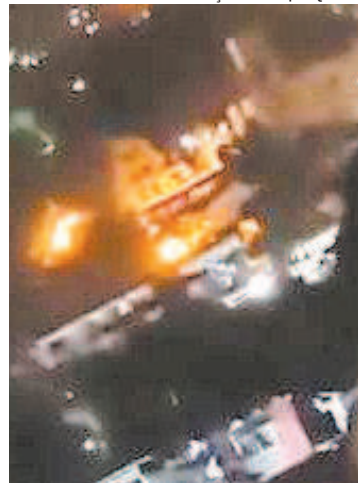
Troca de tiros em dois dias