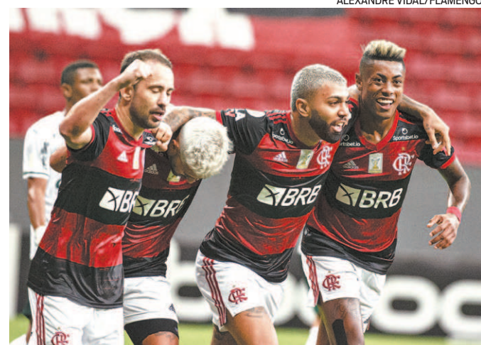
O Flamengo venceu o Palmeiras, na quinta-feira, em Brasília