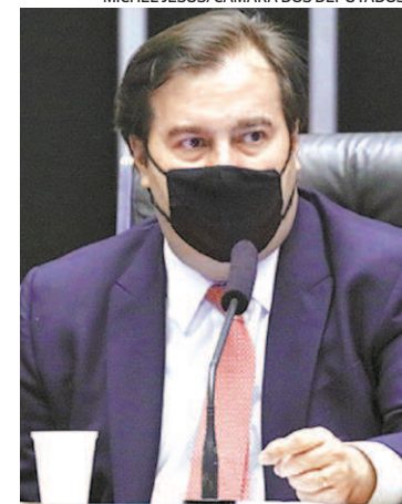
Rodrigo Maia (DEM-RJ)