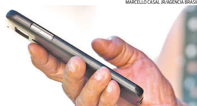
Restituição pode ser solicitada através do aplicativo

Reportagem da estagiária Maria Clara Matturo , sob supervisão de Marina Cardoso