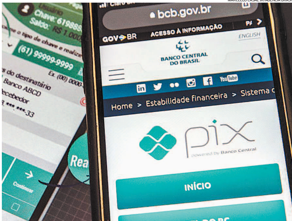
Sobre a brincadeira, o Banco Central reforçou que “o Pix é um meio de pagamento, não uma rede social”

“Meu primo terminou com a namorada porque ela traiu ele, aí ele bloqueou em tudo. Pra conseguir falar com ele, ela começou a mandar vários Pix de 1 cen-