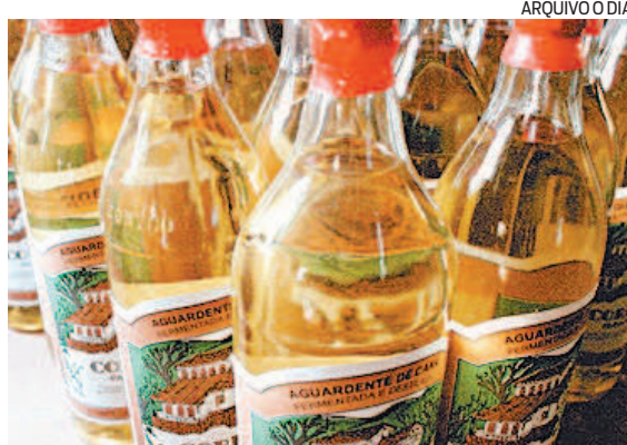
'Filosofia de bar' que virou um samba carioca

Agora, os indianos. Para começar, um bem curtinho: "Muitas vezes, o silêncio é a melhor resposta". Outro, também pequeno mas sempre atual: "As palavras cortam mais que as espadas". Outro, oportuno: "O ladrão conhece um ladrão, assim como o lobo conhece outro lobo". Mais um: "Os vasos que não se enchem de água, cedo transbordam de pó". O último: "Não impor-