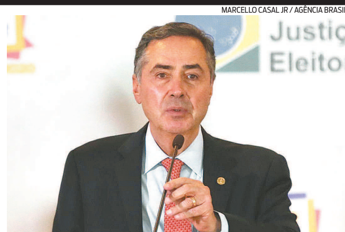
Presidente do TSE, Luís Roberto Barroso assinou resolução