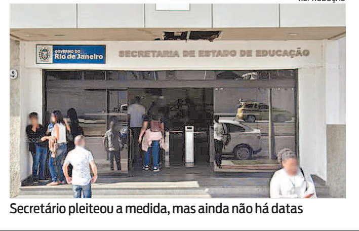
Secretário pleiteou a medida, mas ainda não há datas