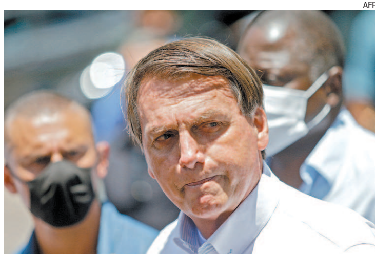
Bolsonaro: pesquisa sobre o seu governo foi feita entre os dias 18 e 21

A pesquisa exclusiva EXAME/IDEIA, desenvolvida pelo projeto Exame Research da revista de negócios em parceria com o instituto IDEIA — especialista em opinião pública — constatou a maior queda semanal nos níveis de aprovação do governo do presidente Jair Bolsonaro (sem partido) desde ele que assumiu a presidência. A avaliação positiva da gestão