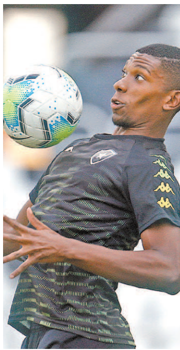
Kanu, de 23 anos, está de partida

Eduardo Freeland é o novo diretor de futebol do Botafogo. Ele está de volta ao clube carioca após três anos. Na sua passagem anterior, o dirigente sagrou-se campeão brasileiro na categoria sub-20 em 2016, entre outros títulos na base alvinegra. Atualmente, ele atuava na função de gerente de futebol de base do Flamengo.