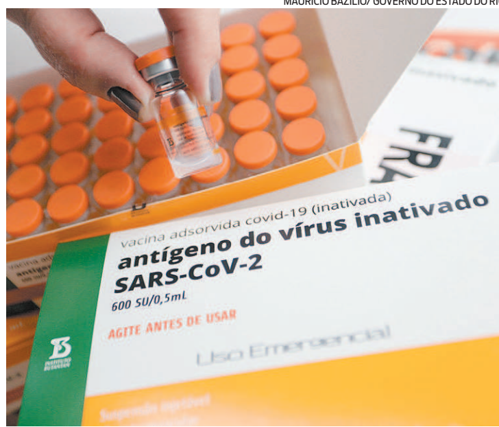
Os 5% propostos representam cerca de 300 mil vacinas para o AM

O recebimento de imunizantes extras pelo Amazonas foi proposto diante do colapso de saúde e da falta de oxigênio registrados na capital amaz-