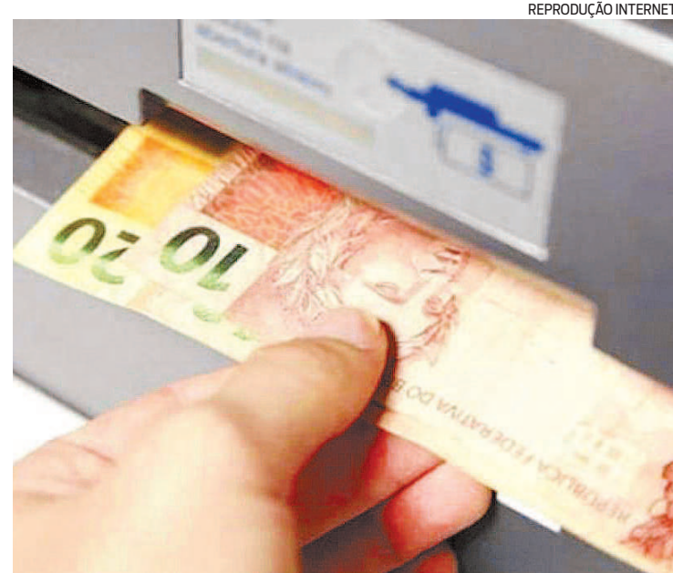
Dinheiro do auxílio da lei Aldir Blanc, contam artistas, caiu quarta-feira

Depois de atraso, benefício começou a ser creditado pela prefeitura nas contas cadastradas e beneficiários confirmam pagamento