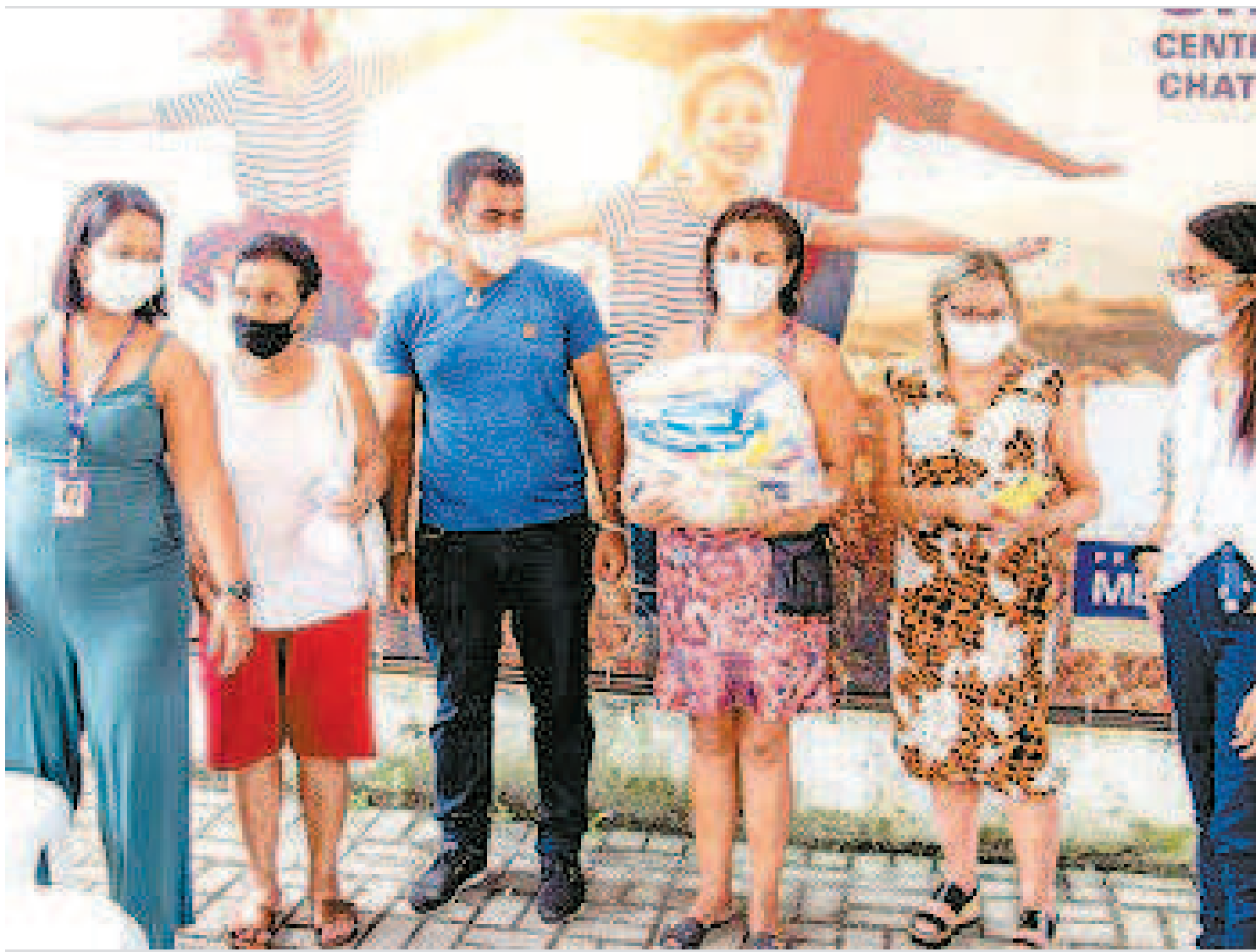
Equipe distribui cesta básica para deficiente visual e às famílias cadastradas pelo CRAS e pelo CREAS