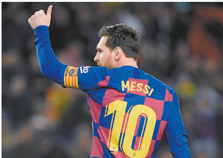
Lionel Messi foi expulso na final da Supercopa da Espanha