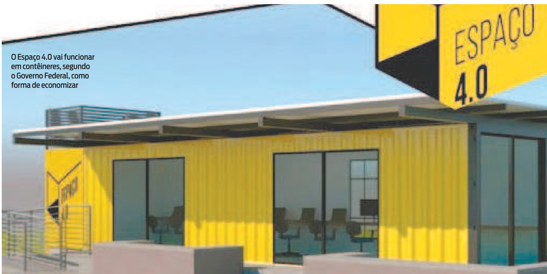
O Espaço 4.0 vai funcionar em contêineres, segundo o Governo Federal, como forma de economizar

Além dos recursos do Governo Federal, as unidades contam com o investimento de contrapartida de estados e municípios. Cerca R$ 162 mil serão destinados por essas unidades da federação