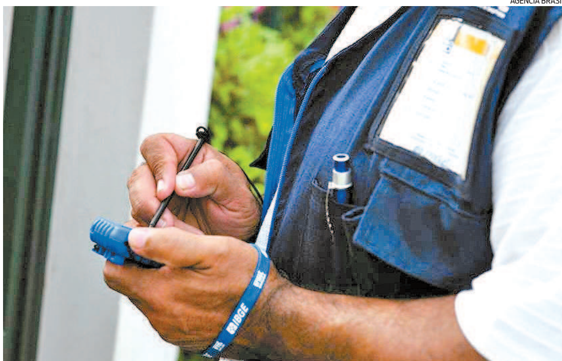
Haverá vagas de recenseador, agente censitário e agente censitário supervisor no concurso do IBGE

O especialista reforça, ainda, que a pandemia pode fazer com que o Brasil repense a forma de promover concursos. “Talvez sinalize para o Brasil a necessidade de rever como se faz concurso, será que só pode ser realizado com a aglomeração de milhares de pessoas em uma escola preenchendo um pa-