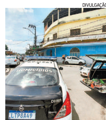
DH da Baixada Fluminense

A busca pelo paradeiro das três crianças que desapareceram em Belford Roxo, na Baixada Fluminense, repercutiu em grupos de WhatsApp e nas redes sociais, ganhando grande proporção. Ontem, policiais do núcleo de Descoberta e Paradeiro da Delegacia de Homicídios da Baixada Fluminense (DHBF) realizaram uma operação na Feira de Areia Branca, em Belford Roxo, Baixada Fluminense, na tentativa de localizar testemunhas que tenham visto as três os meninos. No entanto, os agentes não encontraram ninguém