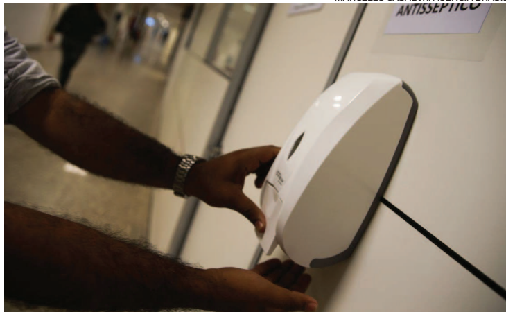
Vestibular começou neste domingo, com mais de 3,5 mil inscritos

Não foram registradas cenas de “formigueiro” como nos anos anteriores. O uso obriga-