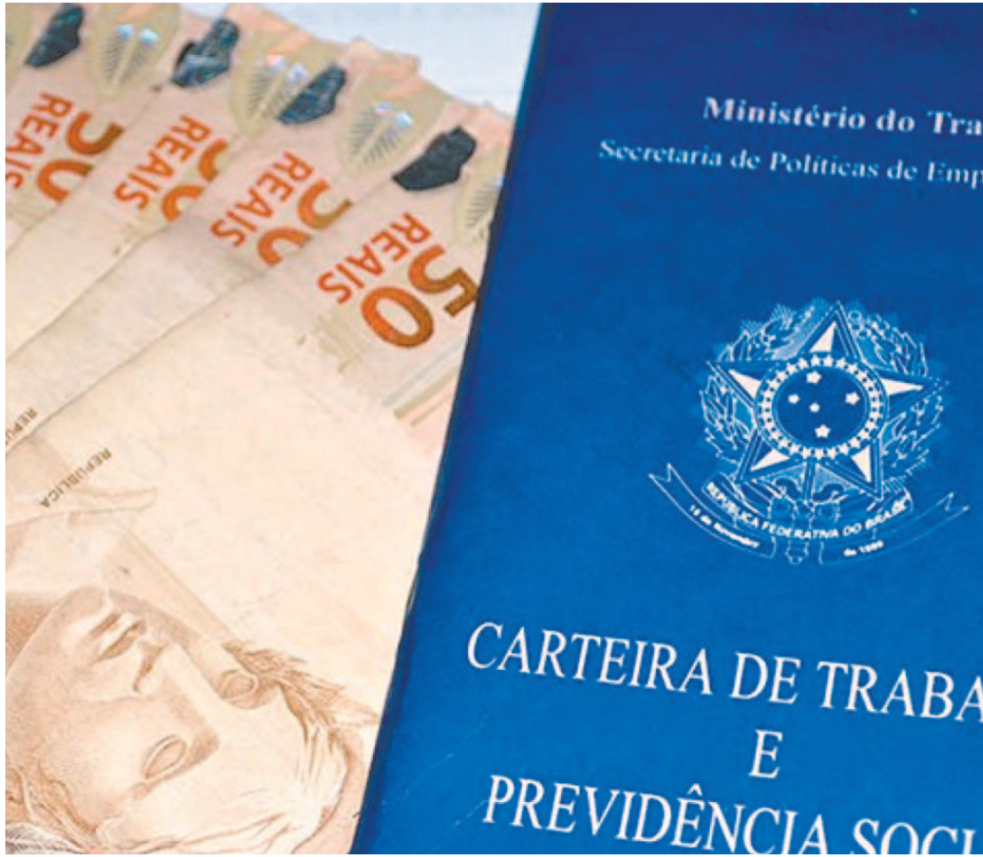
Especialistas avaliam que o 1º semestre será difícil. O fim do auxílio emergencial terá impacto em janeiro