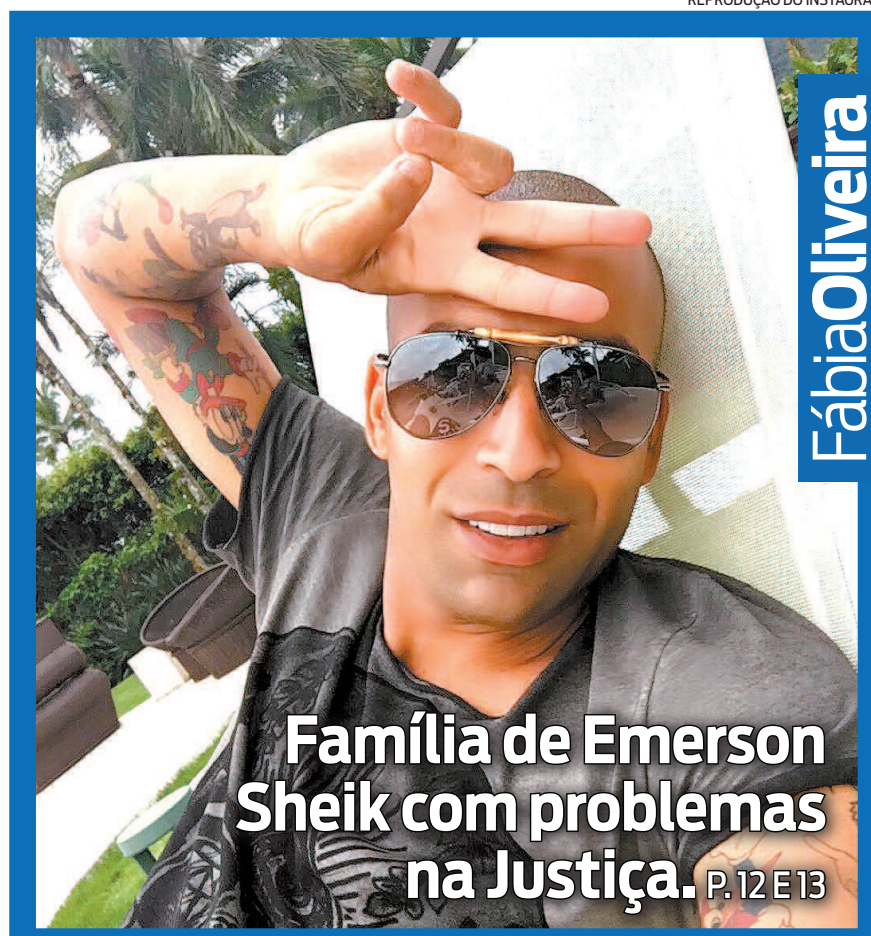
REPRODUÇÃO DO INSTAGRAM

A Prefeitura do Rio recebeu ontem 10 mil testes para a covid. As primeiras vacinas devem chegar nesta semana. Especialistas dizem que aprovação da Coronavac está próxima. P. 3 E 4