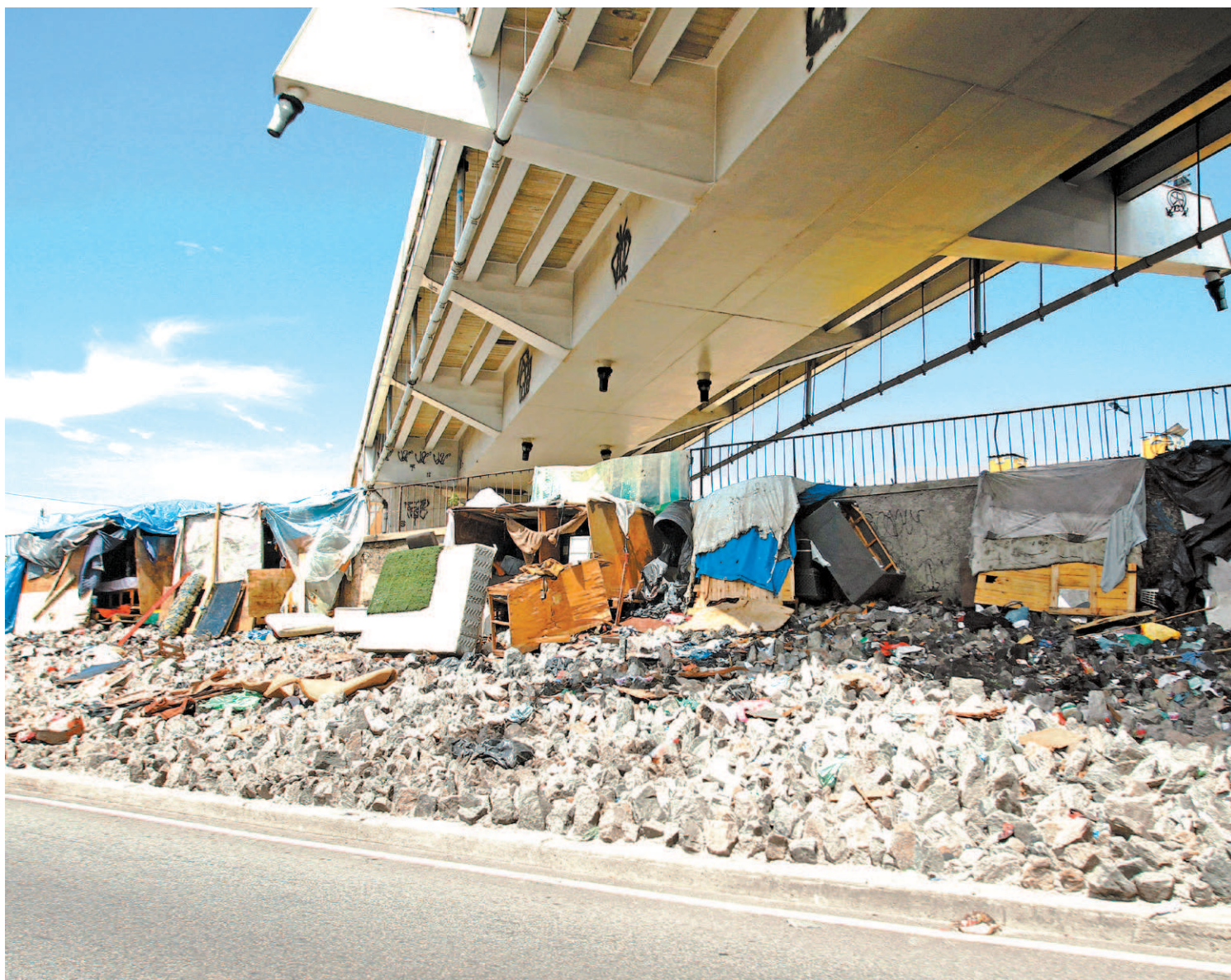
Abrigo de usuários de crack em calçadas e sob viadutos: um dos problemas sociais e urbanos do Rio

A Prefeitura do Rio foi procurada e questionada sobre um plano de fiscalização e combate à desordem urbana na cidade. Em nota, a atual gestão municipal disse que “a nova gestão da Prefeitura do Rio informa que está realizando levantamento e mapeando esse tipo de ocorrência em toda a cidade, a fim de coibir tais práticas com a maior brevidade possível”.