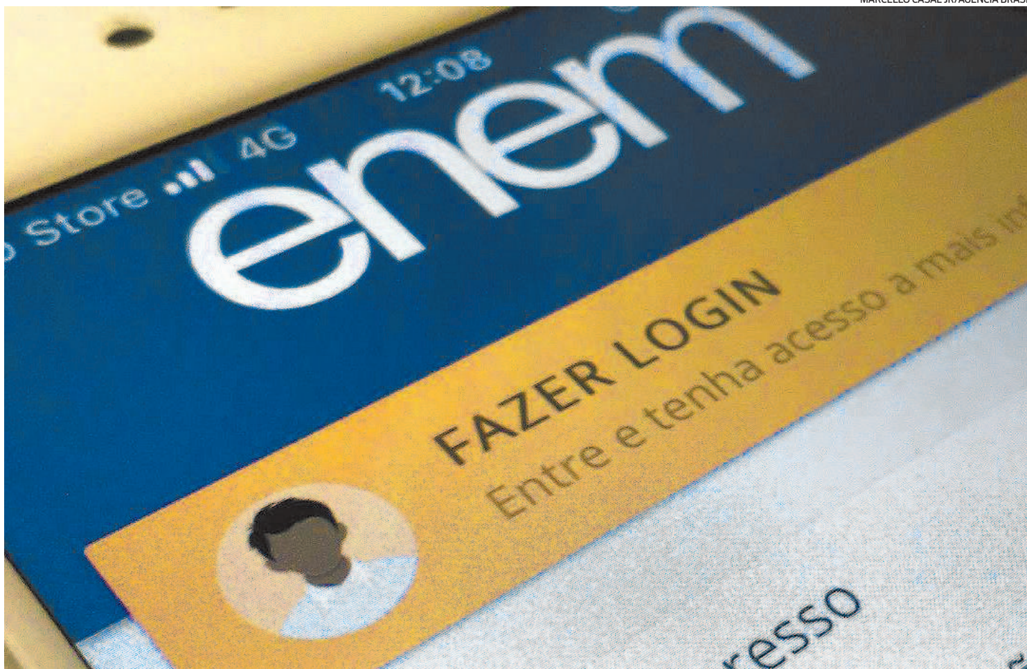
Entidades alegam que não há maneira segura de se realizar um exame para mais de seis milhões de estudantes durante o pico da covid-19