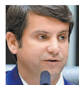
Dr. Luizinho dep. fed. (PP-RJ), pres. Com. Esp. Coronavírus

Felizmente o governo se convenceu e incorporou na MP 1.026, que já está sendo chamada de MP da Vacinação, o que já estava previsto na Lei da Vacina (14.006/20), de minha autoria. A partir de agora, não será mais necessário aguardar o aval da Anvisa para importar vacinas que já estão aprovadas e sendo utilizadas no exterior.