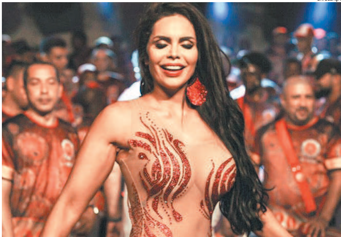
A beleza ficou na escola sete anos e chegou a ser eleita uma espécie de amuleto da sorte da Viradouro

“É uma despedida difícil, porque separa dois corações que se amam e que agora estarão distantes. Mas aprendi que quando a saudade fica é sinal de que tudo o que foi vivido não será inesquecível. E muito mais do que apenas dizer