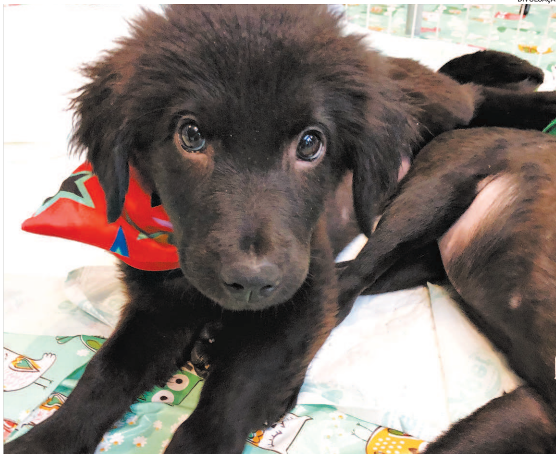
Animais resgatados por organizações que atuam no setor poderão ser adotados durante a feira