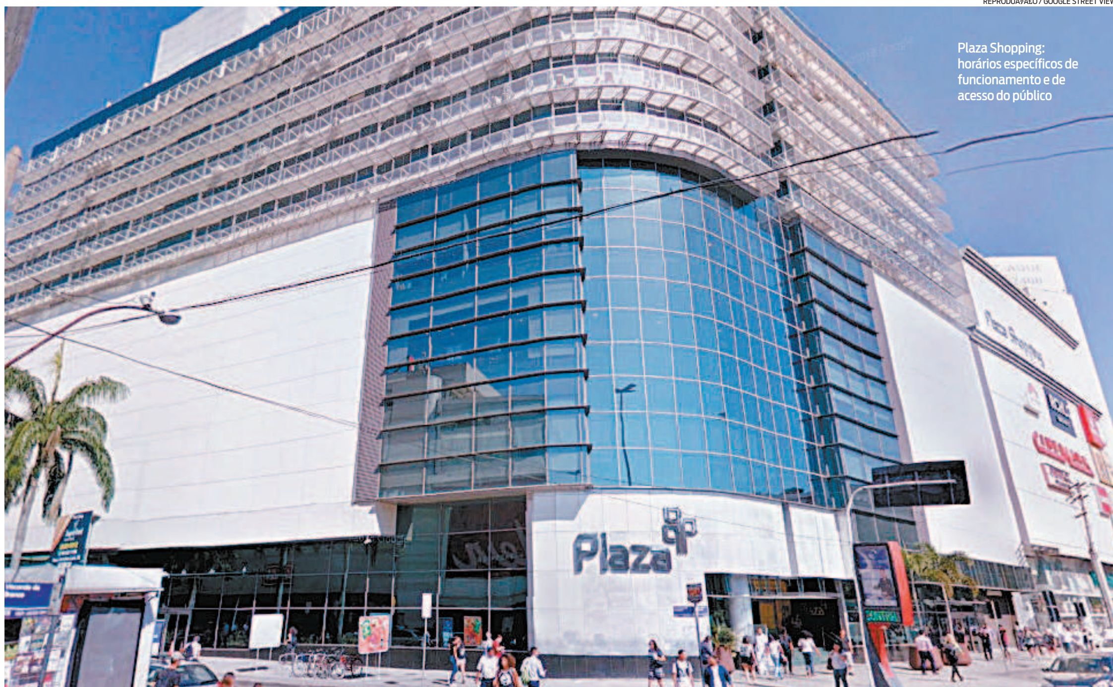
Plaza Shopping: horários específicos de funcionamento e de acesso do público