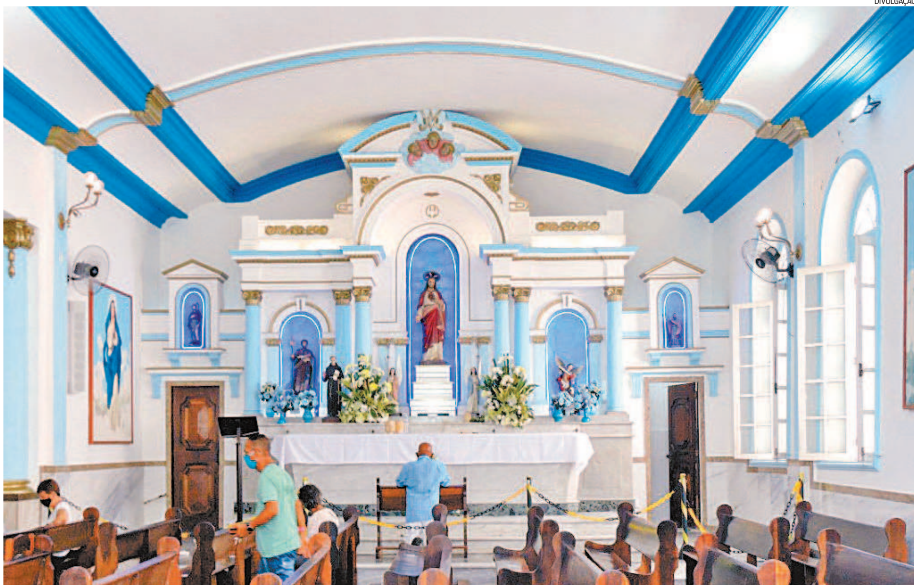
A Capela Nossa Senhora da Conceição de Niterói tem uma rica história ao longo de 350 anos e o lançamento do aplicativo é um marco para ampliar a sua divulgação