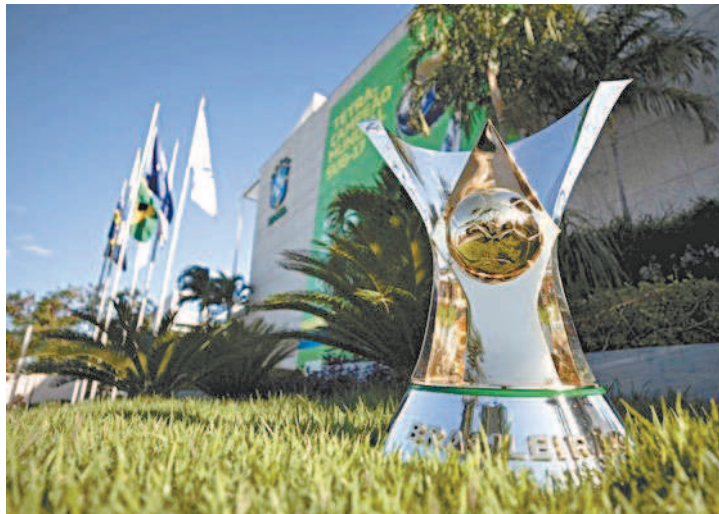
Campeonato Brasileiro da Série A já teve 21 clássicos