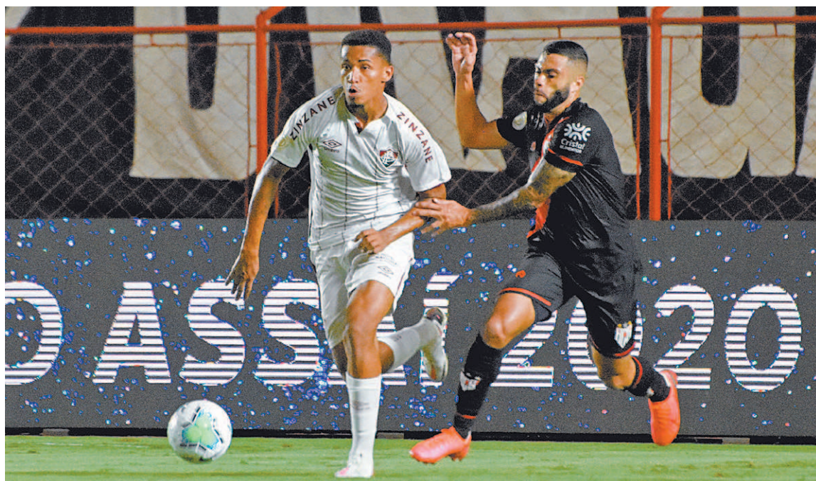
O Fluminense até teve mais posse de bola, mas foi pouco produtivo na criação de jogadas ofensivas