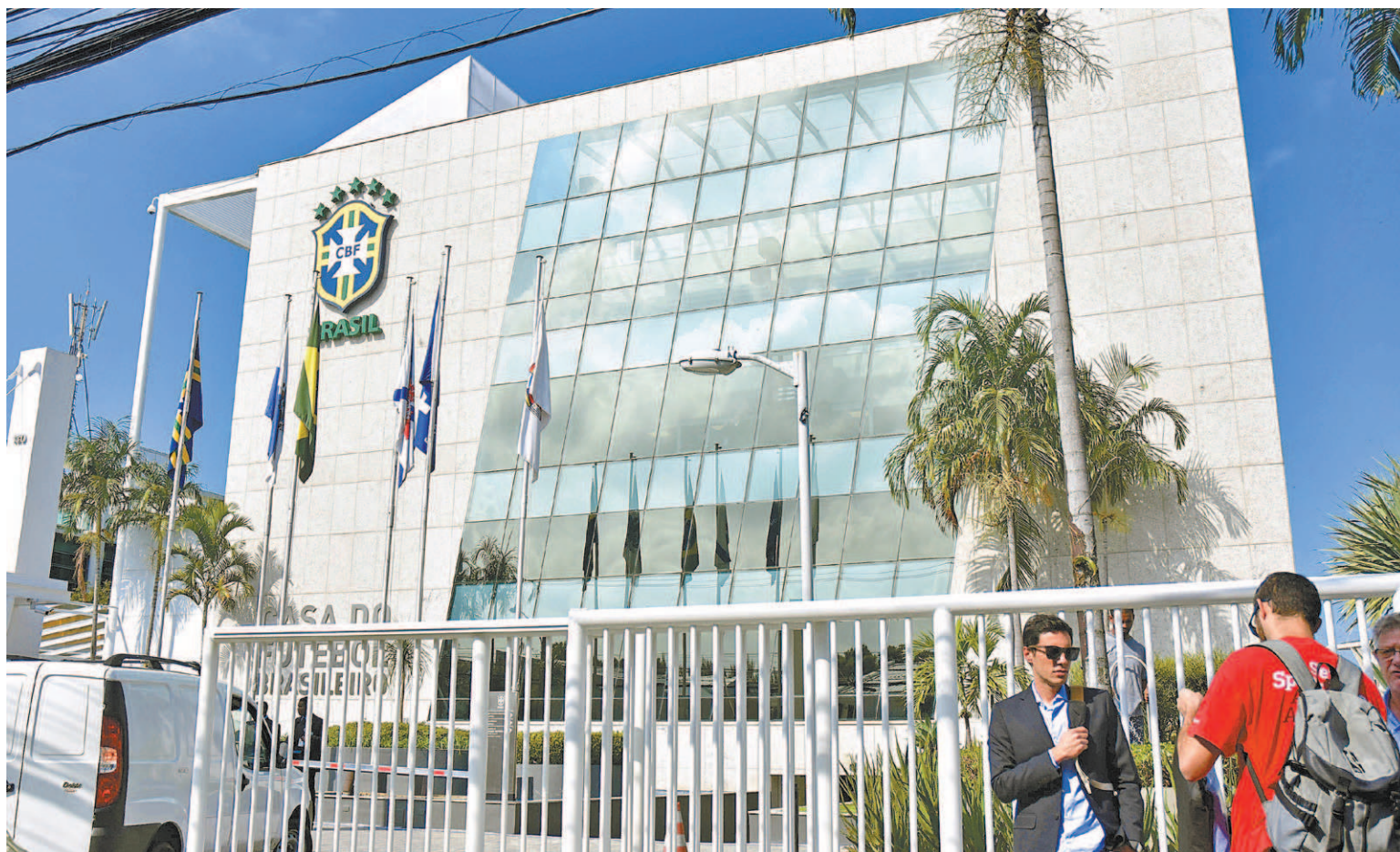
Sede da CBF foi o palco para as discussões com membros da CUFA sobre o combate ao racismo que escraviza o futebol brasileiro na atualidade