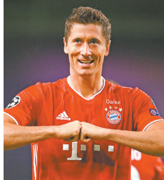
Lewandowski é favorito