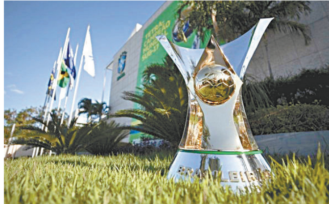
Campeonato Brasileiro da Série A já teve 21 clássicos