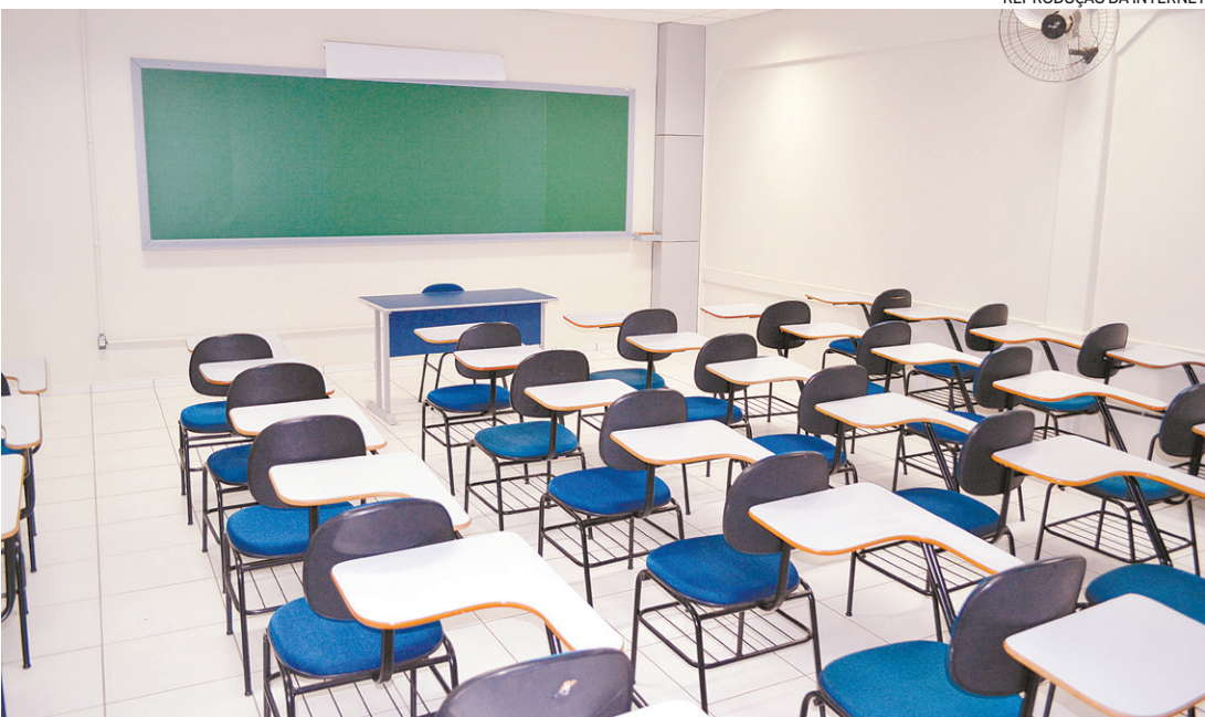
Antes do retorno, os professores terão acesso a cursos on-line de capacitação, com carga de 110 horas

No primeiro bimestre letivo, a proposta da Seeduc será desenvolver competências e habilidades do currículo essencial, dando continuidade aos estudos de 2020. De acordo com a pasta, a ideia é trabalhar os anos de 2020 e 2021 como um continuum (contínuo) escolar, de maneira que os conteúdos de 2020 sejam ensinados em 2021, conforme recomendação