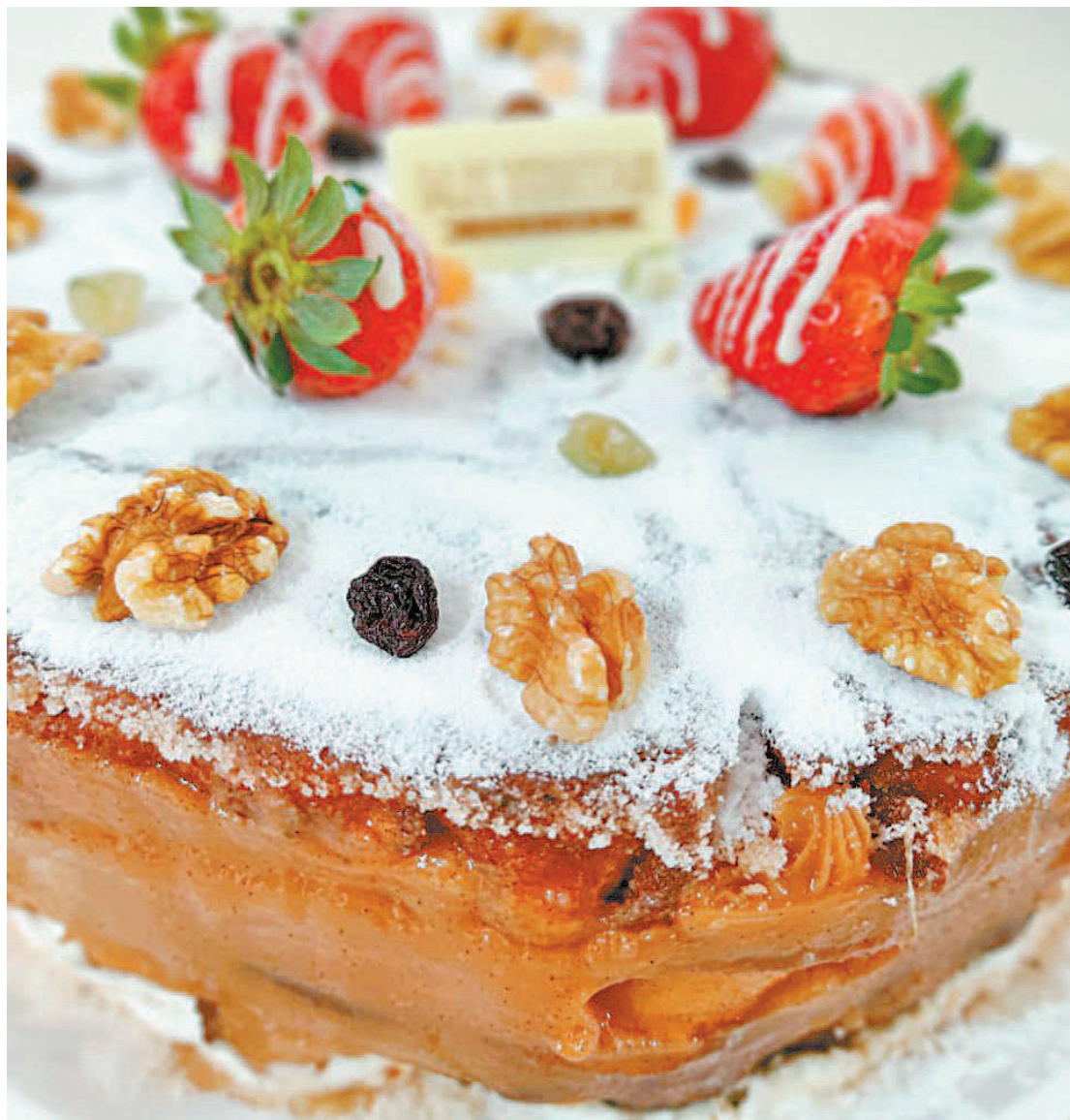
A torta de rabanada é recheada com creme de confeiteiro e doce de leite, com a decoração a gosto do cliente

A receita da torta é guardada a sete chaves, mas o toque especial é o equilíbrio do recheio com doce de leite fresco para não deixar o sabor enjoativo. A delícia já começou a ser comercializada e as encomendas para as festas de fim de ano estão bombando. A equipe da confeitaria está com trabalho reforçado para atender a demanda da novidade nas duas lojas da marca, no Parque Fluminense e na Vila São Luís, ambas no município de Duque de Caxias. Quem provou, está apaixonado!