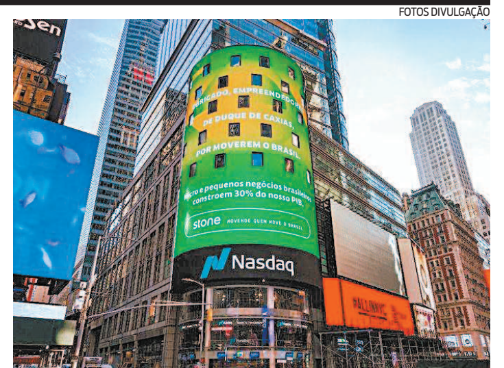
Nome da cidade foi estampado em um dos prédios, em Nova York

Mais informações podem ser obtidas no Instagram da confeitaria: @mktortas.