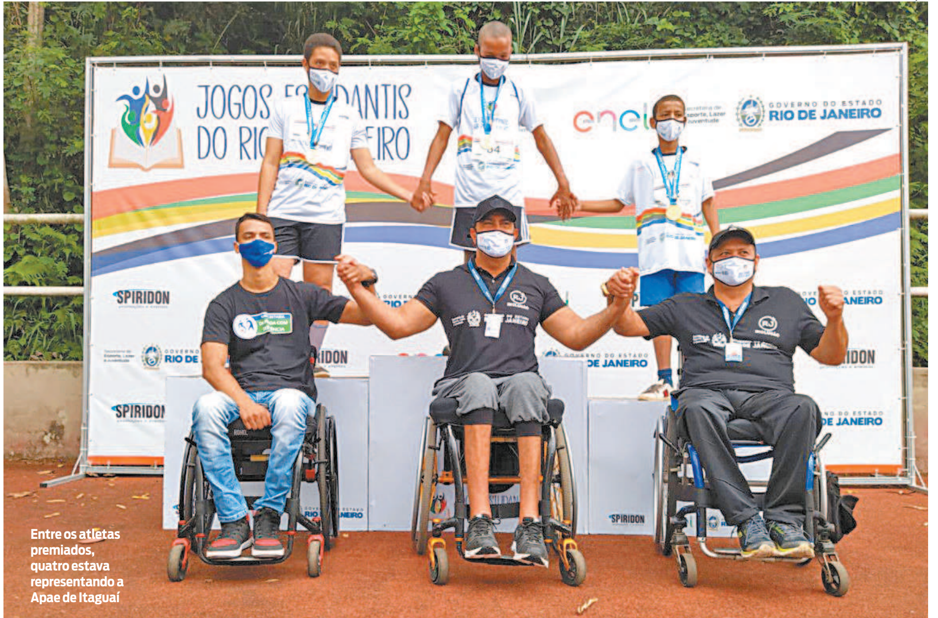
Entre os atletas premiados, quatro estava representando a Apae de Itaguaí