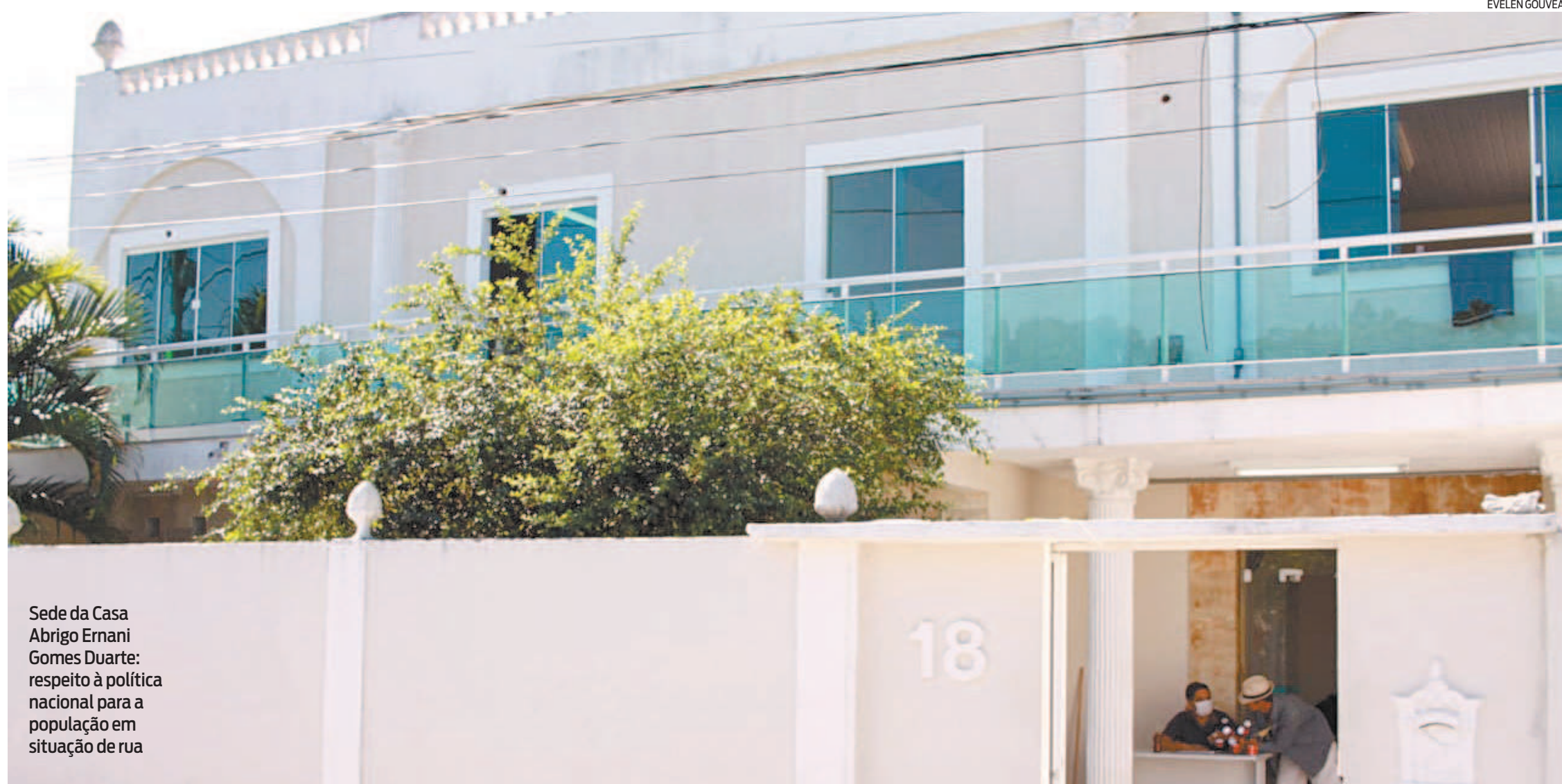
Sede da Casa Abrigo Ernani Gomes Duarte: respeito à política nacional para a população em situação de rua