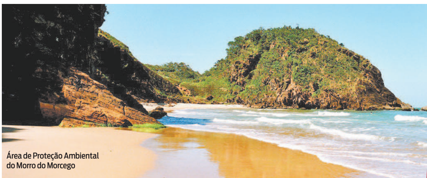
Área de Proteção Ambiental do Morro do Morcego