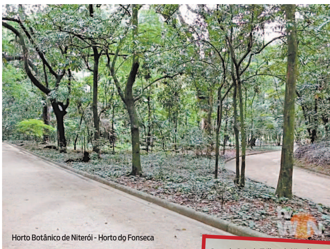
Horto Botânico de Niterói - Horto do Fonseca

Além da versão impressa, acesso ao Guia de Trilhas de Niterói pode ser feito pela internet