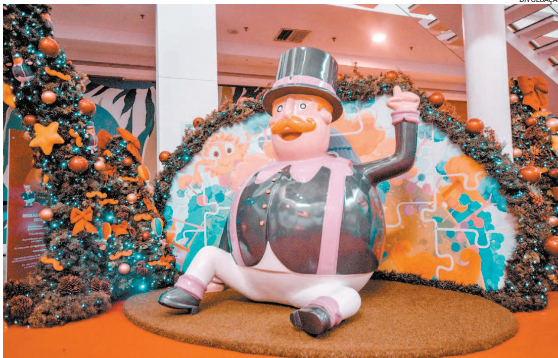
O Bitá guia as crianças nas aventuras junto com os personagens Lila, Dan e Tito, com muita alegria

A árvore, símbolo mais emblemático do Natal, tem 12 metros de altura e está na Praça de Eventos, no 1º piso, com outras 20 árvores enfeitadas com miniaturas dos personagens, onde os visitantes podem contemplar cada detalhe de sua rica de-