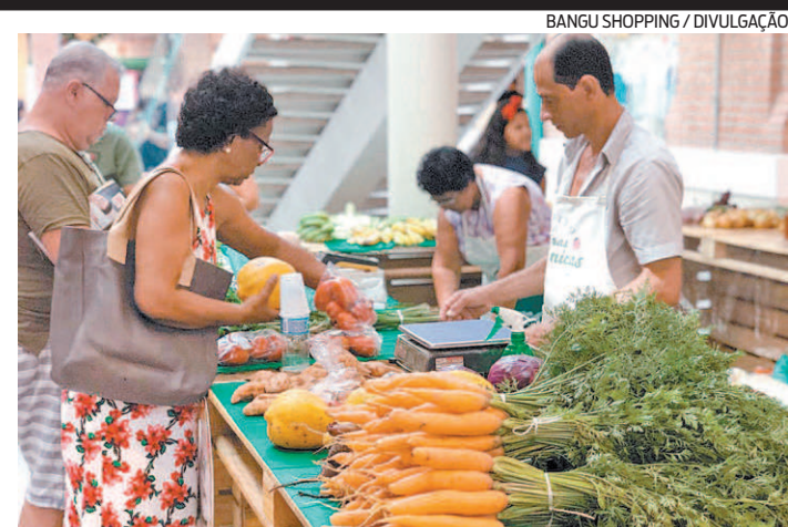
Desta vez, o evento vai contar com produtos para a ceia natalina

23 a 29/11, a três números, aumentando ainda mais as chances de ganhar. A promoção termina no dia 27. O sorteio será realizado pela Loteria Federal no dia 6 de janeiro de 2021 e o resultado divulgado no dia seguinte. Para mais informações, consulte o regulamento no site do Via Parque ( viaparqueshopping.com.br ).