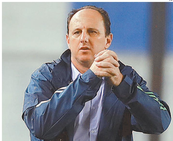
Rogério Ceni ainda precisa aprender muito como técnico