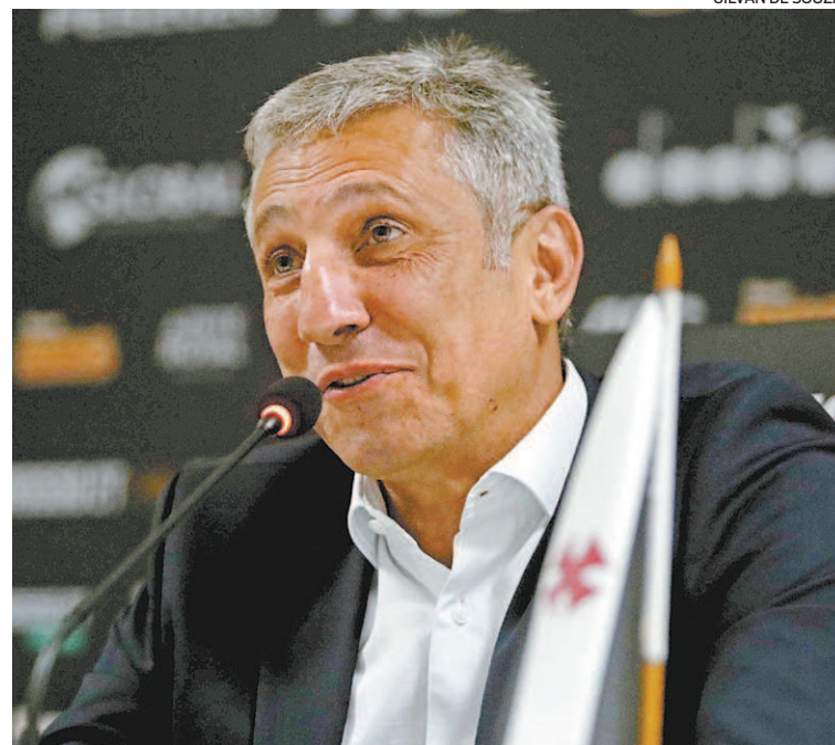
Campello garantiu que a transição presidencial será tranquila