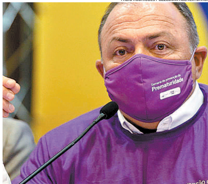
Pazuello considerou o lockdown em várias cidades como erro