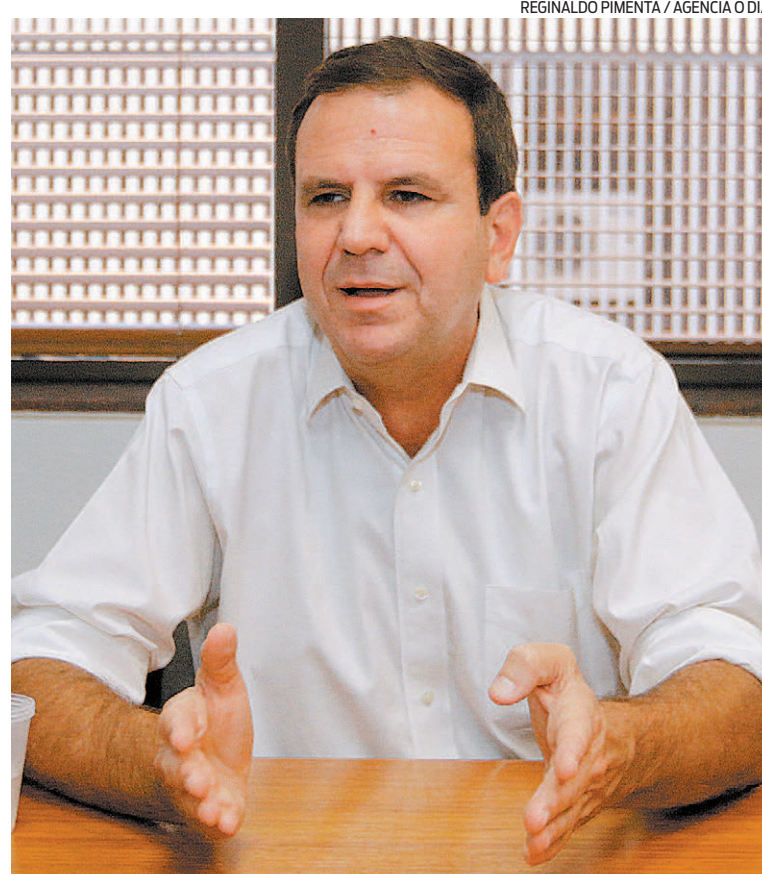
Eduardo Paes está de olho no legado que Crivella vai deixar.

Lembre-se ainda que “o alto grau de organização sindical do funcionalismo pressiona a despesa para cima, seja por reajustes reais, seja por ampliação de contratações”. A situação do Rio não é confortável em termos de receita, déficit, dívida e saldo de caixa. Por isso, é bom saber que a nova administração do Rio, alerta o professor, “não terá muito espaço para contratar e conceder reajustes”.