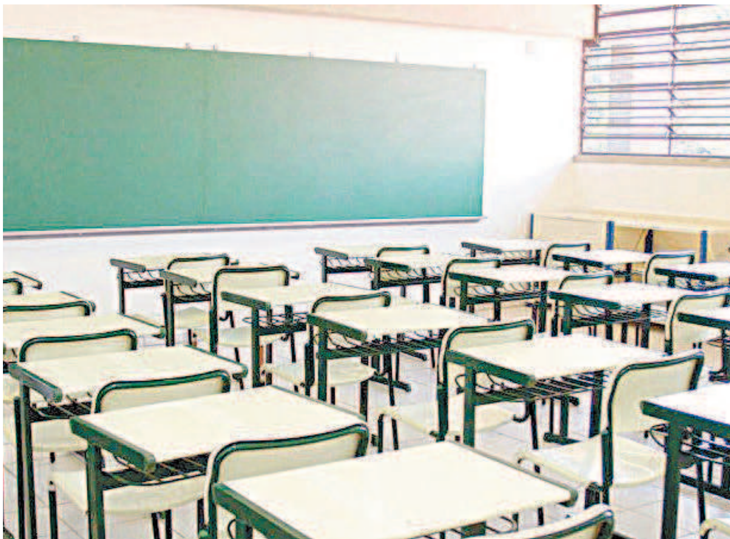
Sindicato informa que 365 escolas estão fechadas no município. Escolas devem voltar em fevereiro. Dois anos em 1 recebe críticas

Analisando as falas de Paes, Gustavo conclui que ainda é cedo para entender o que vem por aí. “As falas dele estão carregadas do clima de eleição. Vamos vislumbrar a posição do governo quando