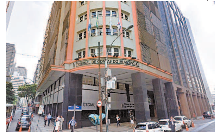
Tribunal de Contas do Município dará palavra final amanhã