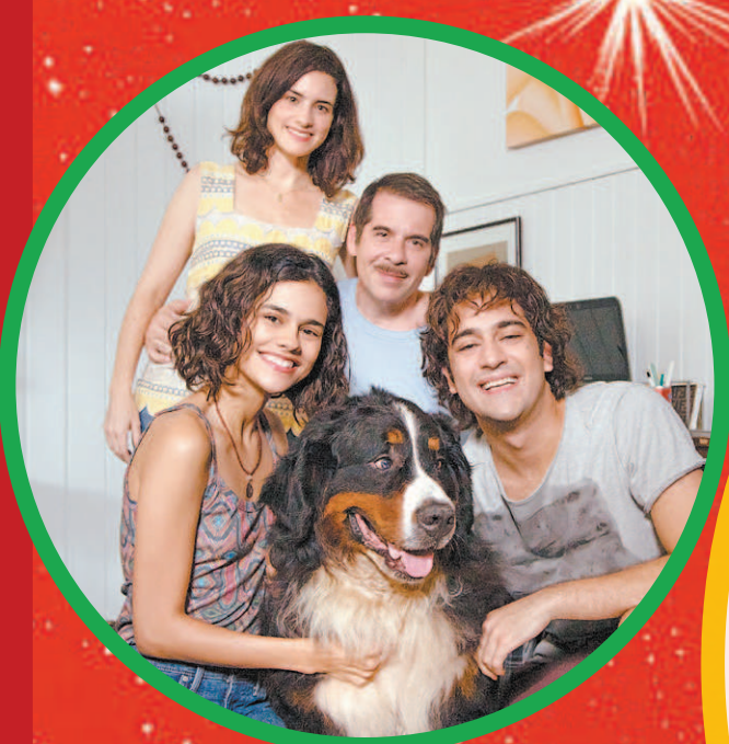
Leandro Hassum e o elenco de “Tudo Bem no Natal que Vem”: estreia

Leandro Hassum protagoniza primeiro filme de Natal brasileiro produzido pela Netflix. “Muita gente vai se identificar com os personagens”, diz