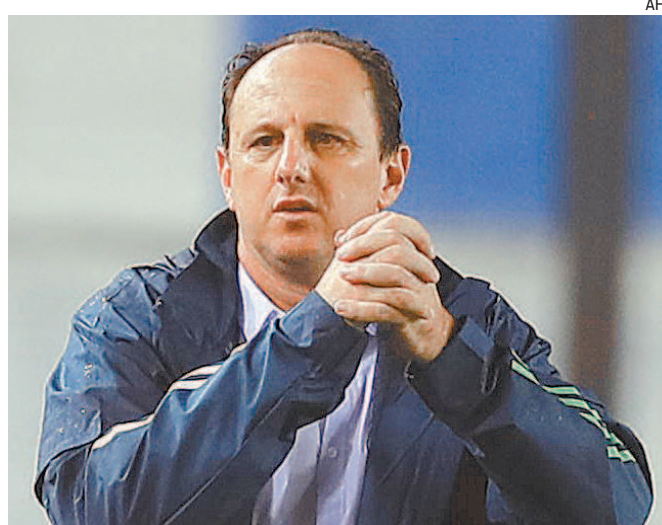
Rogério Ceni ainda precisa aprender muito como técnico