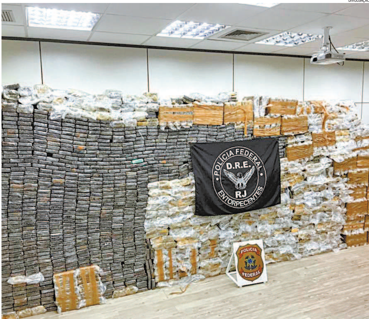
Agentes da Polícia Federal apreendem cerca de 2,5 toneladas de pasta base de cocaína em Duque de Caxias, na Baixada Fluminense

“Podemos dizer que a droga chegou por maneiras diferentes: por terra, meios marítimos e aéreos. Não sabemos qual destino ela teria, nem podemos dizer a qual facção criminosa a droga pertencia, ainda estamos investigando. Todo este material será incinerado. Este foi o início e meio de uma investigação importante que ainda continua”.