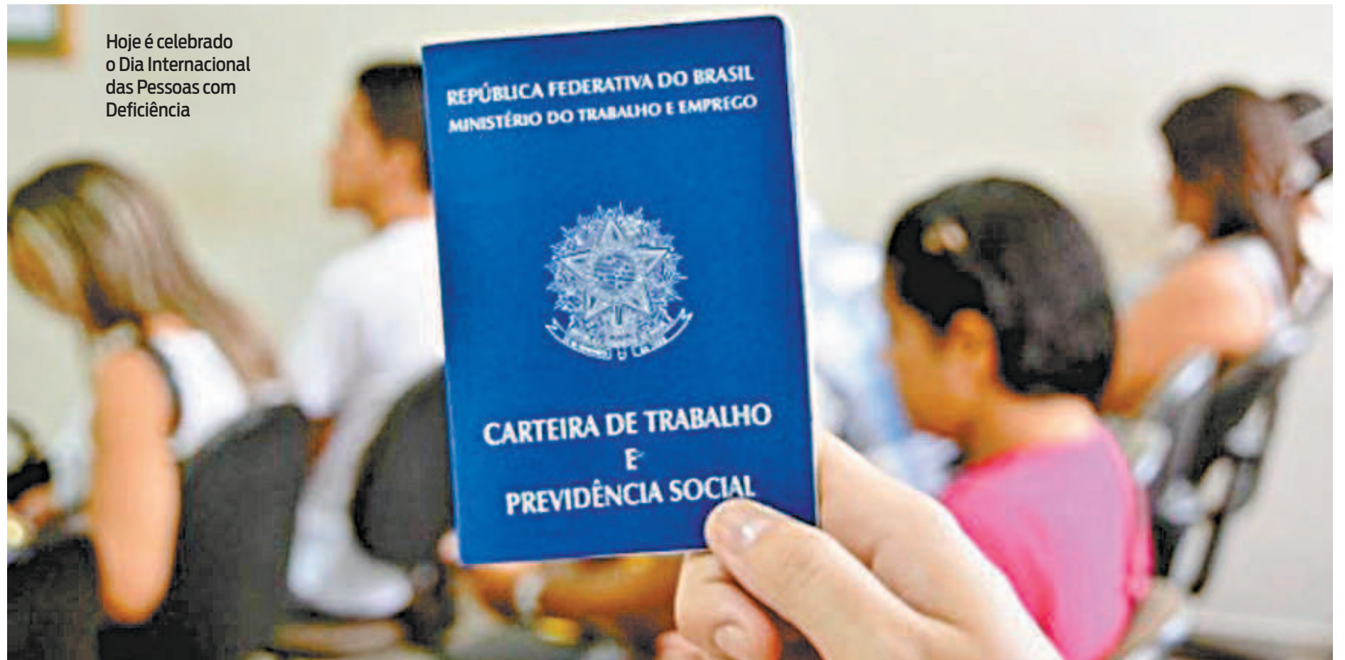
Hoje é celebrado o Dia Internacional das Pessoas com Deficiência

“O mutirão tem o objetivo de tornar em ação efetiva nossos esforços com relação a inclusão de pessoas com deficiência no mercado de trabalho. Para nós, o evento acontece como um impulsionador de empregabilidade para esse público que está em busca de oportunidades, é capacitado mas, esbarra, muitas vezes,