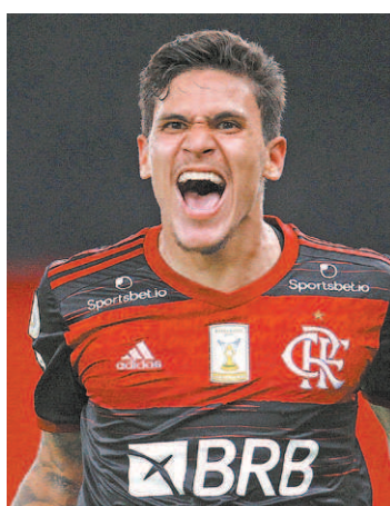
Pedro pode ir embora

O Flamengo planejava chegar ao menos até a semifinal da Libertadores e da Copa do Brasil. A eliminação para o Racing, terça-