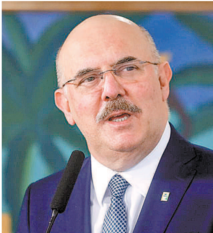
Ministro Milton Ribeiro vai revogar a portaria publicada ontem

Ele também disse que consultou mantenedores de universidades antes de publicar a portaria de hoje e que não esperava tanta resistência. “A sociedade está preocupada, quero ser sensível ao sentimento da popu-