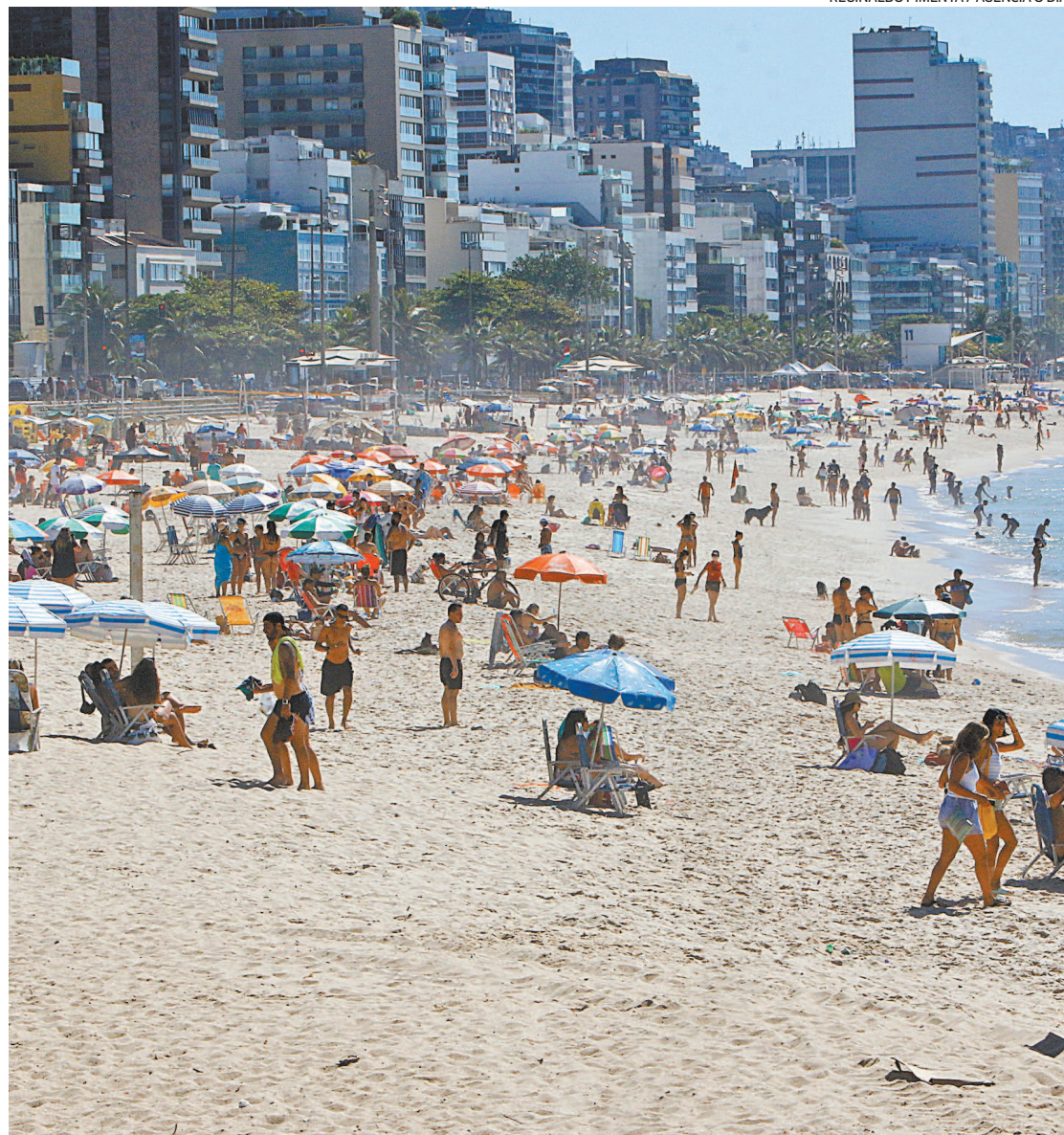
Movimentação na areia do Leblon: uma das medidas sugeridas pela UFRJ é o fechamento de praias

O transporte público inadequado também está contribuindo para a transmissão do