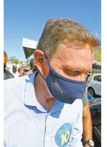
Crivella não procurou Paes

Crivella disse algumas vezes que o Psol estava apoiando Paes e negociando a Secretaria de Educação. E que, juntos,