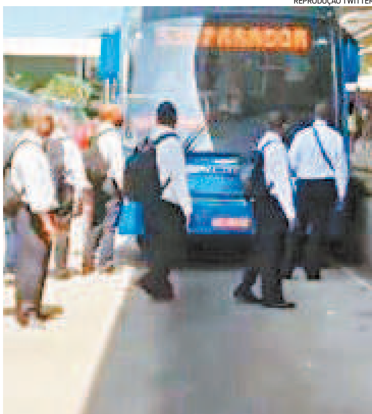
Na última segunda-feira, a greve do BRT provocou o caos na cidade

responsabilidade do operador adotar medidas emergenciais em caso de greve ou paralisação, assegurando a operação e atendimento à população. “Ainda que os operadores de ônibus possam ter sido afetados com a queda na demanda na pandemia, é preciso manter a regularidade, tendo em vista o caráter essencial dos serviços, conforme cláusula 9ª do contrato de concessão.”