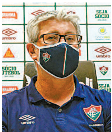
Odair: luta entre os primeiros

“Satisfeito e orgulhoso. Estão dando resposta. Na transição da base para profissional, tentamos criar o melhor cenário possível, dentro de um time consistente, para proteger. Quando mexe muito forte na estrutura