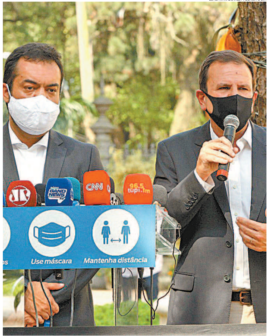
Castro (E) e Paes durante coletiva no Palácio Guanabara: bandeira não deverá mudar para a amarela

“Quando estávamos nas piores bandeiras, tínhamos um número x de leitos ocupados só de covid. Esses números diminuiram. Não temos hospitais só de covid. Estamos aumentando essa base de leitos. Só nessa semana mais de quarenta eventos foram fechados. As medidas foram necessárias para que possamos ter um bom Natal. Com a economia funcionando, tudo integrado”, disse o governador em exercício. “Todos os dias estamos abrindo leitos, os chamados leitos escondidos. É o momento de abrir leitos”.