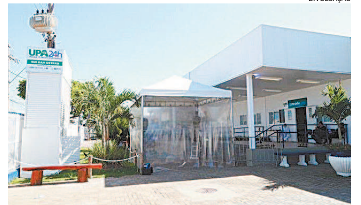
O crime chocou a população de Rio das Ostras

A investigação é resultado de um trabalho integrado e de cooperação internacional das instituições brasileiras e paraguaias, que também contou com a participação do Núcleo de Cooperação Policial Internacional (Interpol/RJ) e da Adidância da PF em Assunção, no Paraguai.