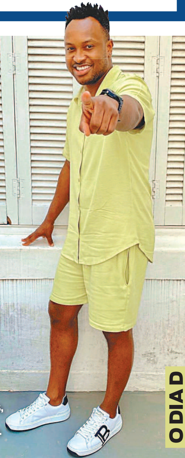
REPRODUÇÃO DO INSTAGRAM

No Dia Nacional do Samba, sem aglomerações, mas com comemoração. P. 15