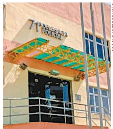
Agentes prenderam a procurada

A jovem foi atendida no pronto-socorro municipal e passa bem. A ocorrência também é investigada na 128ª Delegacia de Polícia.