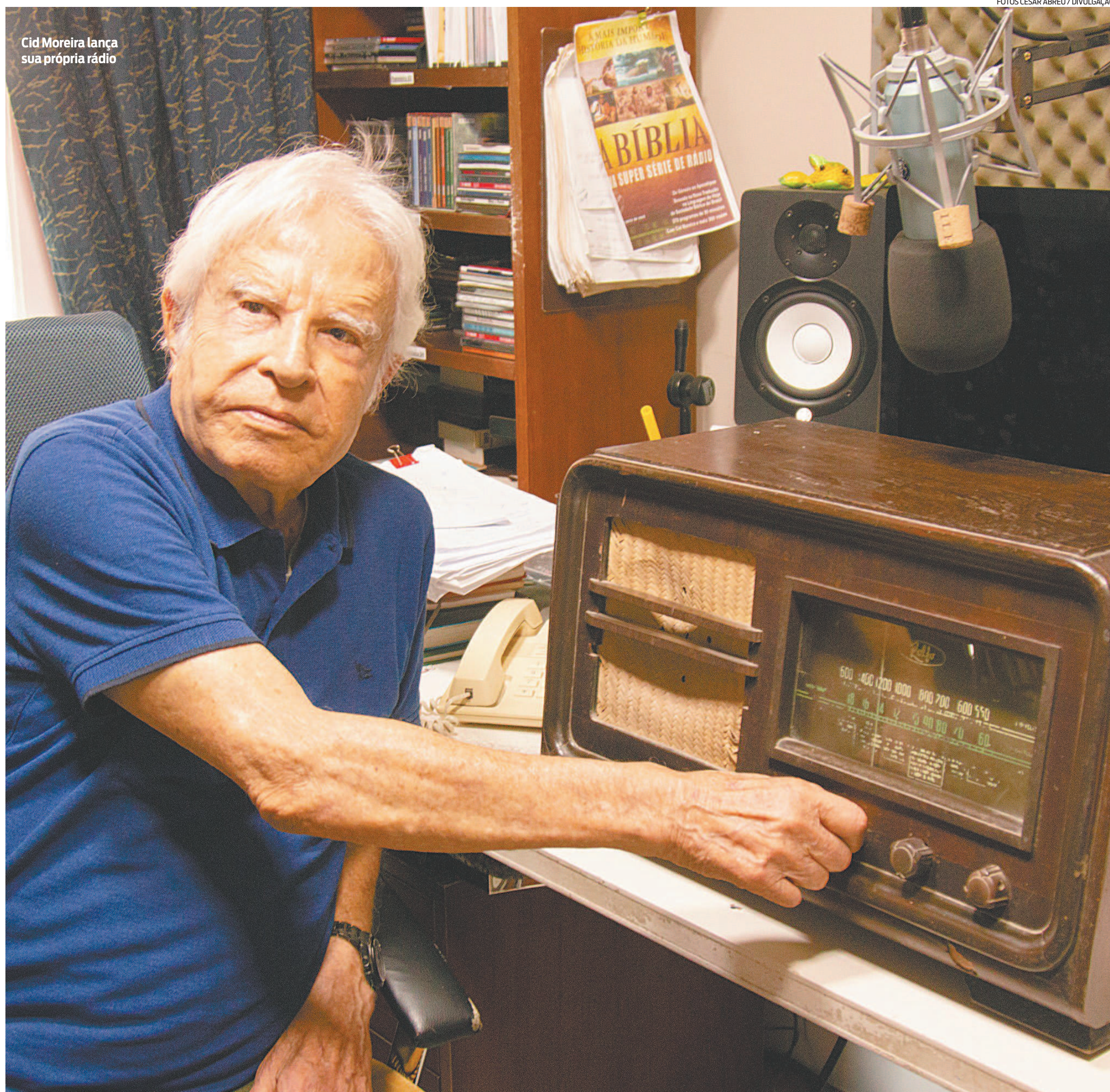
Cid Moreira lança sua própria rádio