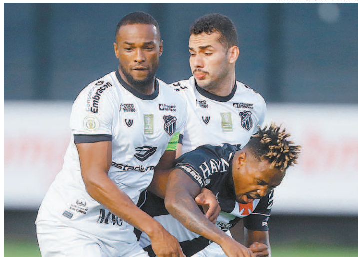
O Vasco foi dominado pelo Ceará dentro de São Januário: 4 a 1