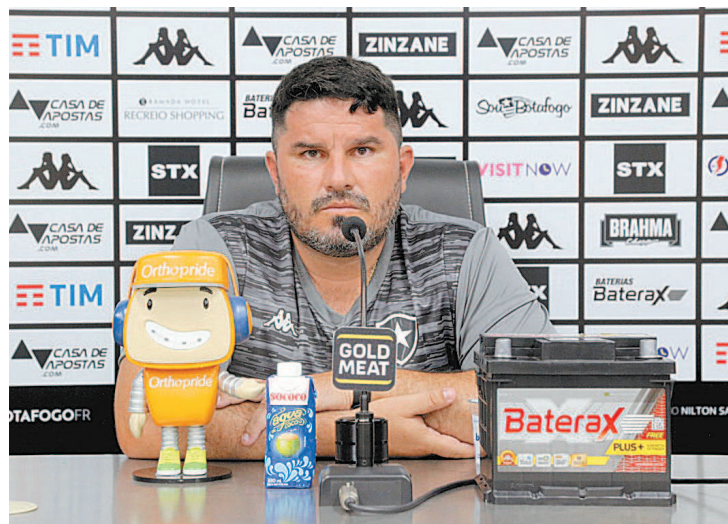
Barroca tem quadro gripal, mas passa bem e já iniciou o isolamento