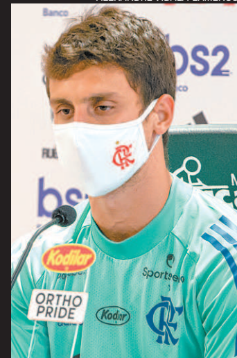
Rodrigo Caio pode reforçar o Fla