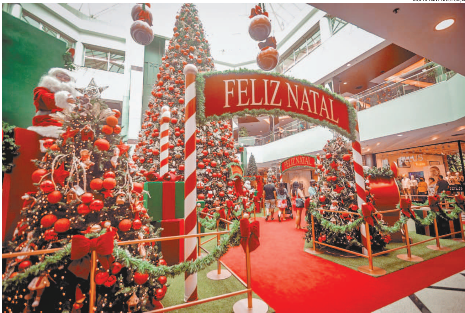
A 'Fábrica de Embrulho de Presentes' é dedicada a customizar os itens dos clientes dos shoppings da Barra, que terão shows e performances

Entre os destaques, está a 'Fábrica de Embrulho de Presentes', dedicada a custo-