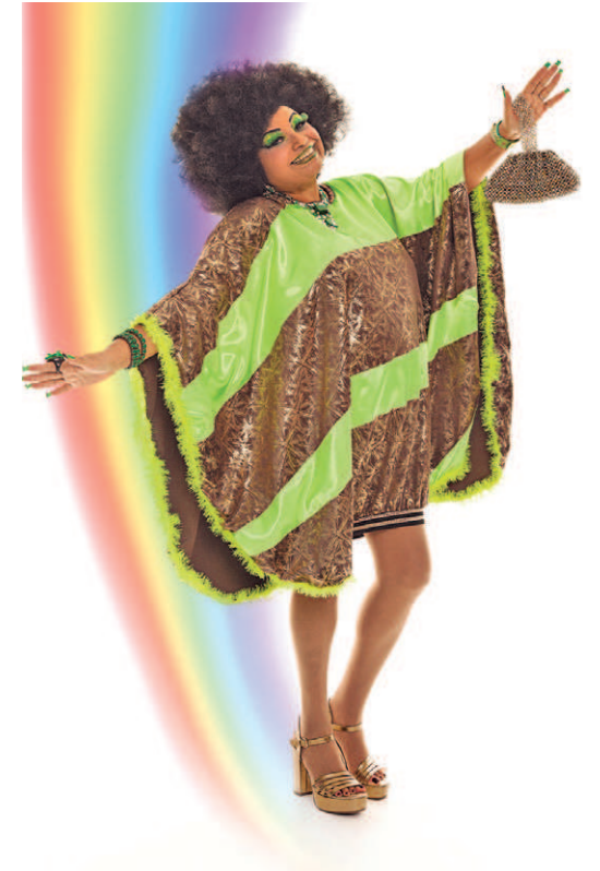
Sonia Sabina ilustra agosto com muito brilho