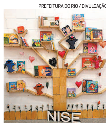
A 'Árvore dos Sonhos' da creche

A Nise da Silveira se inscreveu no projeto Vila Sésamo, voltado para a rede pública de ensino, que destinou R$ 1,5 mil para a creche realizar um sonho coletivo das