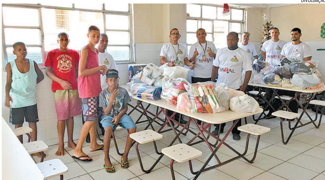
A Transporte Flores é uma das empresas envolvidas na campanha de doação para as instituições

Este é o 18º ano consecutivo que o Grupo JAL realiza a ação. Desde 2002, já foram distribuídas 82,5 toneladas de alimentos e 120 mil itens, entre roupas, calçados e brinque-