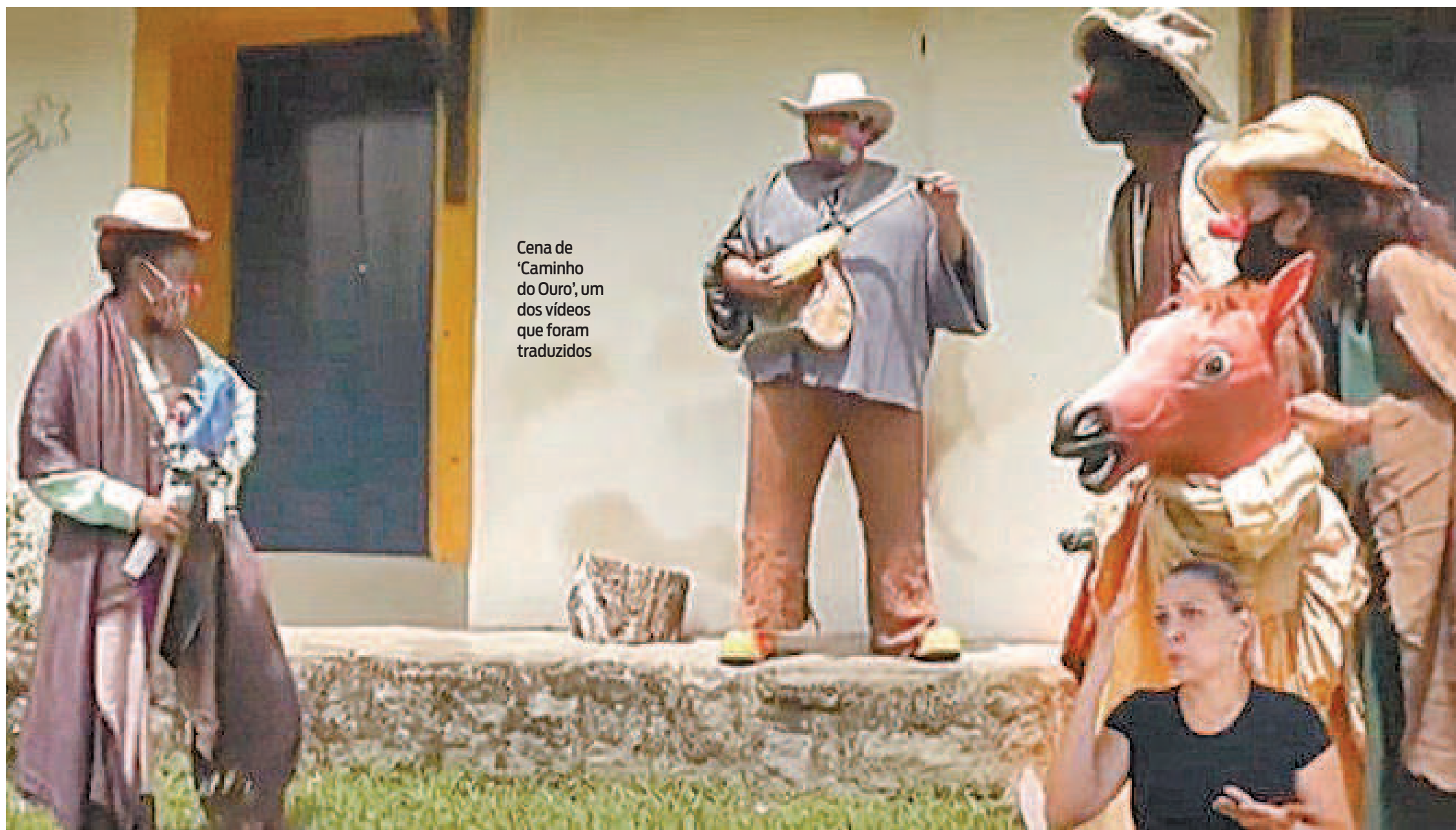
Cena de 'Caminho do Ouro', um dos vídeos que foram traduzidos