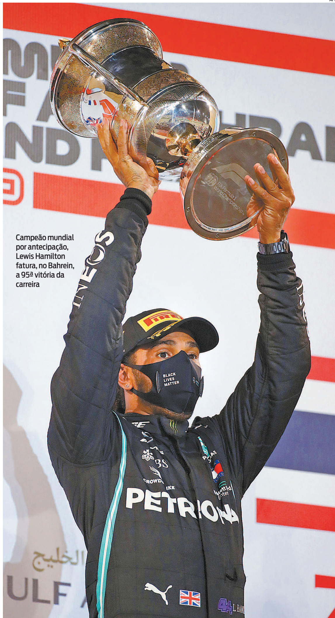
Campeão mundial por antecipação, Lewis Hamilton fatura, no Bahrein, a 95ª vitória da carreira