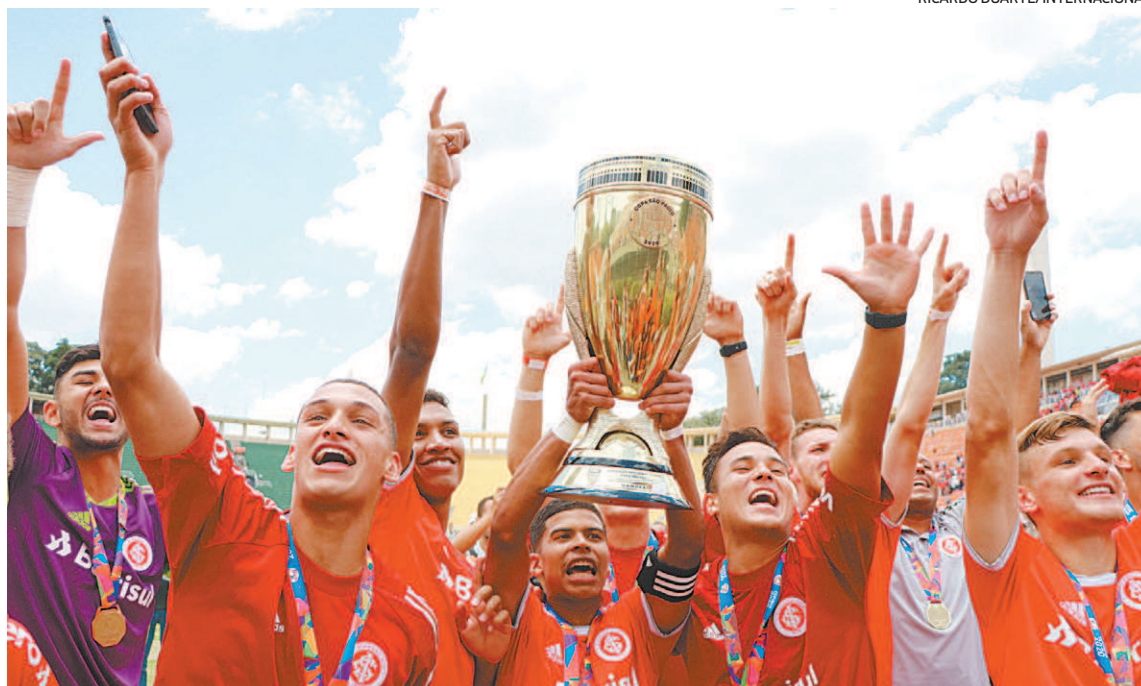
Garotos do Internacional festejam a conquista da Copinha deste ano, sobre o maior rival, o Grêmio, nos pênaltis