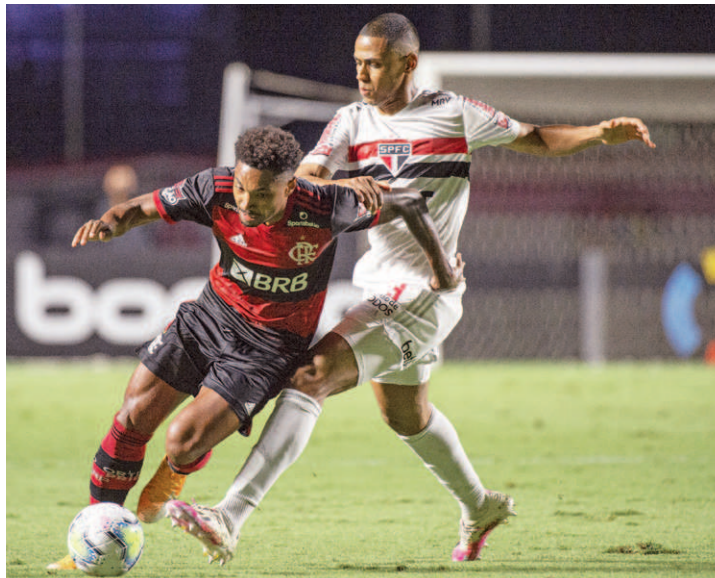
Fla pegou o São Paulo três vezes em 2020: 9 a 2 para o Tricolor