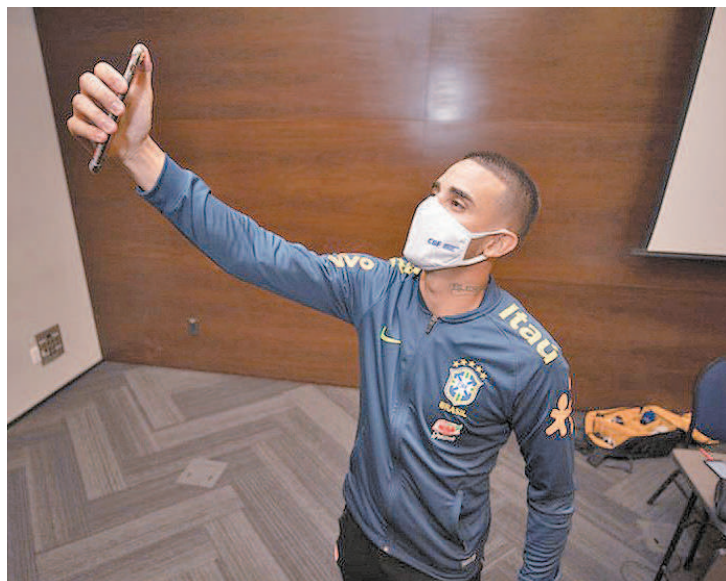
Galhardo usa a camisa 17 em homenagem à saudosa avó