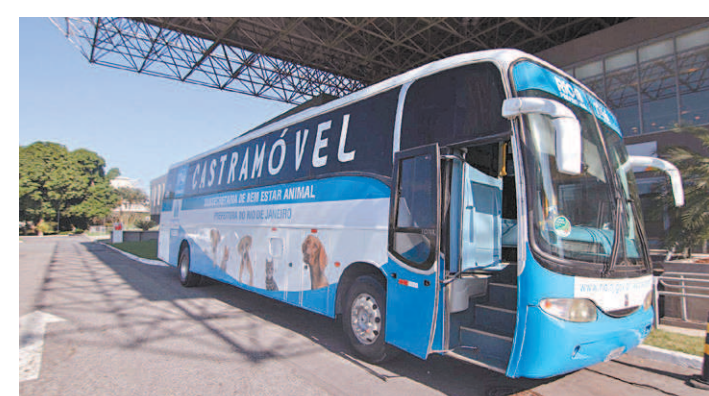
Serão disponibilizadas 270 vagas para as cirurgias gratuitas

Devido à pandemia do novo coronavírus, o horário de votação foi ampliado e ocorrerá das 7h às 17h. O horário entre 7h e 10h é preferencial para pessoas acima de 60 anos, por serem do grupo de risco para a Covid-19. A Guarda Municipal alerta, ainda, a população para o uso de máscara de proteção facial, evitar aglomerações e higienizar as mãos com álcool em gel antes e depois de votar.