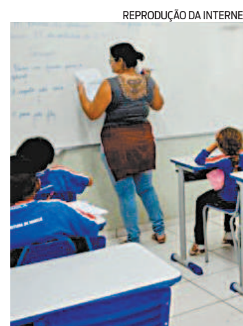
Serão 100 vagas para bolsas

pelo Ministério da Educação. Os interessados devem acessar a página www.eadepf.rioeduca.rio.gov.br e se inscrever até 11 de dezembro. Depois de fazer login na plataforma, o candidato deverá acessar o link “Programa Anual de Bolsas” e utilizar a chave de inscrição: Bolsa#2021. Para esclarecer dúvidas ou problemas, é necessário entrar em contato pelo e-mail suporte.eadepf@rioeduca.net .