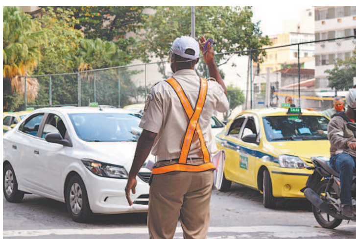
Guardas municipais vão atuar em turnos, seja a pé ou em viaturas

Os guardas municipais vão realizar ações de ordenamento urbano; fiscalização de trânsito; coibindo aglomerações; darão apoio às unidades operacionais no entorno dos locais de votação e poderão ser acionados em caso de necessidade. As equipes atuarão em turnos, a pé e também com auxílio de 58 viaturas e 12 motocicletas em todas as regiões do Rio.