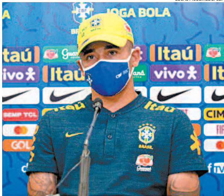
Gabriel Jesus está confiante em uma vitória sobre os venezuelanos