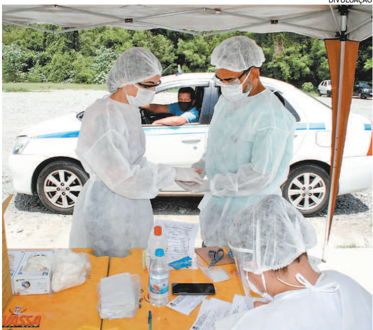
Tenda do estacionamento do Centro de Tradições Nordestinas

Secretaria de Saúde de São Gonçalo amplia atendimento e número de unidades realizando o exame: agora são 13 postos