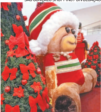
Shopping arrecada brinquedos

Shopping está coletando doações de brinquedos para creche de Ipiíba