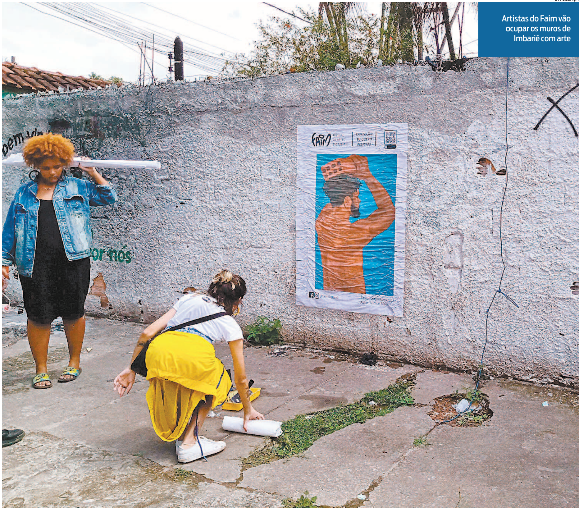
Artistas do Faim vão ocupar os muros de Imbariê com arte