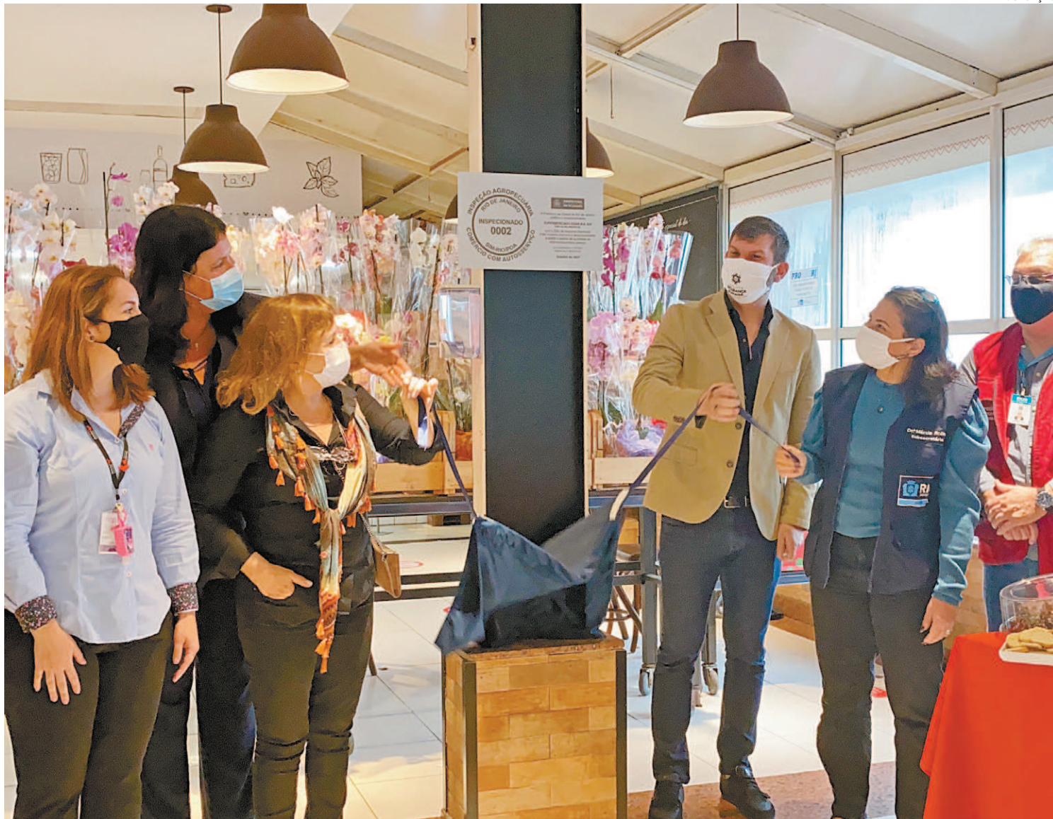
A cerimônia de entrega do SIM contou com a presença de autoridades municipais, representantes do setor e da rede Zona Sul

“A gente sempre procura superar a expectativa dos clientes. Com o SIM, nós pas-