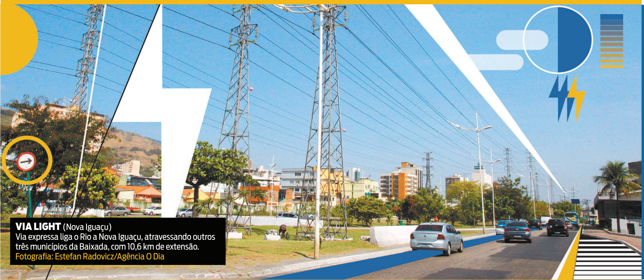
VIA LIGHT (Nova Iguaçu) Via expressa liga o Rio a Nova Iguaçu, atravessando outros três municípios da Baixada, com 10,6 km de extensão.