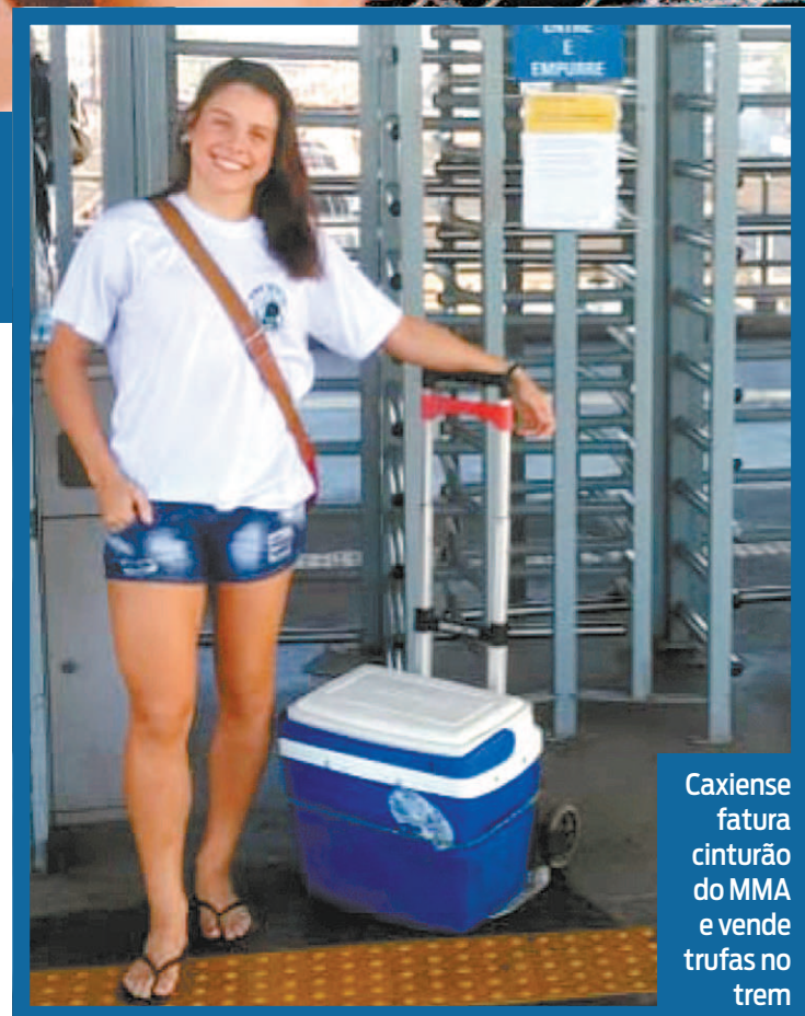
Caxiense fatura cinturão do MMA e vende trufas no trem