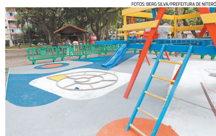
Parquinho infantil ganhou piso emborrachado e novos brinquedos