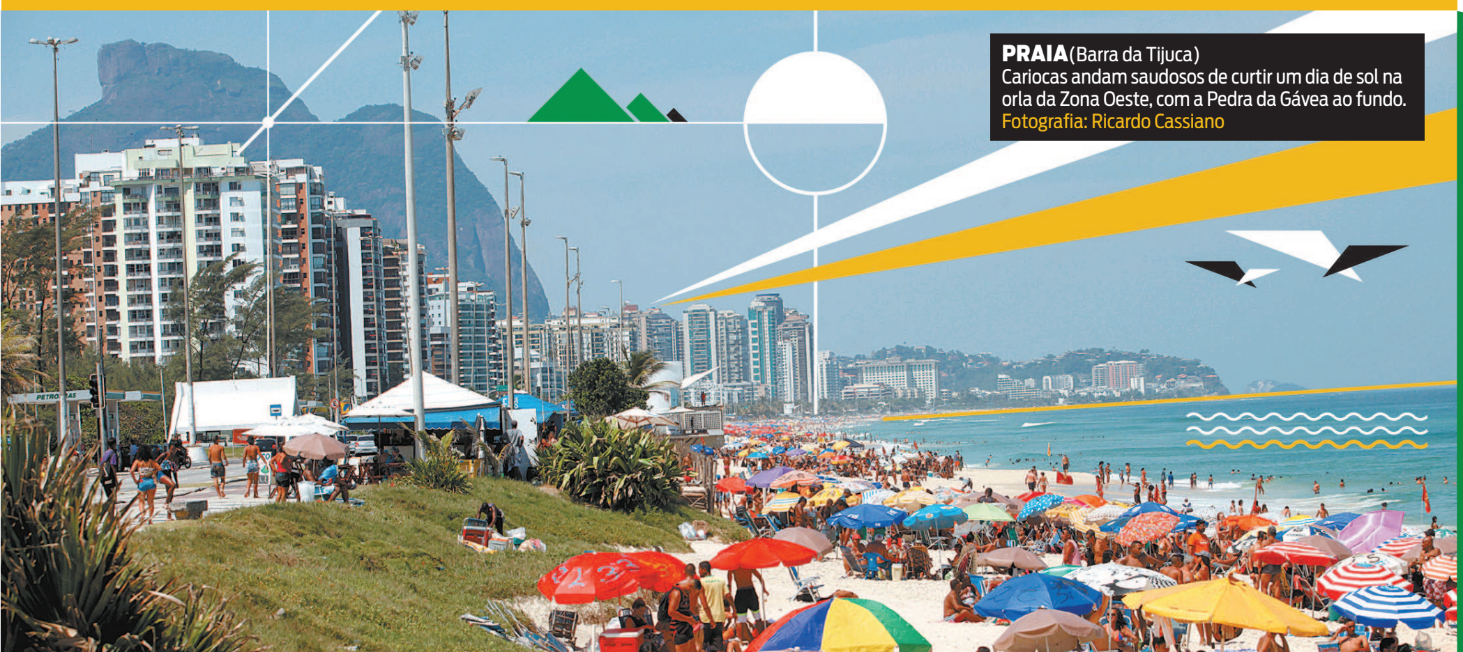
PRAIA (Barra da Tijuca) Cariocas andam saudosos de curtir um dia de sol na orla da Zona Oeste, com a Pedra da Gávea ao fundo.