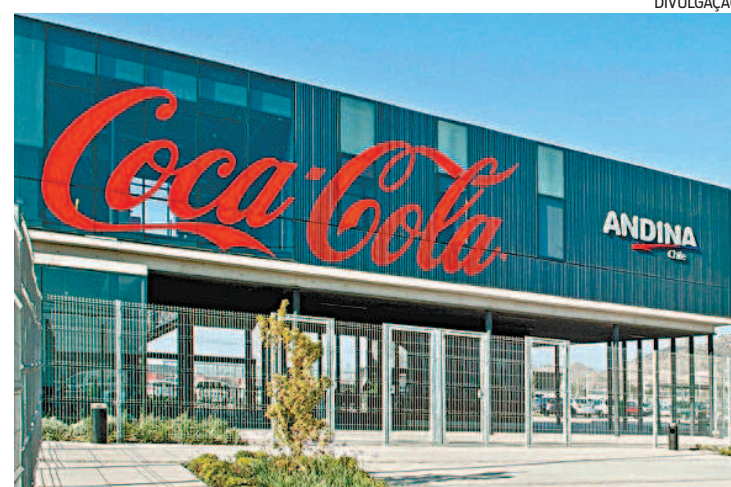
O grupo Coca-Cola Andina atua no Brasil com três fábricas

Para os interessados nas 80 vagas de motorista de entregas, a empresa busca pessoas com Carteira Nacional de Habilitação (CNH) D ou E, que tenham experiência na direção de caminhões. O salário fixo é de R$1.587. Parte das vagas também são para Bangu e Jacarepaguá.