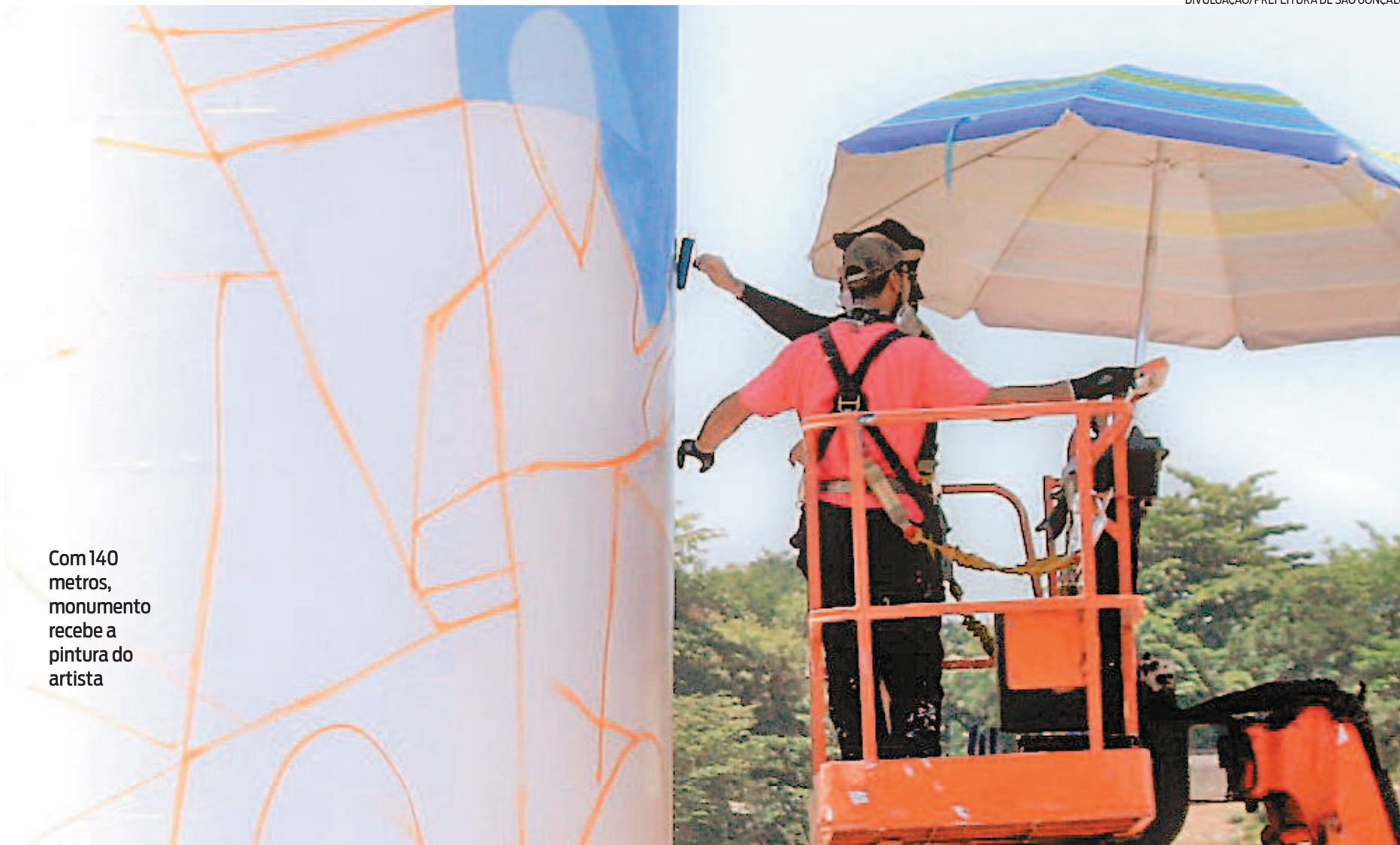
Com 140 metros, monumento recebe a pintura do artista

“Poucos sabem que São Gonçalo ostenta o título de berço do grafite no Estado do Rio, onde sinto muito orgulho de fazer parte dessa história. Me sinto muito honrado em retribuir com minha arte na cidade que me deu tudo, formação como ser humano