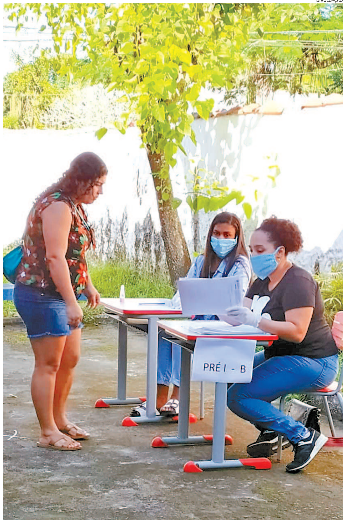
Alunos sem acesso à internet recebem material impresso, entregue aos responsáveis nas unidades

Os responsáveis pelos alunos da Classe Especial recebem o material em suas residências. Basta entrar em contato com a direção das unidades escolares para que o conteúdo seja entregue no local desejado.