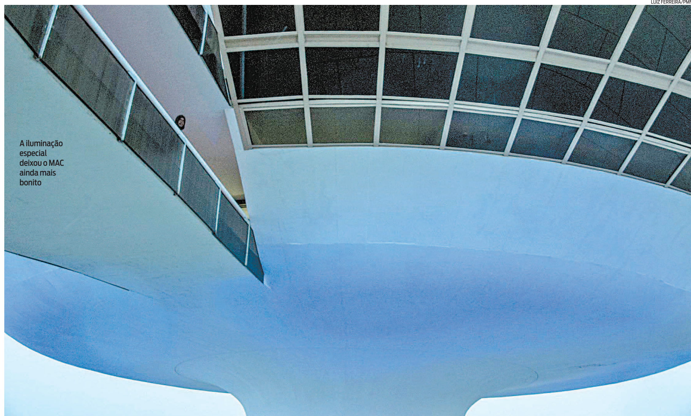
A iluminação especial deixou o MAC ainda mais bonito

internacional que alerta sobre a saúde do homem e, em especial, a prevenção ao câncer de próstata. A Secretaria Municipal de Saúde (SMS) realizará diversas atividades e ações informativas sobre o tema ao longo do mês.