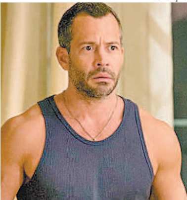
HAJA CORAÇÃO 19h30 | GLOBO | 12 anos

■ Ester pergunta a Cassiano se ele confia em Cristal, que recusa a proposta de Alberto. Chico se emociona ao saber que a homenagem que Cassiano lhe prestou foi divulgada no jornal. Duque mostra a Cassiano o lucro do Flor do Caribe obtido com o show.