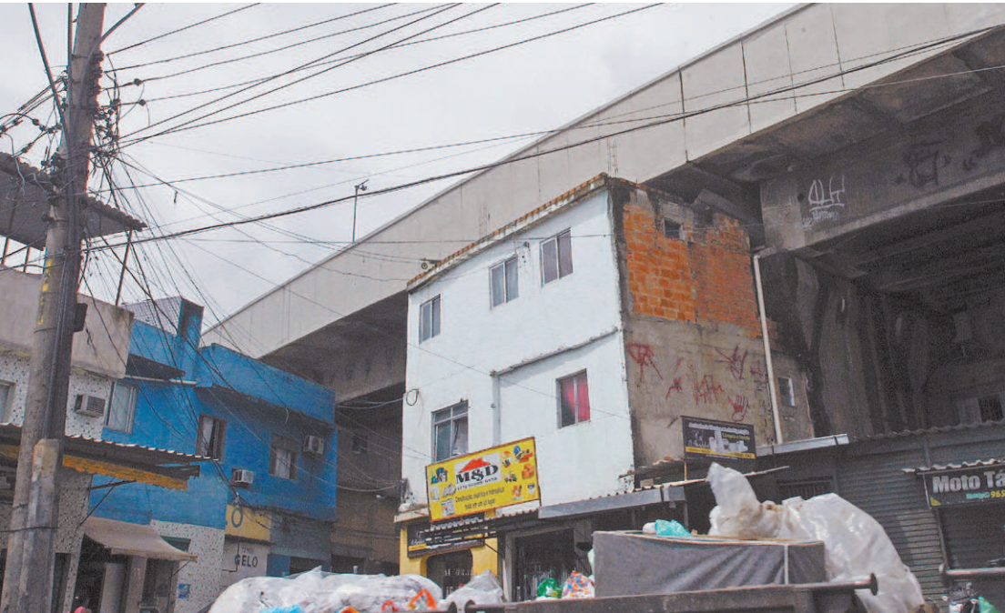
Casas erguidas sem autorização debaixo da linha do metrô na Avenida Dom Hélder Câmara, no Jacaré