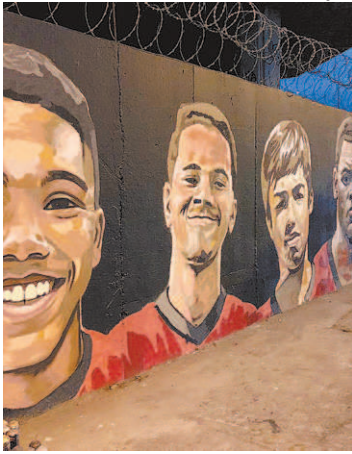
Muro com arte grafitada