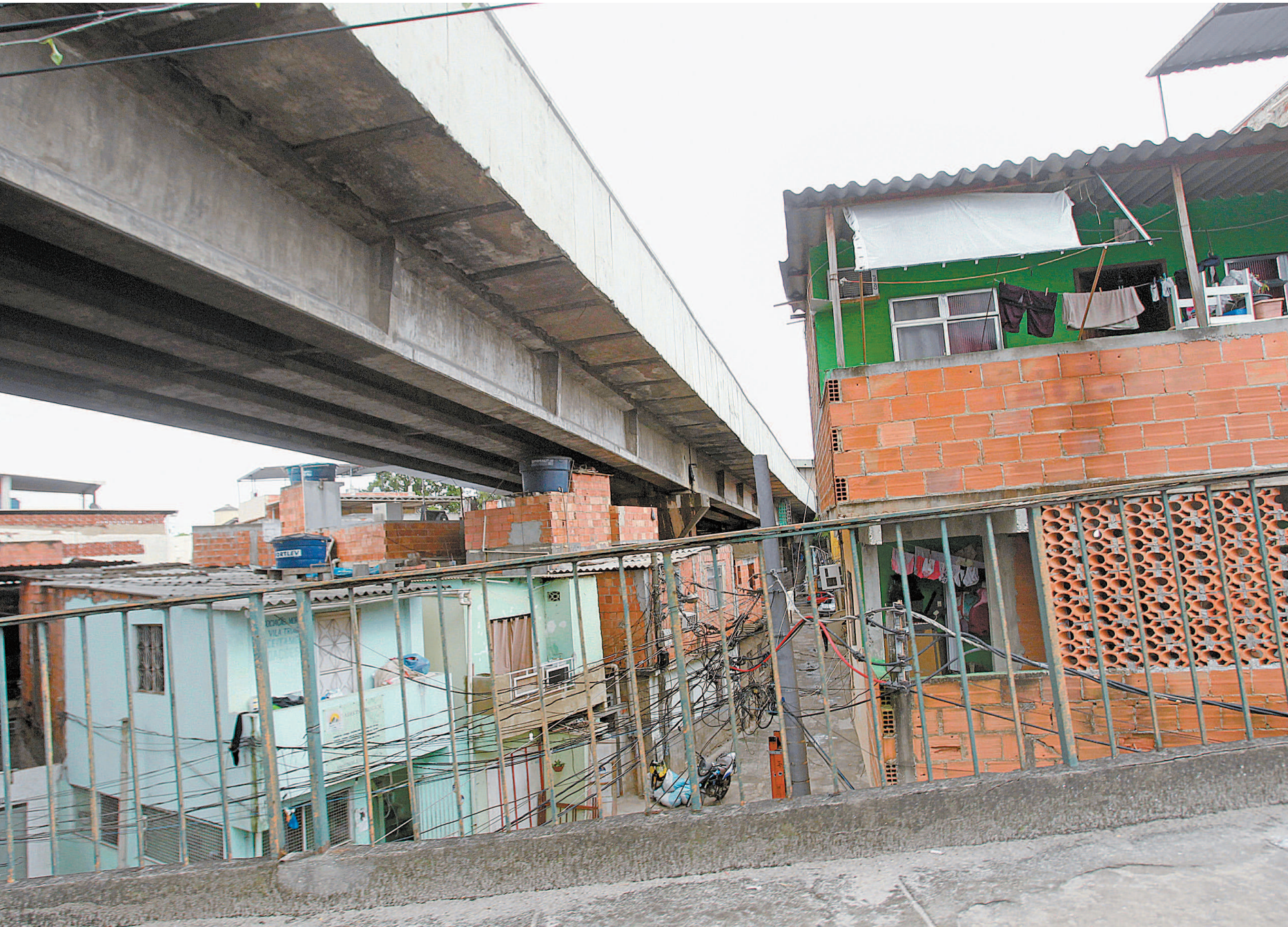
Construções irregulares sob viaduto em Triagem, Zona Norte do Rio: primeiros moradores chegaram há oito anos pela promessa de um apartamento no conjunto Bairro Carioca