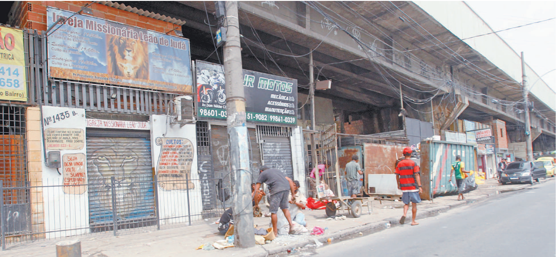
Na Avenida Dom Hélder Câmara, próximo a Benfica, moradias, igrejas e comércios se misturam a outras construções precárias sob a estrutura do metrô: risco para todo mundo