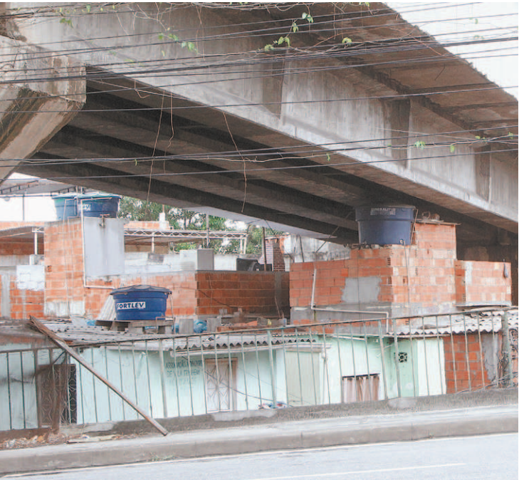
Em Triagem, habitações impressadas entre a ponte e o metrô