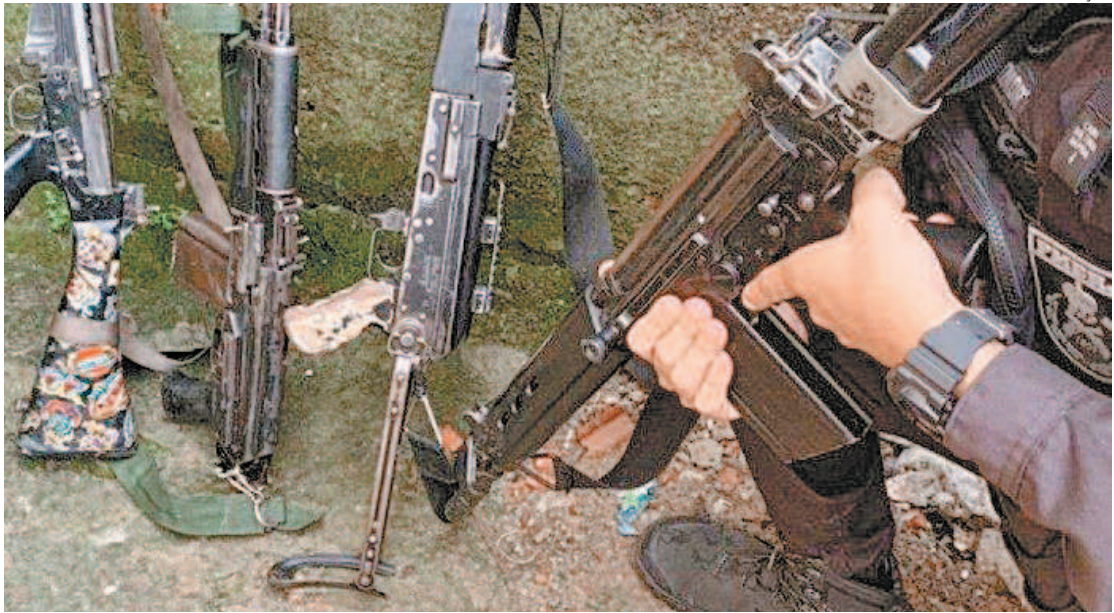
A PM apreendeu fuzis, granadas e uma pistola, além de 16 veículos roubados que foram recuperados

Dois homens suspeitos de integrarem a criminalidade local foram baleados e morreram. Cinco milicianos foram presos. A PM também apreendeu fuzis, granadas e uma pistola. Dezesseis veículos roubados foram recuperados e 32 botijões de gás foram apreendidos. Na comunidade da Charchinha, na Praça Seca, a polícia estourou um depósito usado como central clandestina de distribuição de rede internet. Houve apreensão de vários equipamentos, mas nenhuma pessoa estava no local. Mo-