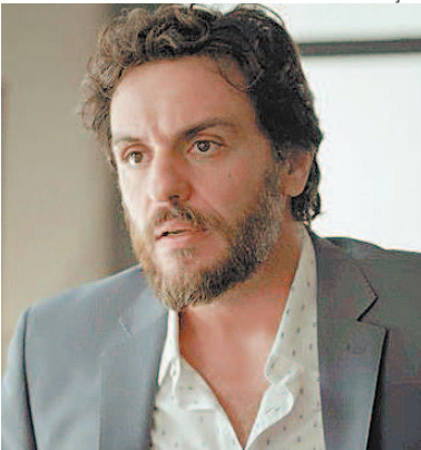
A FORÇA DO QUERER 21h30 | GLOBO | 14 anos

■ Apolo desiste de falar sobre seu noivado com Tancinha. Carmela se irrita com Shirlei e afirma que Francesca gosta mais da irmã. Tancinha visita Beto. Adriana afirma a Apolo que há uma vaga de emprego como mecânico na equipe da empresa.