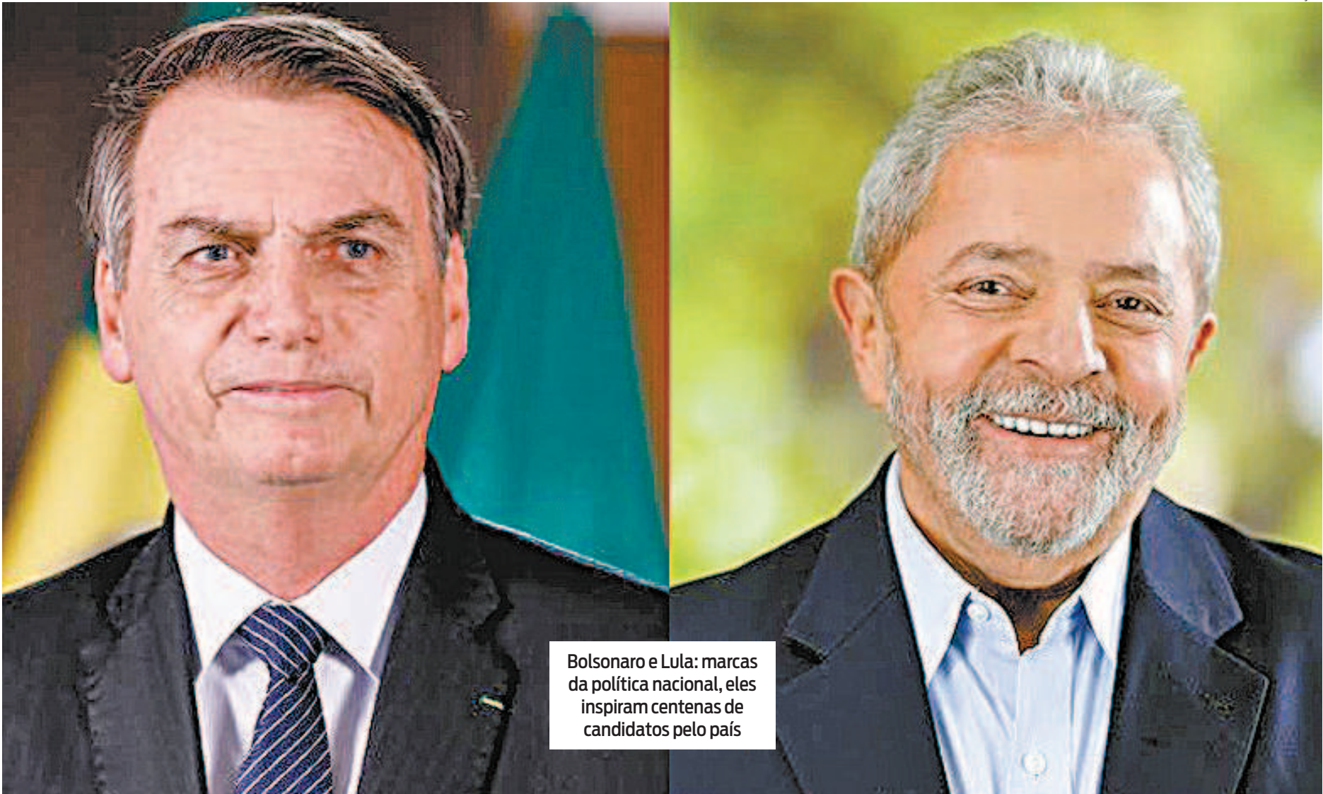
Bolsonaro e Lula: marcas da política nacional, eles inspiram centenas de candidatos pelo país

E, pra quem pensa que o Fla-Flu eleitoral se restringe ao duelo Bolsonaro x Lula, um aviso: o jogo das urnas ganhou proporções internacionais, rompendo fronteiras, mas mantendo a enorme polarização. Nas eleições deste ano, há três Trumps e 19 Obamas. É Fla-Flu ou Lakers x Celtics. O famoso duelo do basquete dos EUA? Com a bola, o eleitor: