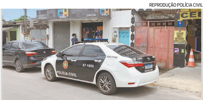
Várias delegacias especializadas participaram da operação

Além das investigações sobre homicídios, a ação teve como objetivo buscar provas que indiquem a participação da milícia em campanhas eleitorais feitas com financiamento de candidatos por apoiados pelos criminosos.