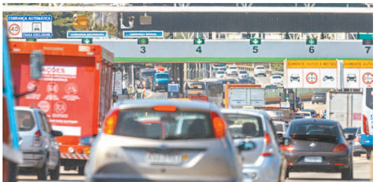
Ponte Rio-Niterói: a tarifa básica de carros passou para R$ 4,60

O reajuste foi publicado na quinta-feira, no