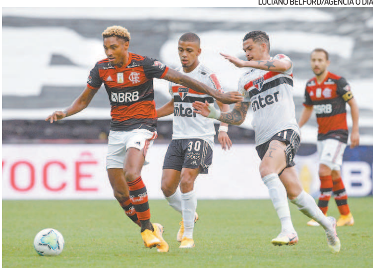
No duelo de domingo, o São Paulo goleou o Flamengo por 4 a 1

Para se classificar para as quartas de final, o Flamengo eliminou o Athletico-PR com duas vitórias nas oitavas de final. Já o São Paulo